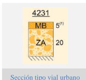
Ilustración 1: Sección tipo en viales urbanos.

La reposición de los fresados en viales urbanos se hará mediante una capa de mezcla bituminosa en caliente tipo AC16 surf S (S-12) B50/70, similar a la existente en la actualidad, según datos facilitados por el Excmo. Ayuntamiento de Marbella. En el caso de los saneos, la reposición del firme se hará mediante la extensión de zahorra artificial debidamente compactada hasta la cota de reposición del aglomerado, cuyo espesor será, como mínimo de 5 cm de mezcla bituminosa en caliente tipo AC16 surf S (S-12) B50/70.