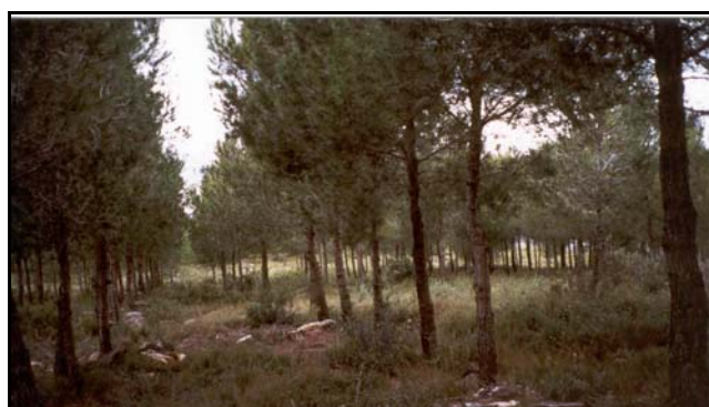
Demarcación de Vall d'Alba. Monte CS-1032 "Santa Bárbara". Vista de un rodal donde el arbolado existente ya está podado.