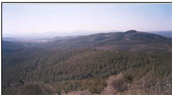
Demarcación de San Mateo. Monte CS-1012 "Ameler". Vista general de los rodales arbolados del monte de Ameler.