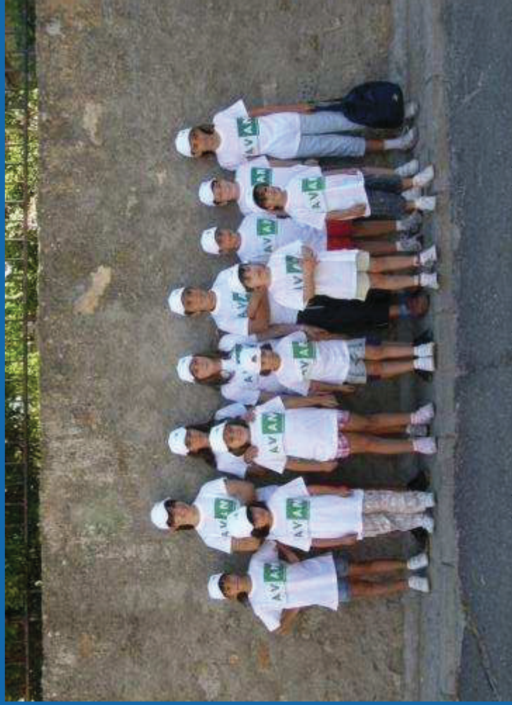
Voluntarios año 2009