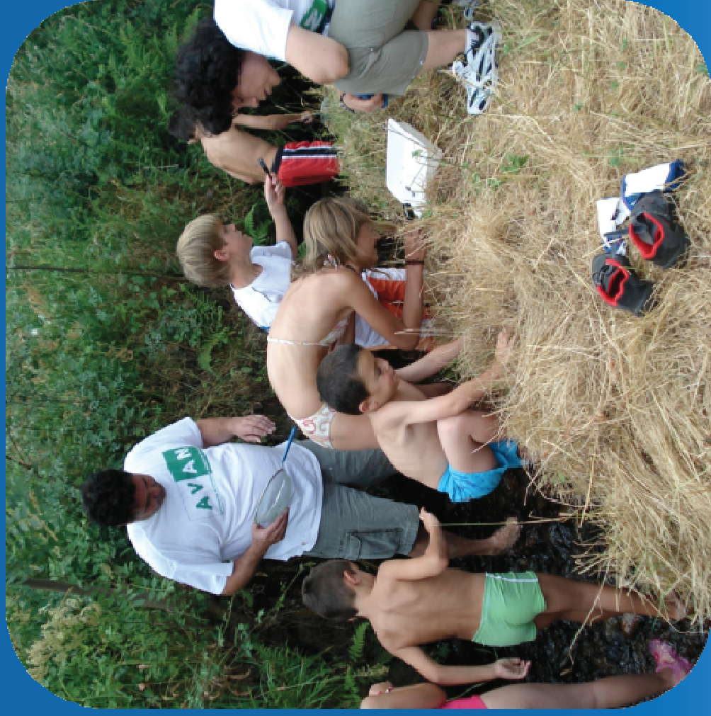
Voluntarios año 2011