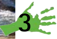
Tercer Premio/Categoría Ríos. "Agua estática, Agua en movimiento" Lagunas de Ruidera. Confederación Hidrográfica del Guadiana.