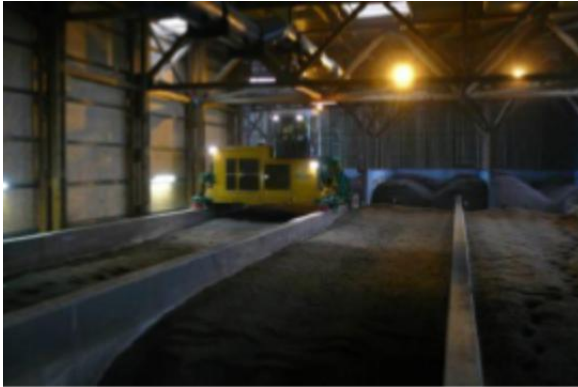
Ilustración 11: Compostaje de lodos en trincheras.