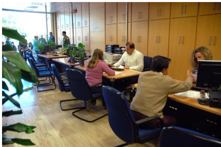
Ilustración 3: Oficina de atención al cliente.

La estructuración de dichos modelos tarifarios está enfocada a alcanzar los principios básicos de autosuficiencia económica (cobertura de costes del servicio), la equidad e igualdad por criterios de uso (en cada sistema o unidad de gestión), y la progresividad del precio a la magnitud del consumo (“bloques” de consumo a precios crecientes) buscando el resultado óptimo para el mantenimiento y el progreso de los estándares de servicio, la satisfacción de los clientes y de la ciudadanía en general.