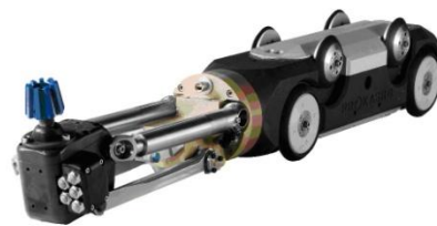
Ilustración 8: Robot para supervisión y de reparación.