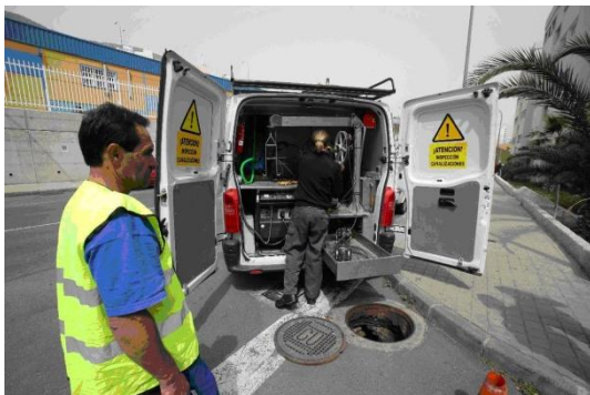
Ilustración 7: Empleado en trabajos en la red saneamiento.

La fijación de ordenanzas o reglamentos de vertido para mantener la adecuada disciplina de aporte de los caudales industriales y especiales, y el control rutinario de las calidades de los vertidos generados, se han identificado como técnicas relevantes para proteger la integridad de las infraestructuras de saneamiento.