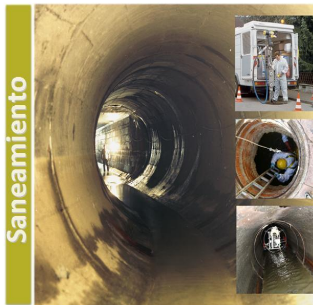
Ilustración 2: Fase de recolección de las aguas residuales (alcantarillado) en el saneamiento.