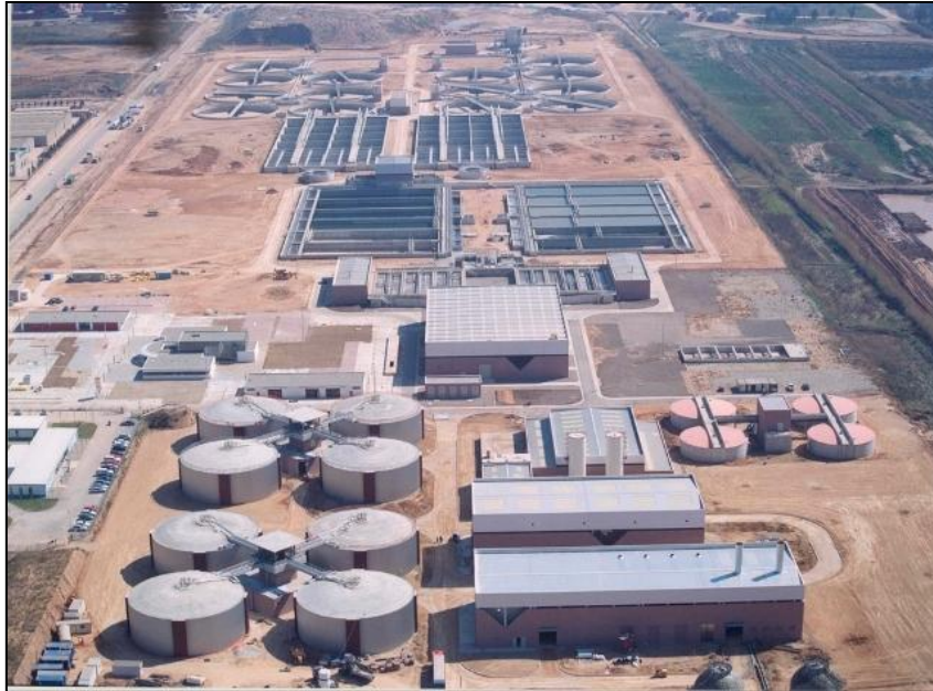
Ilustración 10: EDAR del Prat de Llobregat (Barcelona).

En España, en cuanto al saneamiento, alcantarillado y depuración de aguas residuales, se gestionan 70 mill. de habitantes equivalentes (en Europa se define como “habitante equivalente” la unidad de contaminación que aporta 60 gramos de DBO5 al día) mediante tratamiento secundario o biológico y 95.000 Km. de colectores de alcantarillado (2,01m/hab.).