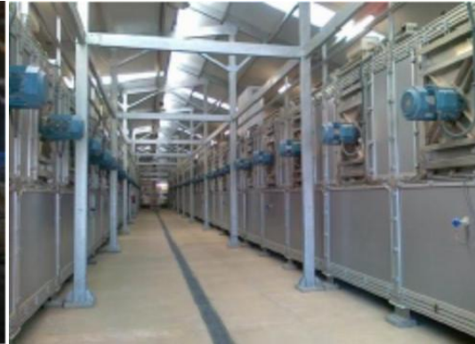
Ilustración 12: Secado térmico de lodos.