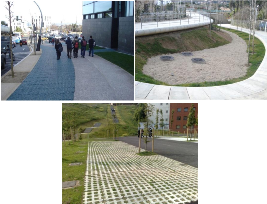
Ilustración 9: Ejemplos de drenaje urbano sostenible