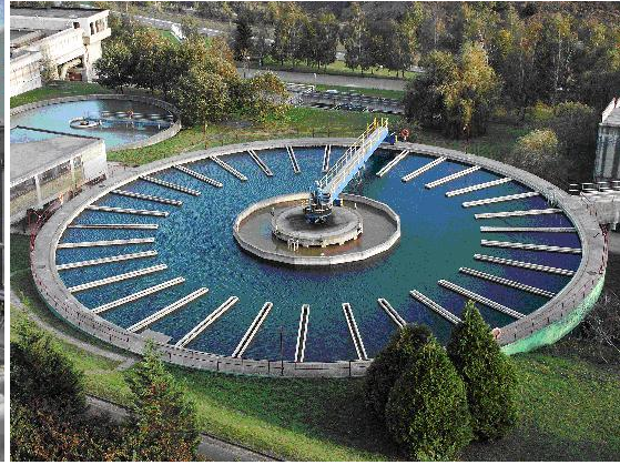
Ilustración 5: Decantador de una ETAP