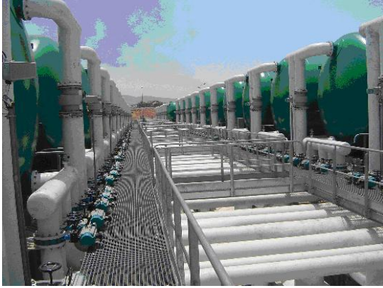
Ilustración 4: Filtros de arena