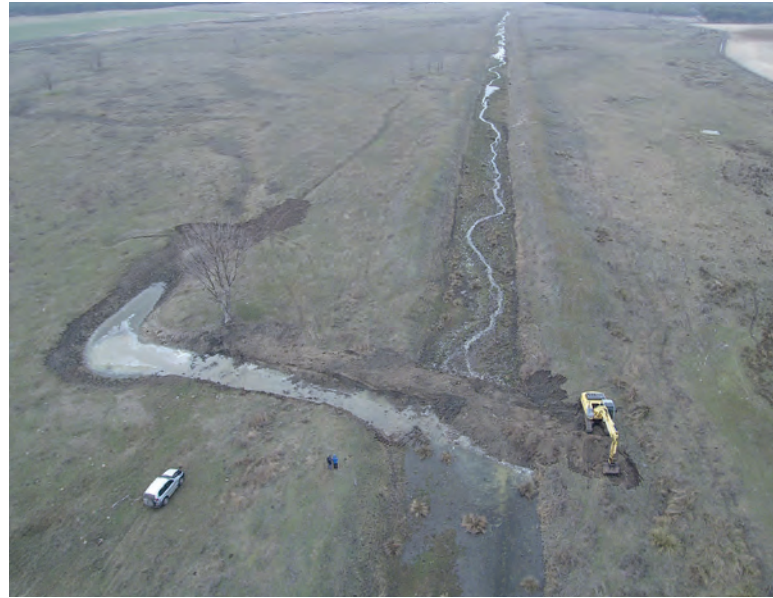
Restauración fluvial del río Zapardiel en la cuenca del Duero