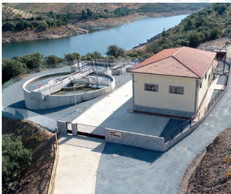
EDAR La Pesga, cuenca del Tajo (Cáceres, Extremadura)