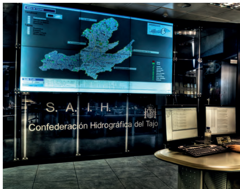
Imagen del Sistema Automático de Información Hidrológica (SAIH) de la Confederación Hidrográfica del Tajo