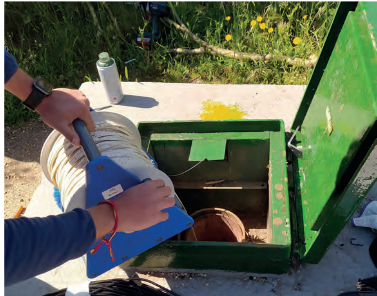
Medición manual del nivel piezométrico