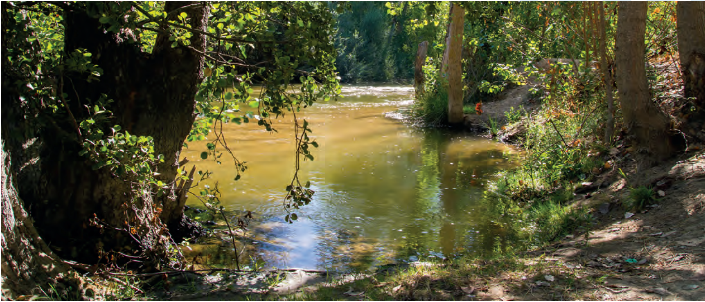
Río Alberche en la cuenca del Tajo (Toledo, Castilla-La Mancha)