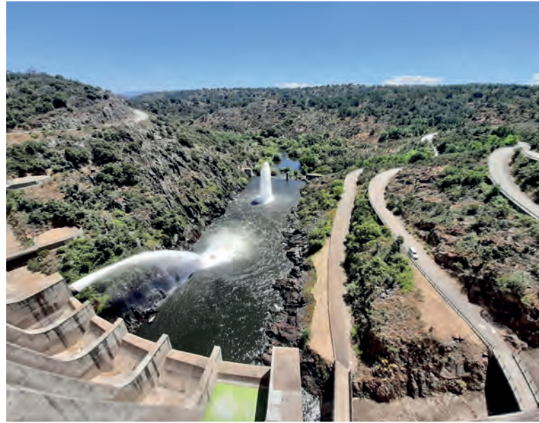
Embalse de Iruña, cuenca del Duero (Salamanca, Castilla y León)