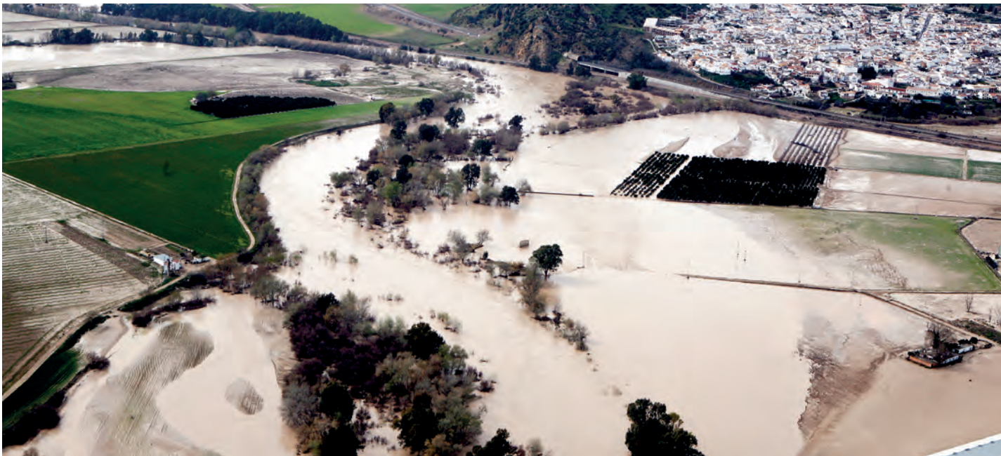
Inundaciones de 2010 en Almodóvar del Río (Córdoba, Andalucía)