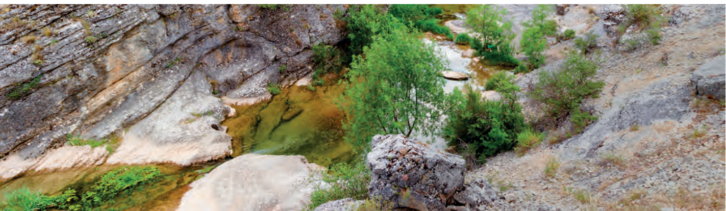
Reserva Natural Fluvial del río Dulce, cuenca del Tajo (Guadalajara, Castilla-La Mancha)