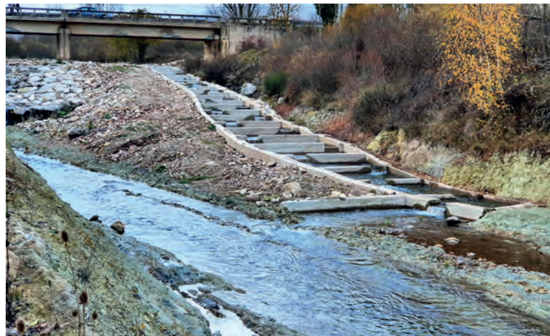
Escala de peces construida por la Confederación Hidrográfica del Ebro en el río Híjar (Cantabria)