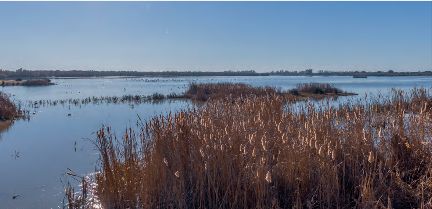
Parque Nacional de Doñana, cuenca del Guadalquivir, en la provincia de Huelva (Andalucía)