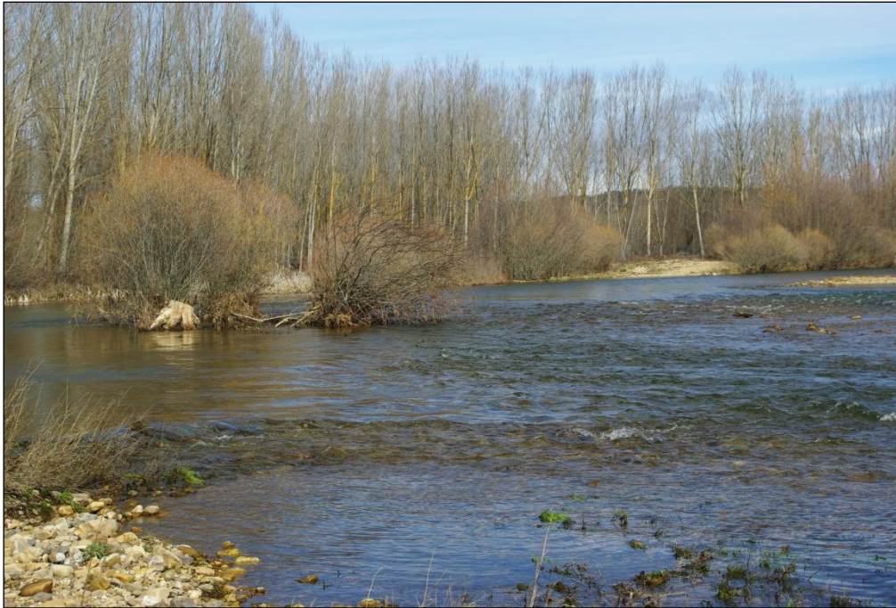
Ilustración 4: Recuperación de llanuras de inundación en el río Órbigo, como elemento esencial para prevenir inundaciones y recuperar ecosistemas fluviales.