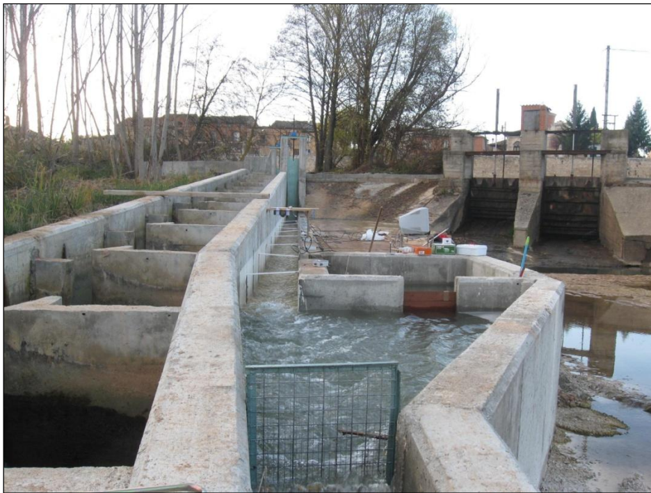
Ilustración 2: Construcción de escala para peces en un aprovechamiento hidroeléctrico en explotación.

El principio de gobernanza que imprime carácter a esta capacidad es el de la necesidad de acometer una gestión adecuada y moderna del espacio fluvial y de los riesgos naturales, con especial atención a la mitigación del impacto del cambio climático como una de las principales fuentes de riesgos naturales. Los pilares de este principio de gobernanza son la necesidad de mantener y recuperar el medio ambiente hídrico a la vez que se minimizan los daños por los riesgos naturales, tal y como exigen todas las políticas de la Unión Europea, dentro del desarrollo sostenible y la sostenibilidad en las inversiones, la transparencia y la participación pública en la toma de decisiones.