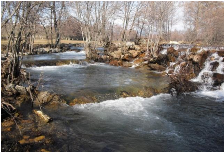
Ilustración 1: Escala para peces elaborada por la Confederación Hidrográfica del Duero en el Río Negro (Zamora).

Como caso reciente de éxito puede citarse el desarrollo de la Estrategia Nacional de Restauración de Ríos que ha publicado 12 guías técnicas, ha desarrollado 28 proyectos de infraestructuras verdes que han supuesto la recuperación ambiental 937,5 km de río, aumentando su resiliencia frente a fenómenos extremos. Además, se ha impulsado la participación de la sociedad en esta tarea mediante el Programa de Voluntariado en Ríos en el que han participado más de 150.000 voluntarios.