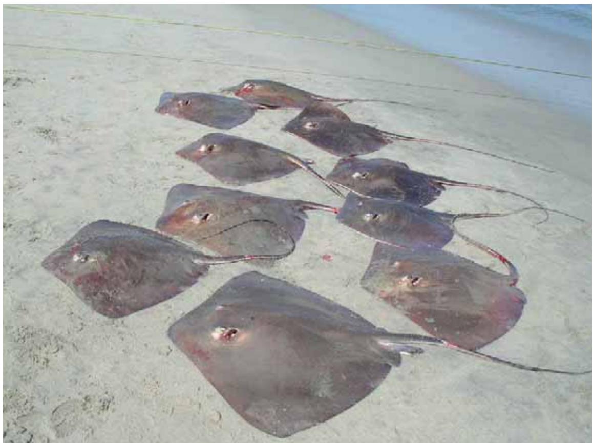
Figura 2. Un grupo de rayas capturadas en la costa oriental del Pacífico. La tendencia a agruparse es una característica que hace a muchas especies de tiburones particularmente vulnerables a la pesca.

Hábitat. Los tiburones habitan una gran variedad de hábitat, incluyendo ríos y lagos de agua dulce, estuarios costeros y lagunas, aguas costeras, mar abierto y aguas profundas. Los requerimientos de hábitat varían para las diferentes especies durante las sucesivas etapas de sus ciclos de vida. La distribución de la mayoría de las especies es relativamente restringida, principalmente a lo largo de las plataformas y pendientes continentales y alrededor de las islas, siendo algunas especies endémicas de áreas pequeñas o confinadas a rangos reducidos de profundidad. Otros se distribuyen de manera discontinua, existiendo poblaciones en áreas de amplia separación geográfica. Muchas de estas últimas presentan muy poco o ningún intercambio entre poblaciones, aún cuando los stocks migratorios parezcan solaparse. Relativamente pocas especies tienen distribuciones geográficas genuinamente amplias. Entre los mejor estudiados están los tiburones pelágicos, que realizan extensas migraciones. Con todo, al menos