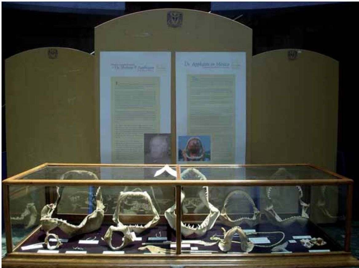
Figura 7. Mandíbulas de tiburón, atractivas para todo público.

En el caso del tiburón blanco Carcharodon carcharias , los productos más apreciados son sus dientes y mandíbulas, que se venden a los turistas o (cada vez más) por Internet (CITES CoP13 Prop.32).