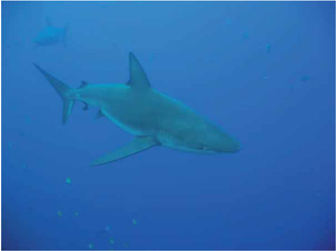
Figura 12. Jaquetón sedoso Carcharhinus falciformis , una de las especies para las que existen pruebas moleculares para identificar productos y derivados.

Si se quiere tener registros adecuados de comercio, se necesitan técnicas de identificación fáciles de usar y económicamente asequibles para las partes y derivados de tiburón que entran al comercio internacional. Aún así, otro problema a considerar es que no existen códigos de aduana (preceptivos bajo las disposiciones de la Organización Mundial de Aduanas) a escala de especie.