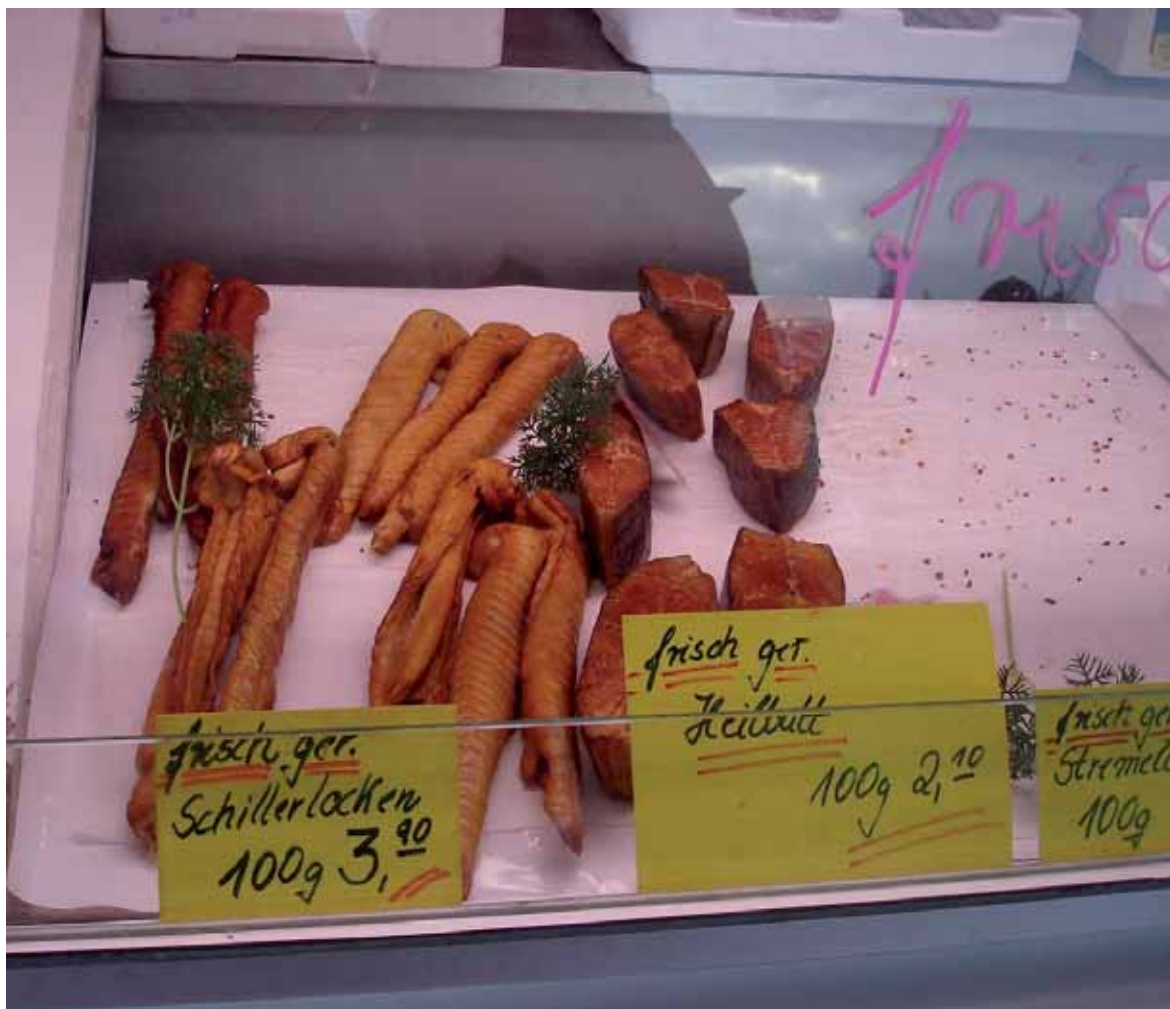
Figura 5. Schillerlocken en el Mercado de Pescado de Hamburgo, Alemania.

El valor de la carne de tiburón varía considerablemente entre las diferentes especies y mercados. Según datos de FAO, el kilo de carne de tiburón congelada tiene un precio de alrededor de 1 dólar estadounidense y el de la carne fresca se eleva a 5,50 dólares estadounidenses (Josupeit 2008). Pero hay varios casos específicos que vale la pena mencionar. Un estudio de mercado concluyó que la carne congelada de mielga Squalus acanthias vendida por el Reino Unido a Italia era la más cara, a 9.91 dólares estadounidenses el kilo (Vanuccini 1999).