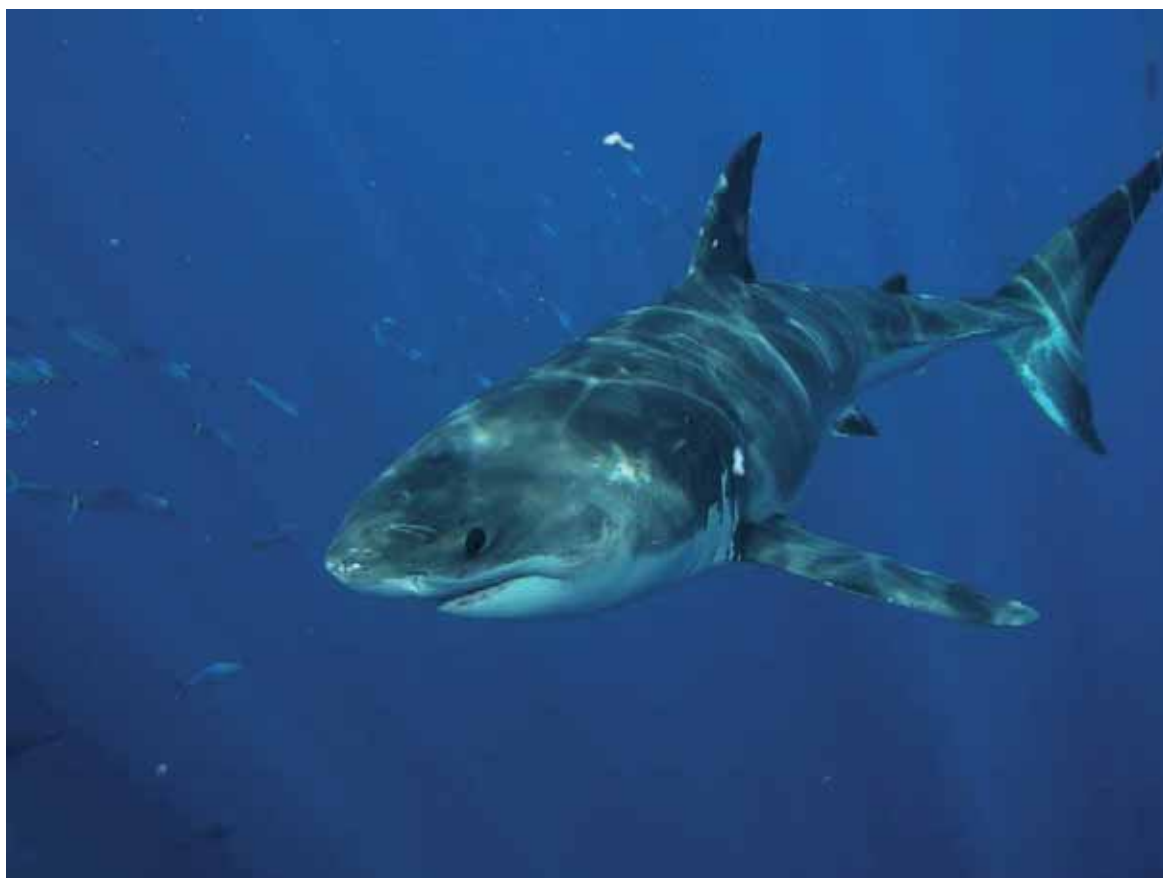
Figura 15. El tiburón blanco Carcharodon carcharias está en el Apéndice II de CITES desde 2004.

En 2000, la CdP11 revocó la Resolución Conf. 9.17, una vez adoptado el PAI-Tiburones, pero las Decisiones 11.94 y 11.151 contenían acciones sobre la aplicación de dicho Plan y la mejora de los registros internacionales de comercio en productos de tiburón. La Decisión 11.94 se refería al mantenimiento de las relaciones existentes entre la Secretaría del Comité de Pesca de la FAO y el Presidente del CF, para evaluar la aplicación del PAI-Tiburones. Los resultados debían comunicarse periódicamente en las reuniones del CF y la CdP. La Decisión 11.151 instruía a la Secretaría CITES a mantener sus relaciones con la Organización Mundial de Aduanas, para promover el establecimiento y uso de encabezados específicos en el Sistema Armonizado de Clasificaciones Aduaneras Estándar a efectos de discriminar entre carne, aletas, cuero, cartílago y otros productos de tiburón que entraran en el comercio internacional.