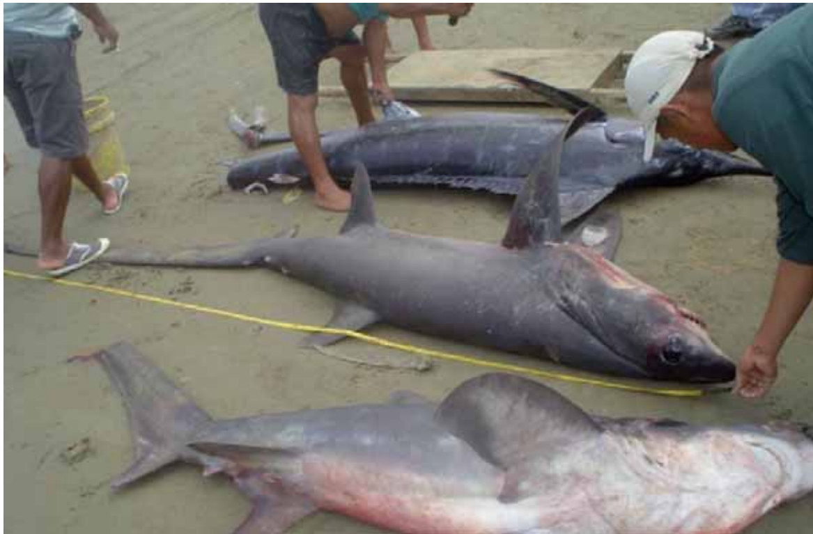
Figura 10. Captura incidental de tiburón Un pez zorro negro Alopias superciliosus capturado en la pesca de pez vela en Manta, Ecuador (Foto: Carlos Polo-Silva y Felipe Galván).

En algunas pesquerías oceánicas de palangre, las interacciones con los tiburones suponen sustanciales problemas económicos, ecológicos y sociales. Difundir la información existente sobre los conocimientos de los pescadores y nuevas estrategias para evitar a los tiburones podría beneficiar a los tiburones y a los pescadores que deseen reducir las interacciones con ellos. Mejorar el conocimiento sobre las actitudes y prácticas relacionadas con los tiburones, actuales y planeadas a futuro, de la industria palangrera, proporcionaría a las autoridades de gestión mejor información para manejar estos problemas (Gilman et al. 2007).