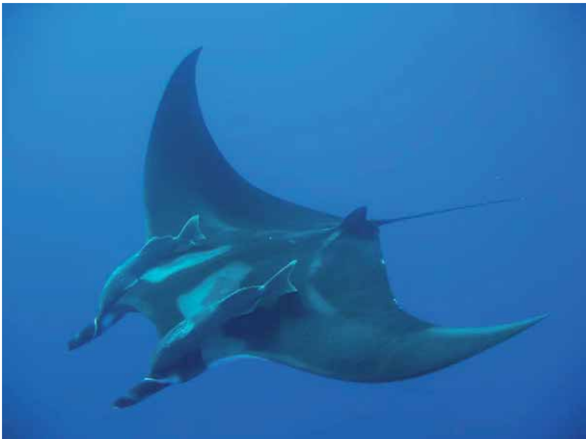
Figura 1. Manta Manta birostris , un típico elasmobranquio planctívoro.

Hábitos alimenticios. Los tiburones suelen ser depredadores; sin embargo, algunos son carroñeros oportunistas, y algunos de los más grandes, como el tiburón ballena Rhincodon typus , el tiburón peregrino Cetorhinus maximus y el tiburón bocudo Megachasma pelagios , al igual que las mantarayas, son filtradores de plancton y peces pequeños. Los tiburones depredadores se encuentran al final o cerca del final de las cadenas alimenticias marinas. Como grupo, los tiburones tienen una larga historia evolutiva como depredadores muy exitosos. Por ello, su número está limitado naturalmente por la capacidad de carga del ecosistema, y son relativamente escasos comparados con la mayoría de los teleósteos (Camhi et al. 1998).