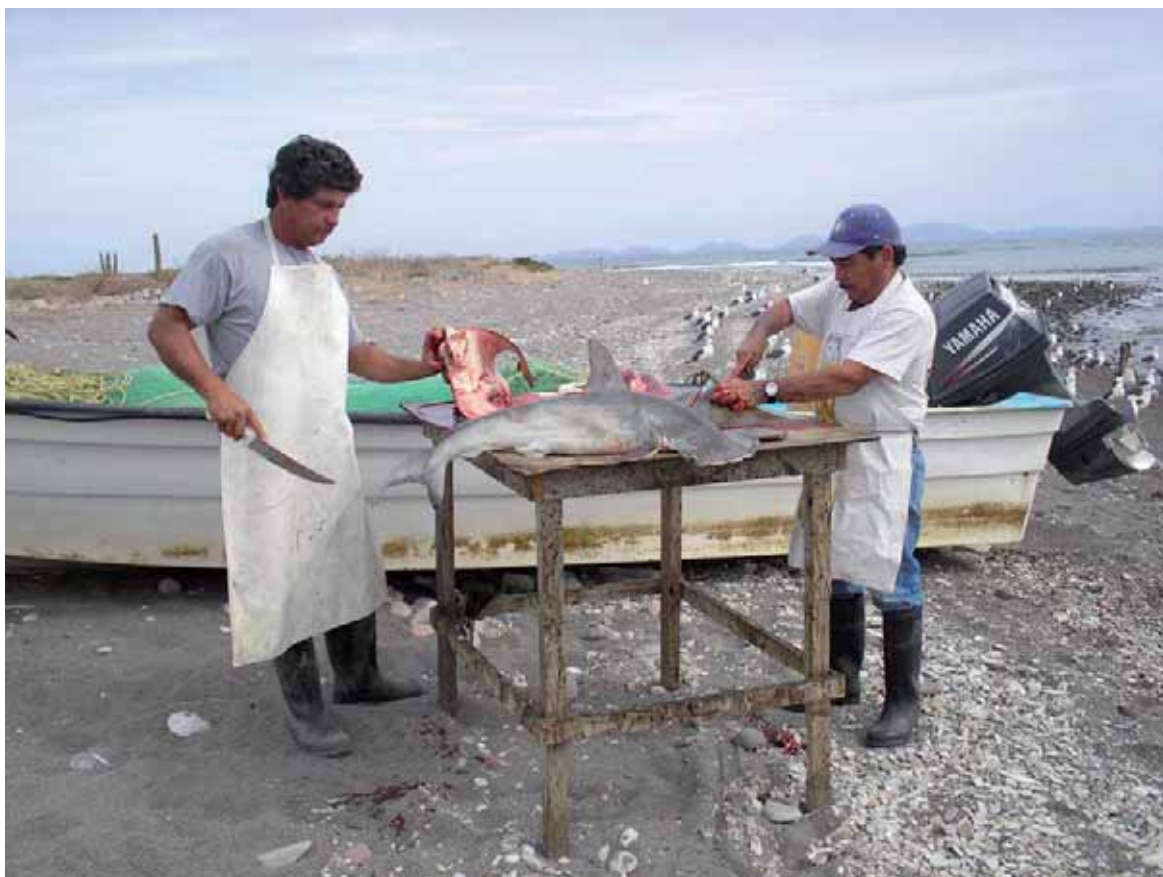
Figura 18. Es imprescindible utilizar tanto la carne como las aletas del tiburón para utilizar el recurso de manera sostenible.

adecuadamente. Esto también podría aplicarse a otras especies marinas explotadas comercialmente. En principio, esto reduciría el volumen adicional de trabajo que para las Autoridades Científicas implica la inclusión de estas especies en los Apéndices de CITES. Si las Autoridades de Pesca utilizan regímenes sostenibles de gestión, ya se han cumplido los requerimientos de un NDF. Sin embargo, debe resaltarse que en casi todo el mundo hay gestión pesquera deficiente, seguimiento inadecuado o inexistente y pesca INDNR. Esto causa que los datos sobre mortalidad por pesca (capturas, desembarcos y descartes), índices de abundancia, consumo nacional y comercio internacional (tanto de importaciones como de exportaciones) sean deficientes.