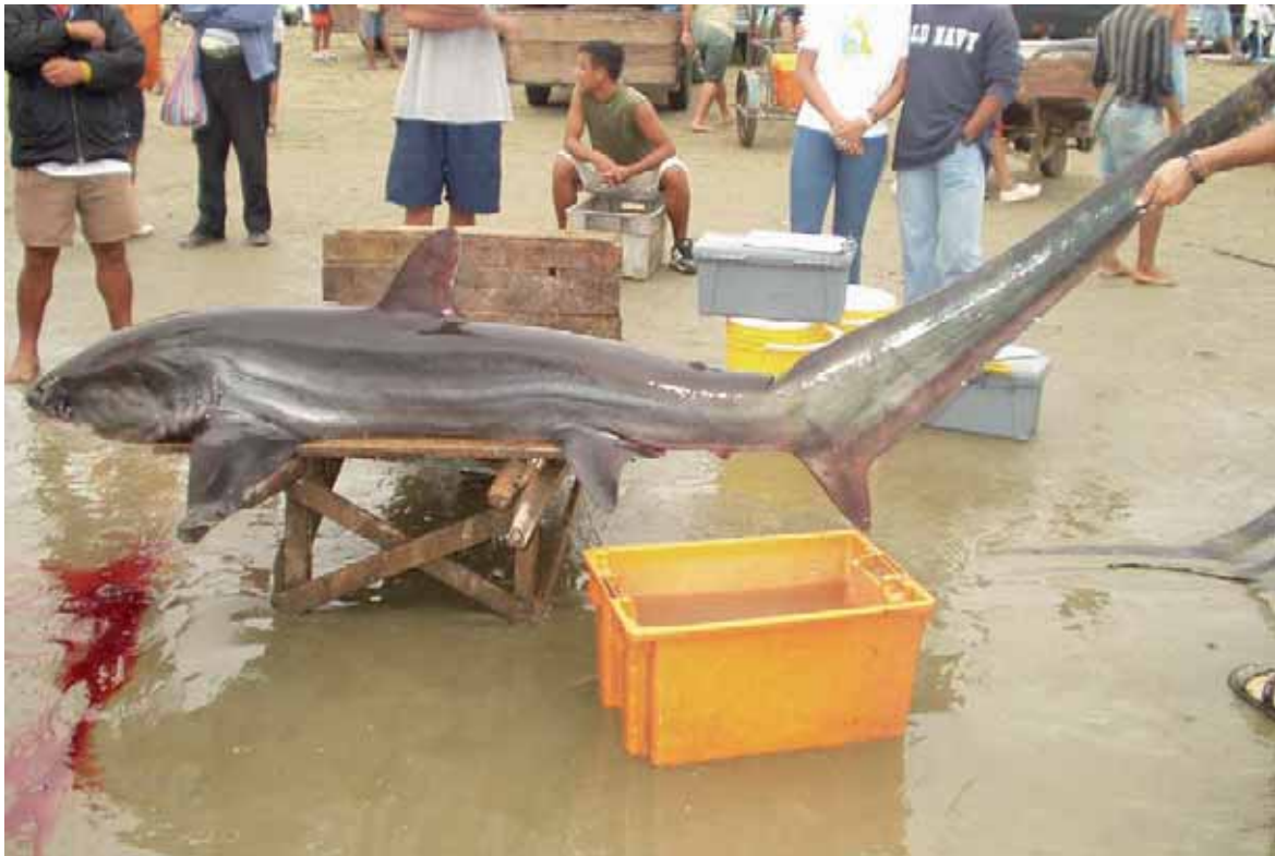
Figura 3. Pez zorro pelágico Alopias pelagicus , una de las especies recientemente agregadas a la Lista Roja de UICN.

tiburones pelágicos, permanece en la categoría de Casi Amenazada. Los científicos resaltaron disminuciones de 50-70% en el Atlántico Norte e hicieron patente su preocupación sobre la falta de medidas de conservación, pero no lograron consenso sobre si la especie se encuentra en peligro de extinción a escala global (SSG 2007, Dulvy et al. en prensa).