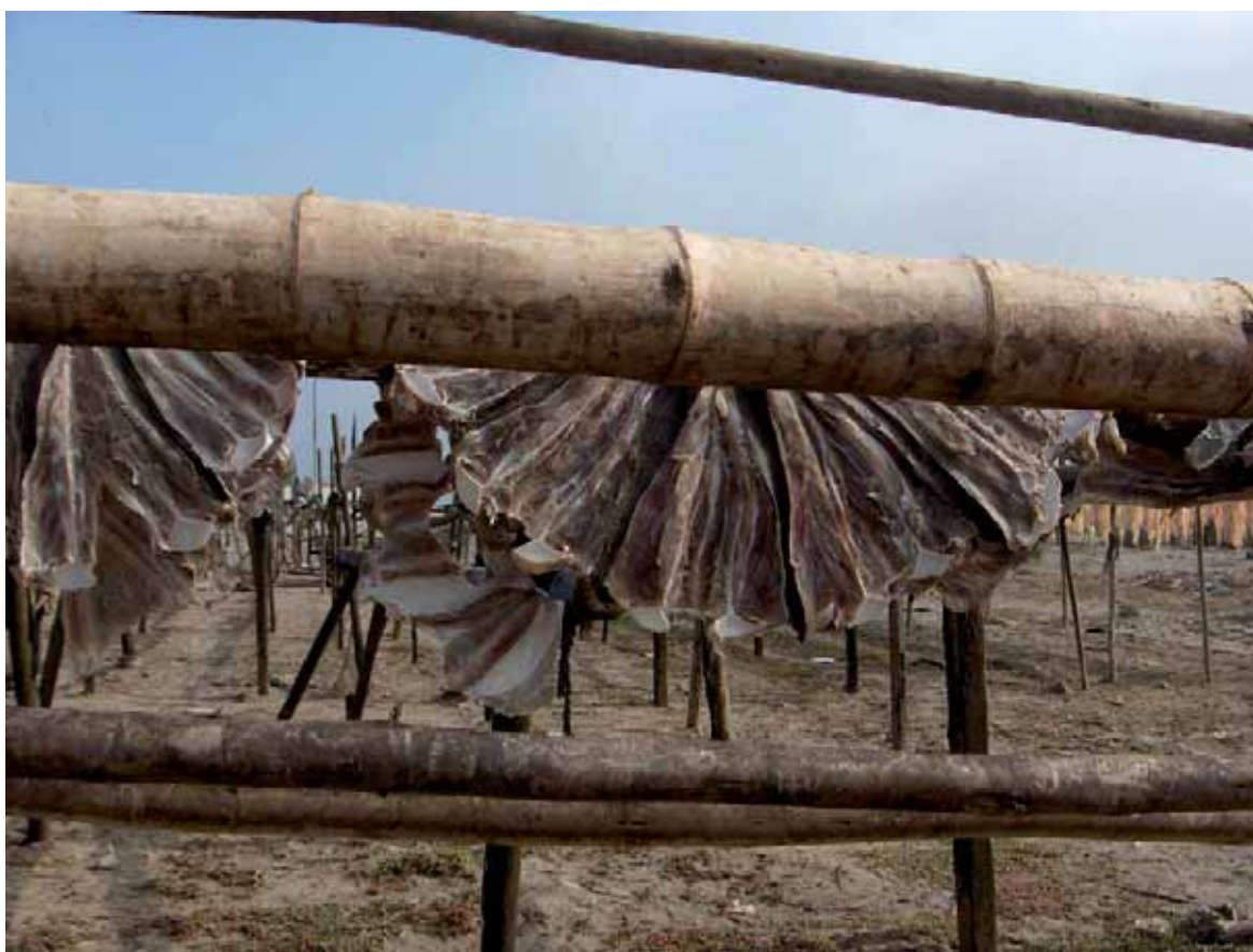
Figura 13. Las canales secas o saladas son uno de los productos de tiburón más comunes. Canales de tiburón secándose en Piura, Perú.

Finalmente, las importaciones de carne de tiburón registradas han aumentado de aproximadamente 34.500 toneladas en 1985 a 70.900 toneladas, con un valor de unos 145 millones de dólares estadounidenses en 2000. Italia y Francia dominaron las importaciones de carne de tiburón (7.000 a 15.000 toneladas anuales) de 1985 a 1998. En este año España sobrepasó a Francia y en 2000 a Italia para convertirse en el mayor importador del mundo (13.913 toneladas en 2000). El otro importador principal (>2.000 toneladas un año tras otro) en 1998-2000 fue el Reino Unido. Estas estadísticas indican que la Unión Europea es la principal región importadora, aunque esto podría deberse a que el comercio se registra mejor que en otras naciones (Vannuccini 1999).