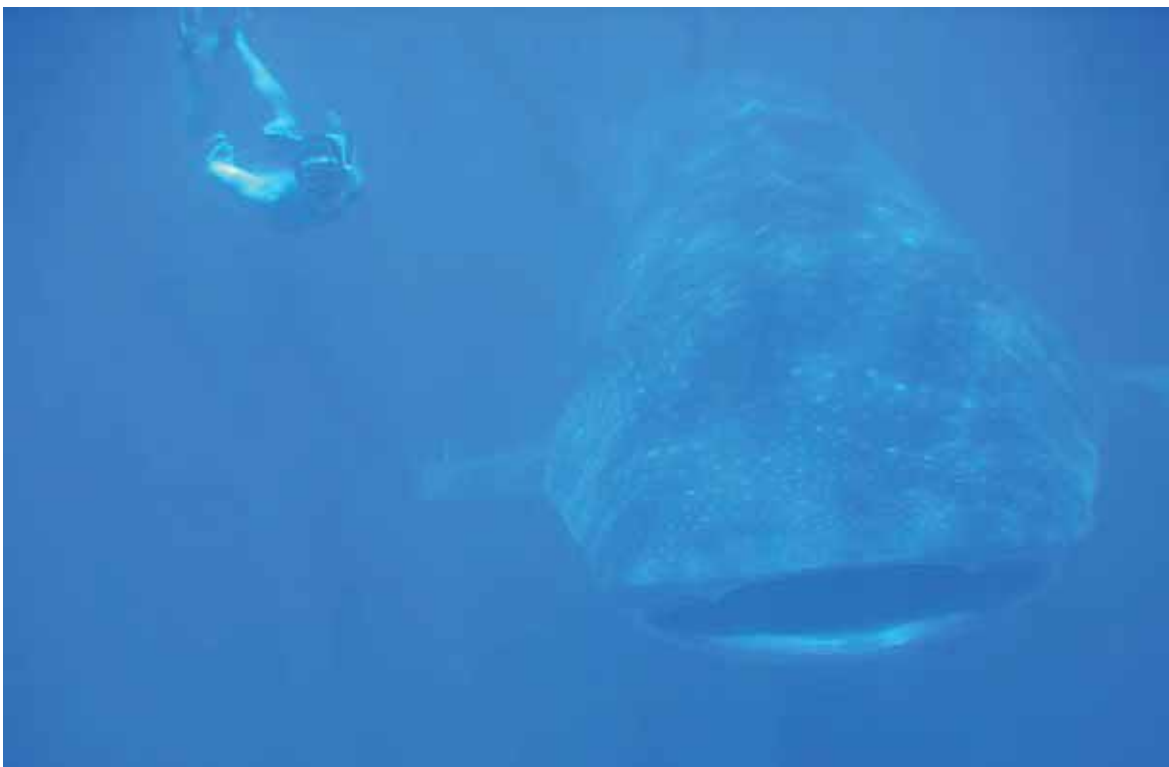
Figura 8. Nadar con tiburones ballena Rhincodon typus es una actividad turística cada vez más común.

Acuarios. Los tiburones vivos se utilizan como peces ornamentales o en acuarios públicos (García-Núñez 2004). Los peces sierra son muy apreciados como animales de exhibición en acuarios públicos, ya que sobreviven en cautiverio por periodos prolongados (McDavitt 2006); especies más difíciles como los tiburones tigre Galeocerdo cuvieri se han mantenido en cautiverio con éxito por casi ocho años (Marín-Osorno, com. pers. 2006), y algunas especies grandes (en particular el jaquetón Carcharhinus plumbeus ) se reproducen en cautiverio habitualmente. Se ha tenido en acuarios públicos hasta tiburones ballena, aunque su manutención es mucho más complicada que la de otras especies. Las rayas de agua dulce se han capturado por décadas con fines ornamentales, aunque también se usan en algunos casos como alimento (CITES AC20 Inf. 8).