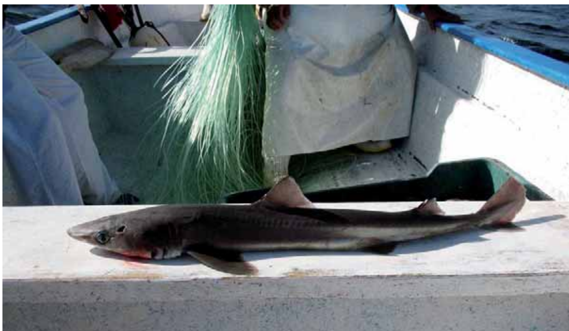
Figura 16. La mielga Squalus acanthias , especie propuesta en 2007 para su inclusión en el Apéndice II de CITES (Foto: Mauricio Hoyos).

También en la CdP14 la Unión Europea presentó dos propuestas para incluir al marrajo sardinero Lamna nasus (CITES CoP14 Prop.15) y a la mielga Squalus acanthias (CITES CoP14 Prop.16) en el Apéndice II. Sin embargo, las propuestas no obtuvieron los dos tercios del voto necesarios para ser aprobadas. También presentó una propuesta para adoptar medidas de comercio respecto a ambas especies, pero ésta también fue rechazada por la CdP. La mayoría de los oponentes a estas propuestas criticaban las pocas pruebas de esfuerzos de conservación dentro de la UE, a pesar de haber gestionado por años mediante cupos la pesquería de mielga y de la reciente prohibición de pesca dirigida a esta especie. Esto resalta la necesidad de adoptar medidas de conservación previas si se quiere construir una propuesta de inclusión exitosa. En esa