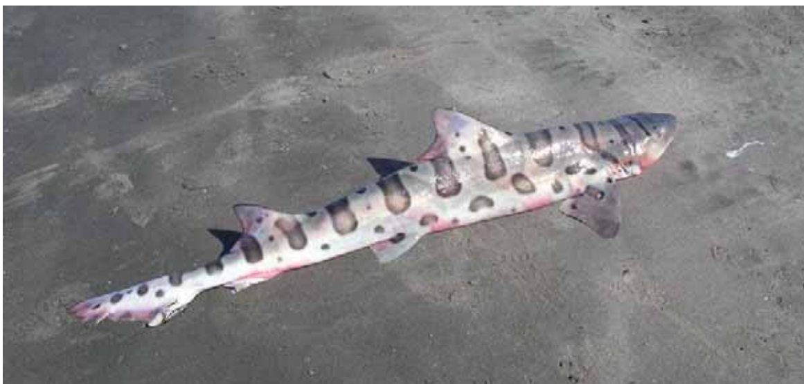
Figura 17. Tiburón leopardo Triakis semifasciata , identificado por el Comité de Fauna de la CITES como especie objeto de preocupación.