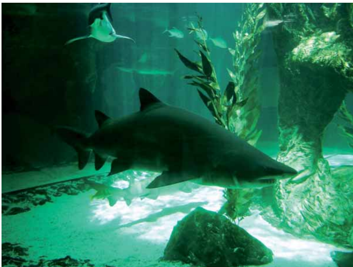
Figura 14. El solrayo Carcharias taurus , suele adaptarse con relativa facilidad a los acuarios. Aquí, en el Zoo Aquarium de Madrid, España.

Acuarios. Desde siempre, los peces sierra han tenido altos precios en el comercio de peces de acuario. Actualmente hay un proveedor australiano que vende regularmente peces sierra a acuarios públicos de todo el mundo. A precios de 2005, vendía Pristis zijsron y P. microdon a 1.650 dólares estadounidenses por individuo, y P. clavata por 1.750 dólares estadounidenses (McDavitt 2006). Los proveedores principales de juveniles de pez sierra de agua dulce P. microdon en el mercado internacional siguen siendo los exportadores de Jambi, una provincia de Sumatra, Indonesia. Aunque ésta es una pesquería dirigida, el volumen de comercio parece ser bajo, dado que estos animales son escasos de por sí, estimándose en alrededor de 20 animales al año. La demanda proviene de acuaristas de Alemania, PdC Taiwán y Japón, así como de acuarios públicos de todo el mundo (McDavitt 2006). En cuanto a rayas de agua dulce de la familia Potamotrygonidae, actualmente se registran oficialmente las exportaciones de Brasil, pero éstas son solo una fracción de las rayas de agua dulce que se venden internacionalmente como peces ornamentales (CITES AC20 Inf. 8).