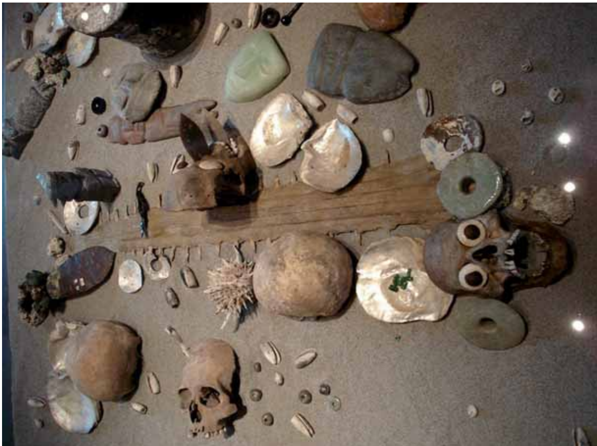
Figura 6. Rostrum de pez sierra en una ofrenda azteca (ca. S. XVI). Museo Nacional de Antropología, Ciudad de México.

Aceite. En EEUU y Europa se utilizan aceites de hígado y cuerpo de tiburón, como los de la mielga Squalus acanthias y los de varias especies de tiburones de profundidad, para el curtido y curado de pieles. El aceite de hígado de tiburón se utiliza: en Japón en las toallas sanitarias para limpiar inodoros, en Francia para perfumería, y en EEUU algunas veces como ingrediente en preparados para aliviar las hemorroides, distribuidos internacionalmente. En las flotas pesqueras artesanales de África y del Océano Índico se usa aceite de hígado de tiburón para el mantenimiento de las embarcaciones tradicionales de pesca. De este aceite se obtiene el escualeno, un hidrocarburo acíclico utilizado para producir lubricantes de instrumentos de precisión, bactericidas y productos farmacéuticos y cosméticos tales como cremas hidratantes (Rose 1996).