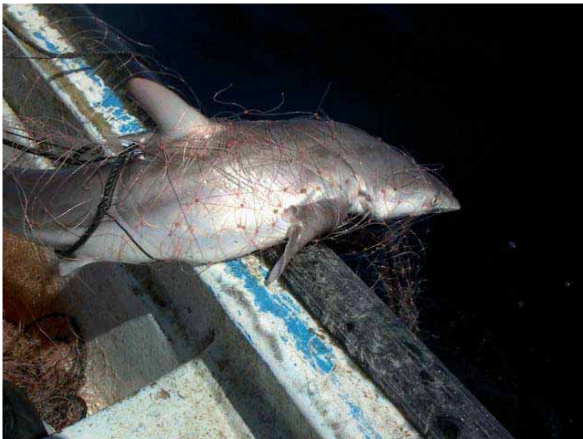
Figura 11. Un arte de pesca que captura tiburón son las redes de enmalle.

incidental en la pesquería semipelágica con palangre de merluza pedra-e-bola en el Algarve portugués, y la mayoría de estas especies son descartadas (Coelho et al. 2003).