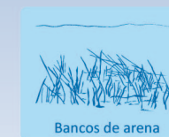
Bancos de arena

TIPOS DE HÁBITATS NATURALES Y/O ESPECIES DE INTERÉS COMUNITARIO