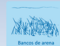
Bancos de arena

TIPOS DE HÁBITATS NATURALES V/O ESPECIES DE INTERÉS COMUNITARIO