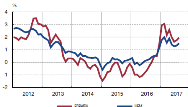
Figura 2: Índice de Precios al Consumo, España/Eurozona.