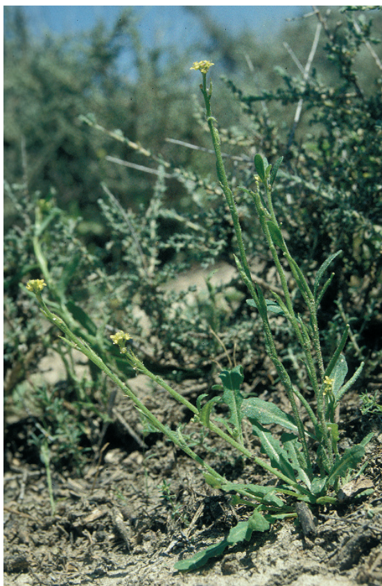
Rabanillo cornudo, jaramago de Cavanilles

Sisymbrium cavanillesianum Castrov. & Valdés Berm.