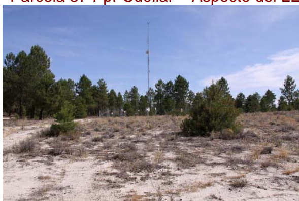
Parcela 37 Ppr Cuéllar – Aspecto del LESS en 2009