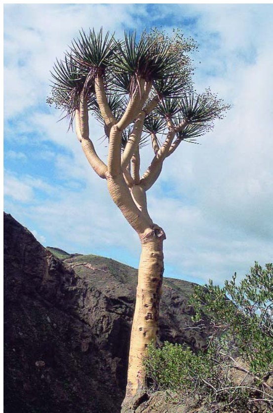
Drago de Gran Canaria, drago