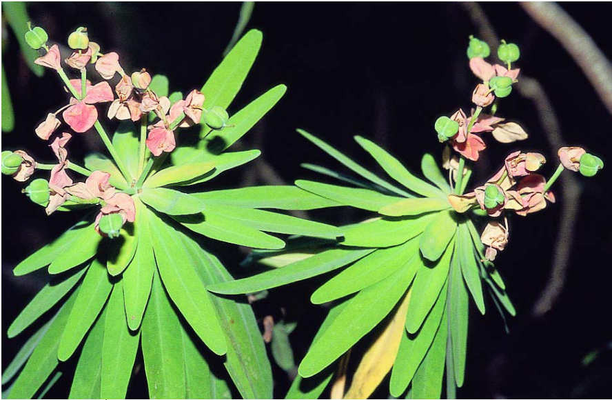
Tabaiba de monte

Taxón establecido en dos sectores aislados de la isla de Tenerife, cuya expansión se encuentra limitada por problemas de competencia con especies más agresivas.