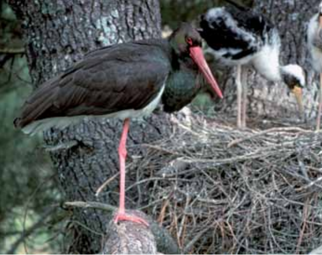
CENEAM-OAPN-MARM / FERNANDO CÁMARA ORGAZ