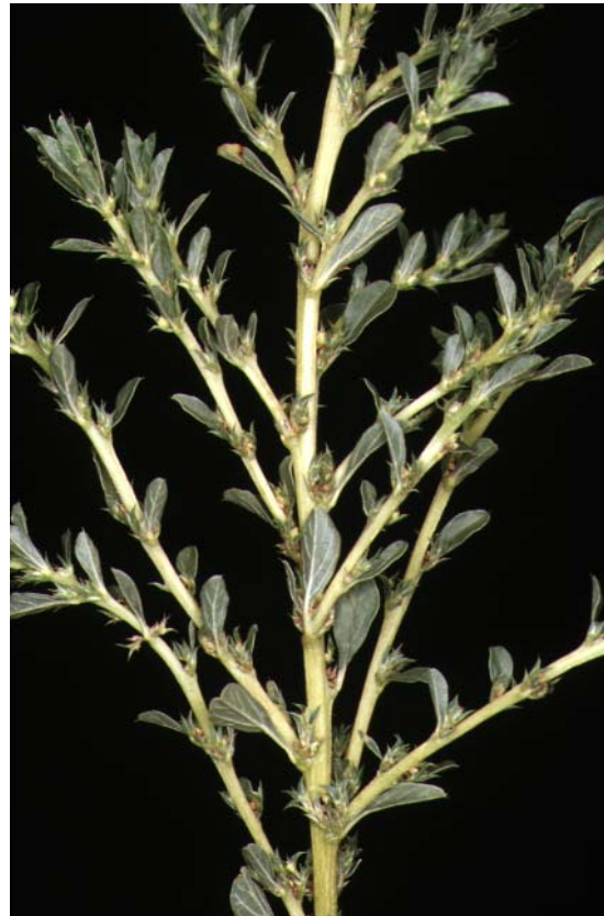
M. Sanz Elorza

Bledo blanco, taramago, capollos, picapollos, tamargo, moco de pavo (cast.); amarant blanc, blet blanc, blet (cat.); bredro branco (gal.).