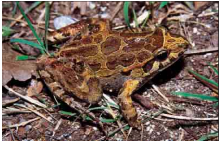
Ejemplar de La Jonquera, Girona

Al tratarse de una especie de introducción reciente y actualmente en expansión es difícil realizar consideraciones sobre sus límites biogeográficos y sus limitaciones ecológicas. Ocupa biotopos claramente mediterráneos localizándose tanto en marismas como en encinares, alcornocales, bosques de ribera, choperas y prados. La cantidad de cobertura arbórea no limita su presencia, aunque prefiere el sustrato herbáceo con arbolado disperso. Siempre se encuentra en las proximidades del agua frecuentemente en charcos, zonas inundadas de diversa índole, charcas y márgenes de cursos de agua de diferente caudal. Resiste muy bien el agua salobre pudiéndose encontrar en la misma costa. Las larvas se desarrollan en