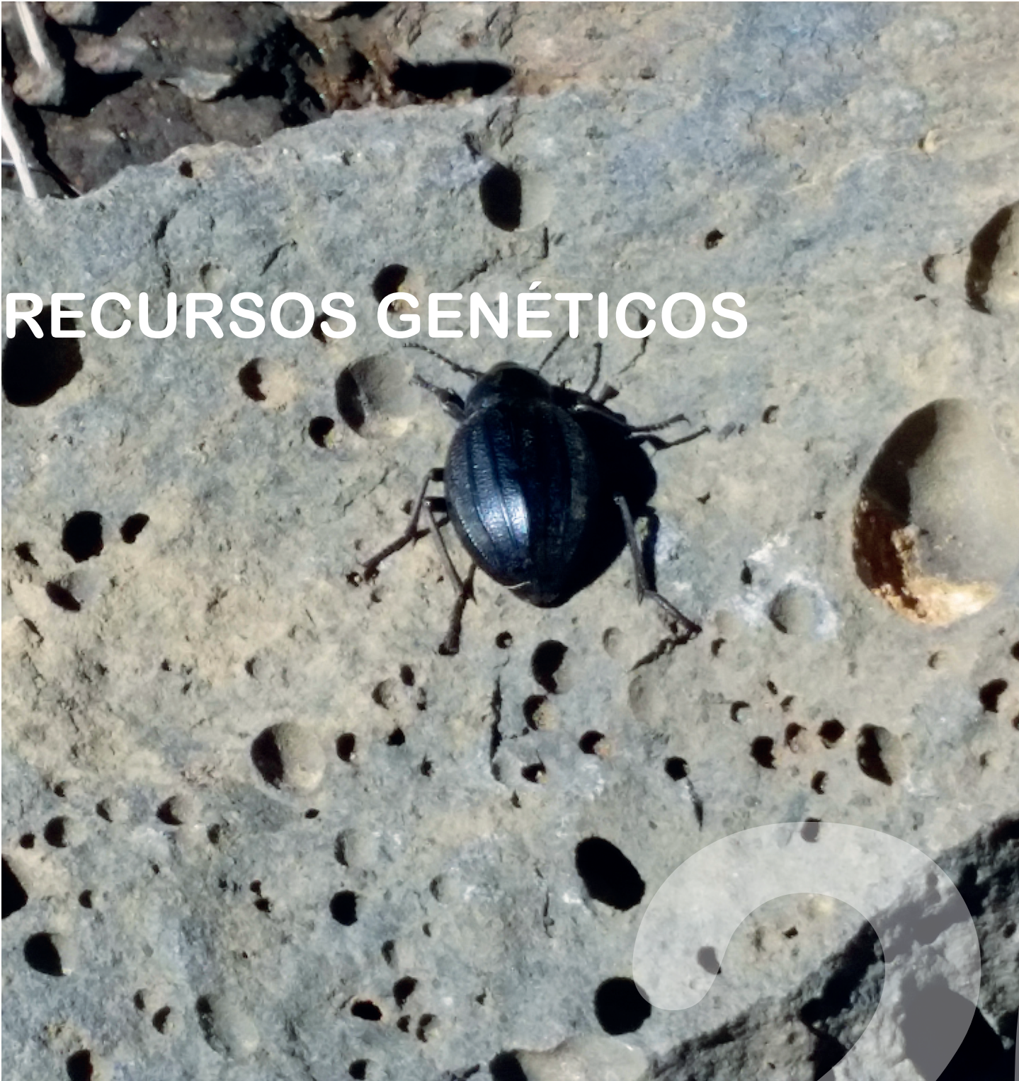
Escarabajo canario ( Pimelia sp. ). Parque Nacional del Teide