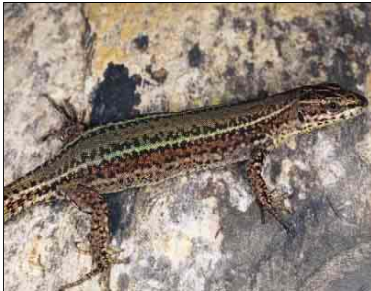
Hembra de Asturias.

El mapa adjunto refleja adecuadamente la distribución española de la especie, con la mencionada imprecisión de su