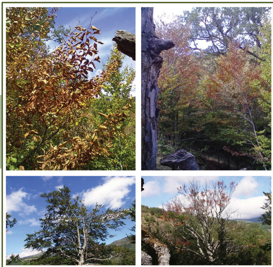
▲ Figura 1. Ejemplo de fenómeno de decaimiento en árboles sometidos a un intenso periodo de sequía en donde los daños varían, desde el secado de ramas, a un grado de afección de todo el árbol (superior). La sintomatología en el fenómeno de decaimiento se caracteriza por un progresivo aclaramiento de las copas (inferior), o secado de algunas ramas, que finalmente puede devenir en la muerte del árbol como consecuencia de la sucesión de varios años excepcionalmente secos (Hayedo de Montejo de la Sierra, Madrid).