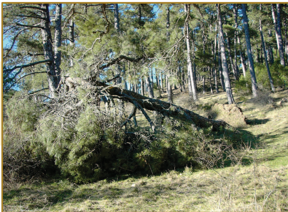
▲ Figura 2. Pino salgareño ( Pinus nigra subsp. salzmannii ) desarraigado como consecuencia de una fuerte nevada en la sierra de Cazorla (ejemplo de perturbación puntual).