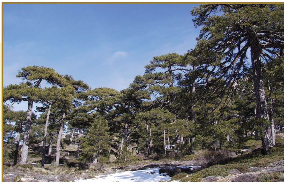
Figura 4. Vista de un rodal de Pinus nigra subsp. salzmannii de la Sierra del Pozo (Jaén), apenas alterado por la explotación forestal.