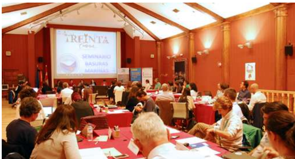
Desarrollo del taller de basuras marinas