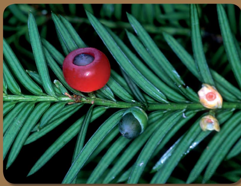
Emilio Laguna Lumbrias