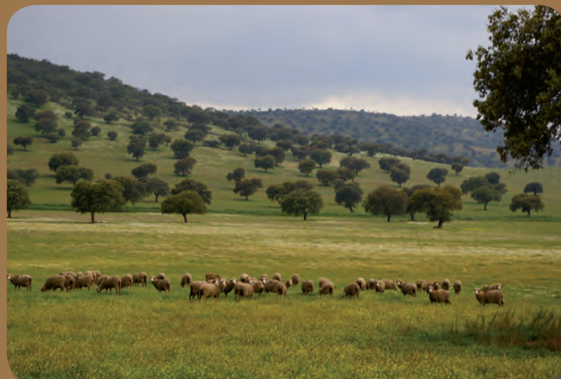
Emilio Laguna Lumbrias