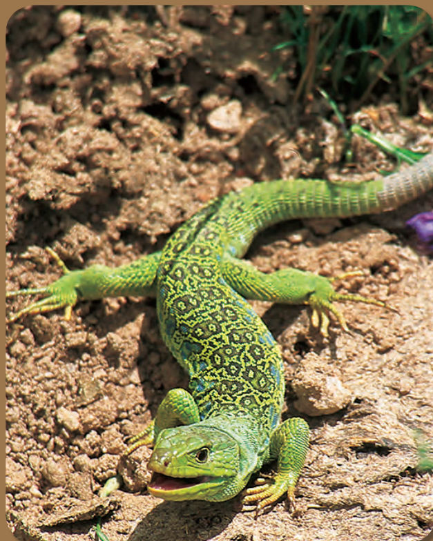
Lagarto ocelado. M.Á. García Matellanes