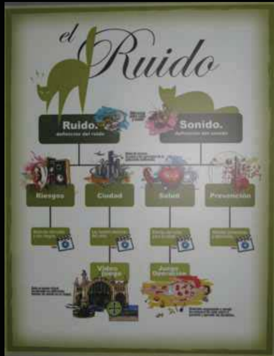
Audiovisuales y dos videojuegos