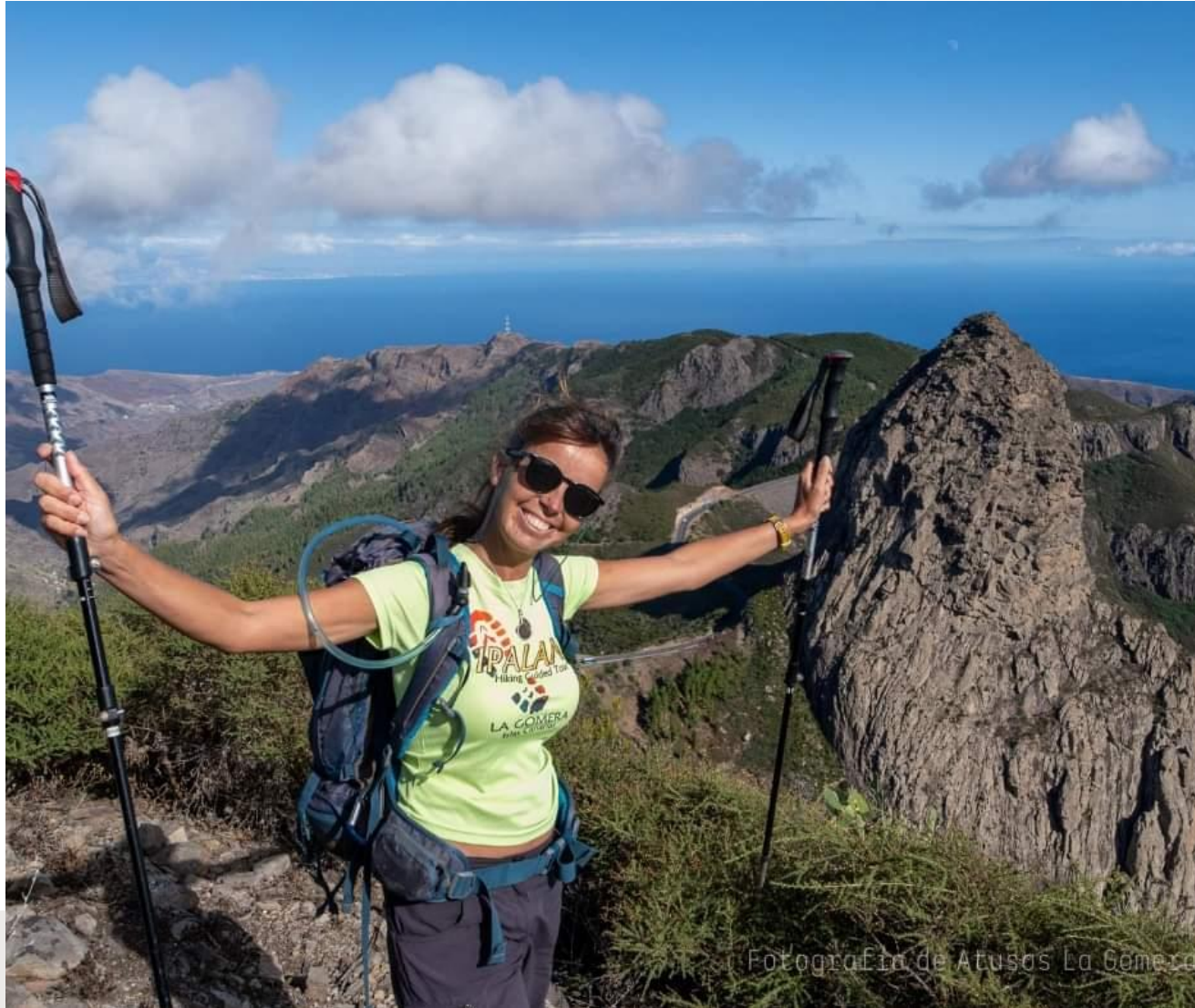
Fotografía de Atusos La Gomera