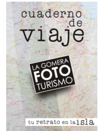
CUADERNO DE VIAJE