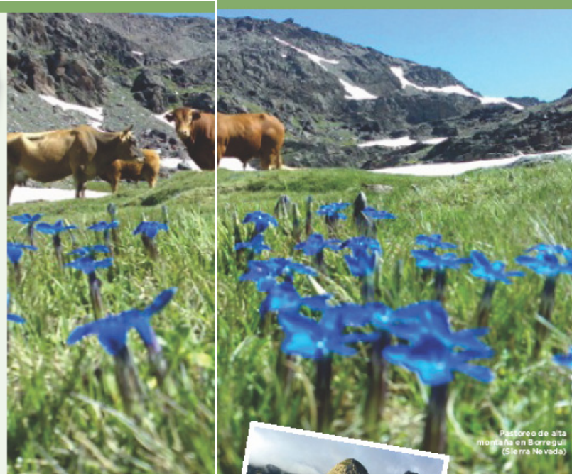
Pastoreo de alta montaña en Berreguile (Sierra Nevada)

de su territorio y de las posibilidades que  ste ofrece. Las corcegas, cigue as y rapaces de Do ana al atardecer, las lagunas glaciares de los alrededores de la majestuosidad panor mica del Veleta en Sierra Nevada, la niebla luminosa que se entromete entre el bosque m s antiguo de Europa en La Gomera-Carajonay adquieren otra connotaci n cuando son admirados por el visitante desde el tamiz del ecoturismo, que adem s de profundizar en el conocimiento del medio, permite esa simbiosis de turista y entorno que tan bien les sienta a ambos. El ecoturismo es ya un movimiento consolidado que se extiende como una tendencia imparable a la hora de que los humanos interact en con el medio natural con el menor de los impactos posibles. Como un claro exponente de que la voluntad ha dejado paso a los hechos, los parques ya disponen de un programa de experiencias