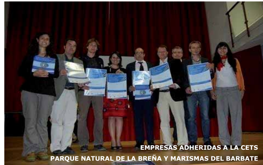
EMPRESAS ADHERIDAS A LA CETS PARQUE NATURAL DE LA BREÑA Y MARISMAS DEL BARBATE