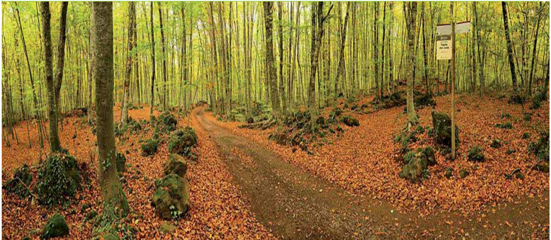
PARC NATURAL DE LA ZONA VOLCÀNICA DE LA GARROTXA

Aquellos que están diferenciados y reconocidos por su compromiso con el turismo sostenible y además cuentan con sistemas solventes para vincular empresas de turismo al producto.