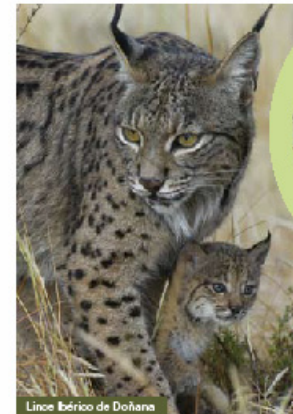
Lince ibérico de Doñana