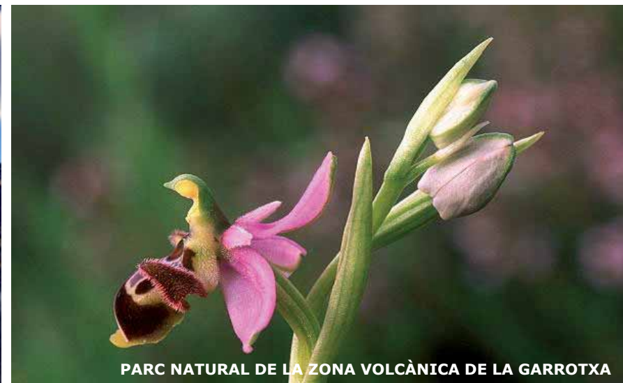
PARC NATURAL DE LA ZONA VOLCÀNICA DE LA GARROTXA