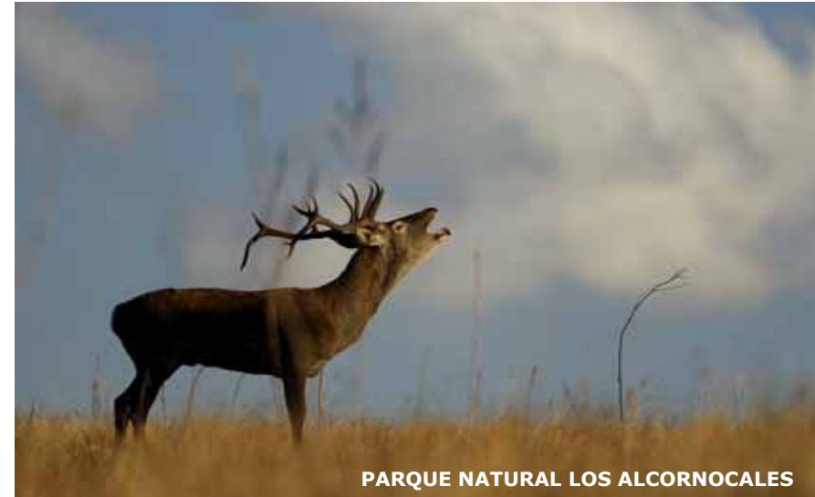
PARQUE NATURAL LOS ALCORNOCALES

Una experiencia singular para conocer y disfrutar lo mejor de la naturaleza española con las empresas de turismo mejor preparadas y sensibles para satisfacer a consumidores que aprecian la naturaleza y quieren reconectar con ella.