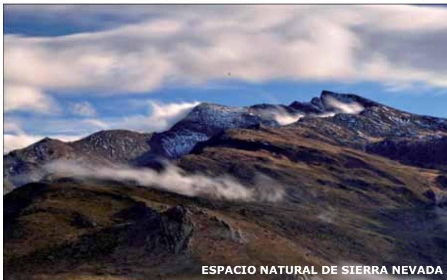
ESPACIO NATURAL DE SIERRA NEVADA