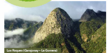
Los Roques (Garajonay - La Gomera)

Un viajero que, con la garantía de una estructura humana profesionalizada al efecto, alojándose en establecimientos especializados en guardar el mayor de los respetos con el entorno junto a otros servicios, unificados en el espacio web www.soyecoturista.com , acabará por mimetizarse con ese entorno que visita, por convertirse en un elemento más de su diversidad.