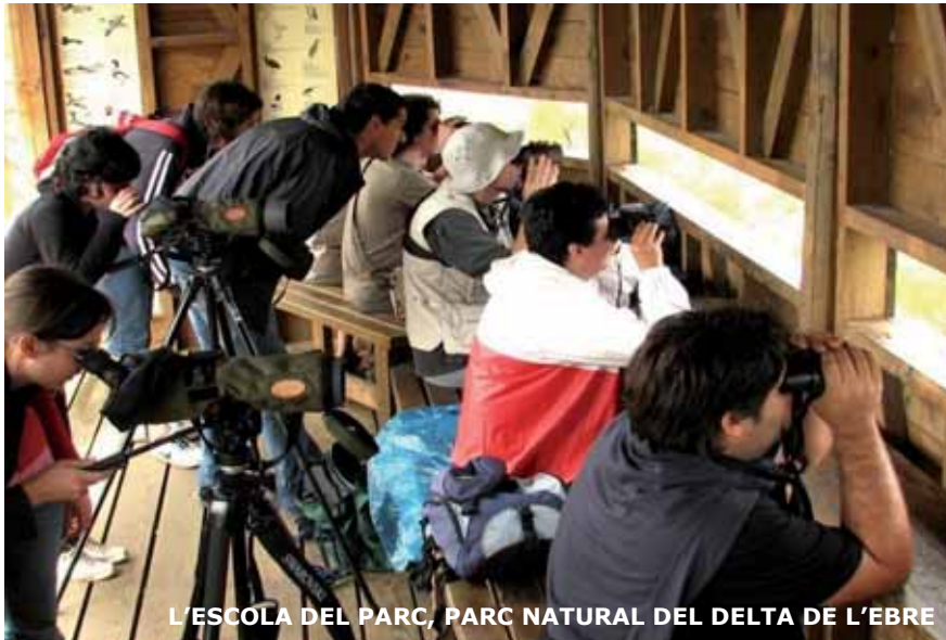
L'ESCOLA DEL PARC, PARC NATURAL DEL DELTA DE L'EBRE