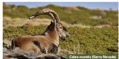
Cabra montés (Sierra Nevada)