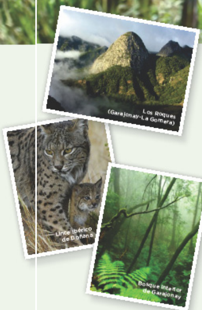
Los Rocos (Garajonay-La Gomera)