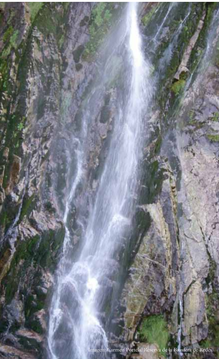
Imagen: Carmen Portela. Reserva de la Biosfera de Redes.

Otras redes temáticas del MaB tales como la Red de Reservas de la Biosfera Islas y Zonas Costeras, o REDBIOS en el ámbito de la Macaronesia podrían ayudar a diseminar las buenas prácticas y crear lazos de cooperación efectiva, como es el caso de las nuevas demandas de la RB de Príncipe.