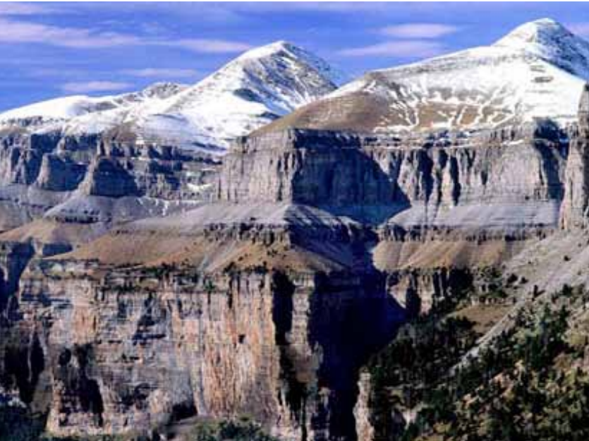
Parque Nacional de Ordesa y Monte Perdido.

para con las instalaciones individuales, donde cada casa esta alimentada por un sistema de generación independiente. Además, permite utilizar un único equipo de transformación de potencia y de regulación para atender al conjunto de casas, por lo cual las tareas de mantenimiento resultan más sencillas. Un solo grupo electrógeno auxiliar alimentado con gas propano asegura el suministro en caso de avería del sistema fotovoltaico o cuando se manifiesten condiciones meteorológicas excepcionalmente desfavorables.