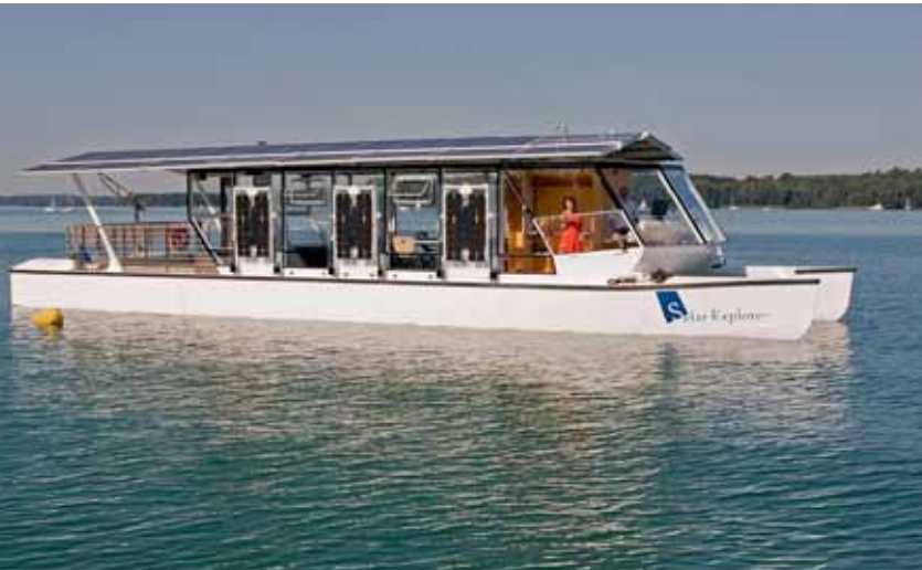
Solar Explorer, embarcación solar para la enseñanza y promoción de las energías renovables..

ha convertido en vector fundamental del desarrollo sostenible a escala global, así como en el factor principal para alcanzar un acuerdo mundial sobre el cambio climático, tal como ha sido puesto de manifiesto en la Conferencia de Naciones Unidas sobre Desarrollo Sostenible (Río+20) y en la Conferencia sobre el Cambio Climático de Doha de 2012. El documento final adoptado por los gobiernos en Río+20, denominado “el futuro que queremos”, se reconoce que “mejorar la eficiencia energética, aumentar la proporción de energía renovable y usar tecnologías menos contaminantes y de alto rendimiento energético son elementos básicos para el desarrollo sostenible, incluso para hacer frente al cambio climático”.