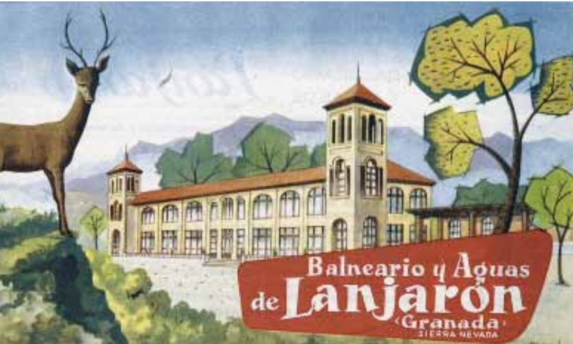
Imagen: Balneario de Lanjarón, 1960.