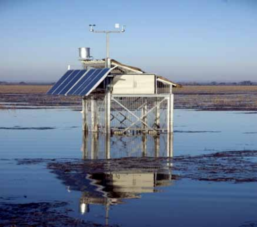
Renovables al servicio de la investigación.

Doñana conserva, aún hoy, actividades reconocidas como “aprovechamientos tradicionales” en la normativa ambiental de aplicación en la Reserva de la Biosfera, cuyos orígenes se remontan a sus primeros pobladores y que han persistido durante siglos, permitiendo el mantenimiento a lo largo del tiempo de poblaciones locales dependientes de la explotación sustentable de los recursos naturales. La energía necesaria para las necesidades cotidianas se obtenía de la leña derivada de los trabajos silvícolas, la cual en ocasiones era transformada mediante procedimientos artesanales en carbón. La apicultura, por su parte, ofrecía, además de un saludable y nutritivo alimento, la miel, cera que era utilizada para la iluminación de los interiores de las viviendas. El aprovechamiento de la piña, una vez extraído el piñón, también podía servir como combustible para la obtención de energía. En cuanto a la ganadería, recurso crucial para asegurar el sustento y la supervivencia, además de medio de transporte y comunicación y fuerza de trabajo, ofrecía residualmente los nutrientes