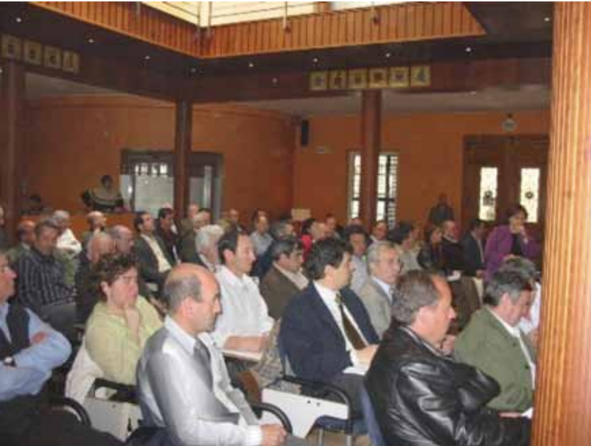
Junta General Huerta Solar.

solar colectiva permitía además minimizar los costes, al darse una gestión integral en régimen de comunidad de propietarios (mantenimiento, seguros, etc.). Se trataba por lo tanto de una experiencia que permitía por primera vez el acceso a los ciudadanos al estatus de productores de energía renovable.