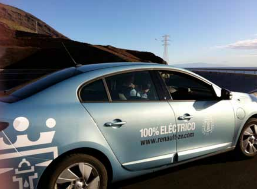
Experiencias con vehículos eléctricos.

co. Dado que el proyecto incluye una planta de desalación para el propio sistema, y ya en la isla se cubre buena parte del agua de consumo humano con agua desalada (casi el 10% de la demanda energética de la isla se dedica a la desalación), se abren las puertas a la posibilidad de acumular energía renovable en forma de agua dulce en una isla con gran carencia de recursos hídricos, así como de trabajar en la mayor eficiencia energética y la reducción de pérdidas. El binomio agua-energía se convierte así en otro de los aspectos singulares del sistema.