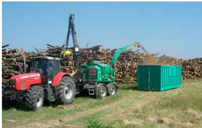
Astilladora. Imagen: Reserva de la Biosfera de Montseny.

En una apuesta clara por la promoción y uso de la biomasa forestal para usos energéticos, en los últimos años en la Reserva de la Biosfera del Montseny se han llevado a cabo diversas líneas de trabajo bien diferen-