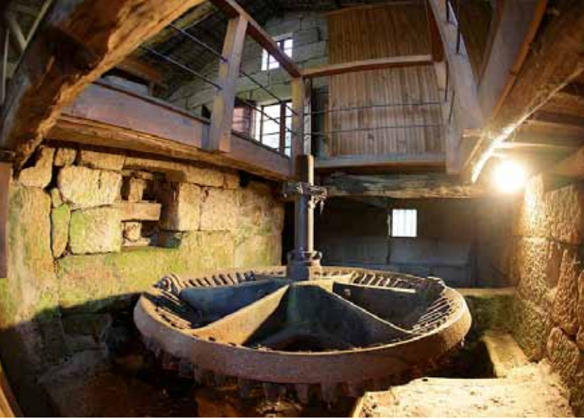
Muiño do Burato, exponente de los numerosos molinos hidráulicos que jalonaban el río Arnoia a su paso por Allariz y que a comienzos del XX se transformó en central hidroeléctrica. Imagen: J. Albertos.

introducción de ganado ovino en régimen extensivo que aproveche los pastos crecidos tras la roza e impida la desordenada proliferación del matorral, respetando el arbolado existente. Se produce así la transición del caos a una ordenación estructurada del territorio, con unos resultados que se han de hacer claramente visibles con el paso del tiempo.