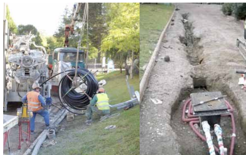
Imagen: Reserva de la Biosfera de Urdaibai.

Operaciones de ejecución de la instalación geotérmica destinada a alimentar el sistema de climatización en la sede del Patronato de la Reserva de la Biosfera de Urdaibai.