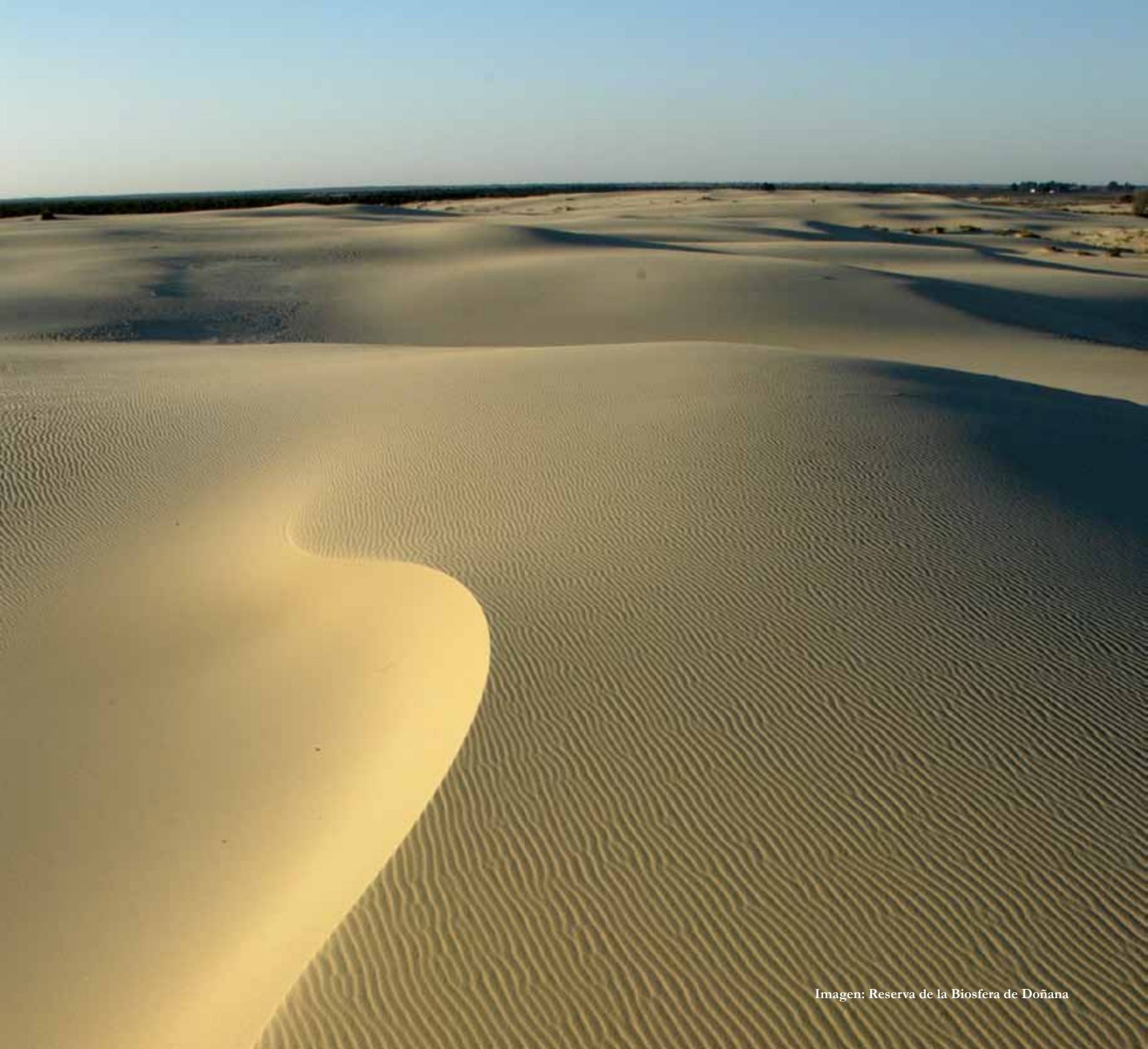
Imagen: Reserva de la Biosfera de Doñana