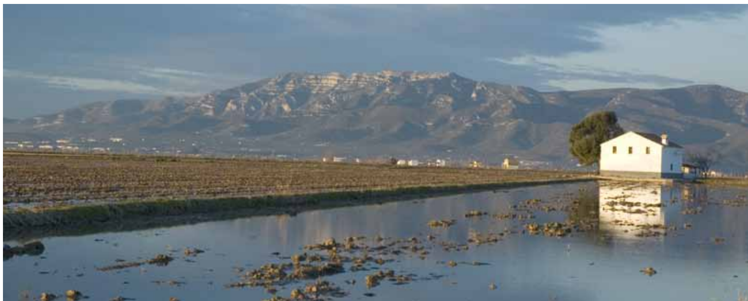
Imagen: Reserva de la Biosfera Terres de l'Ebre.

Autores: Josep Aragonés y Marga Estorach