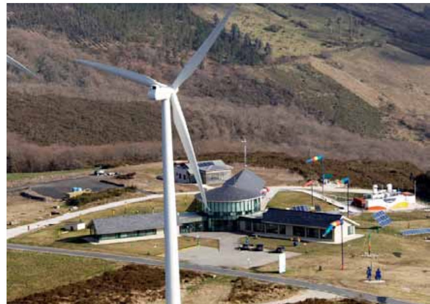
Imagen: Parque Eólico Experimental Sotavento.

Huerto solar que alberga módulos fotovoltaicos de silicio monocristalino y policristalino, módulos fotovoltaicos CIS de capa fina e instalaciones fotovoltaicas montadas sobre seguidores solares a uno y dos ejes.