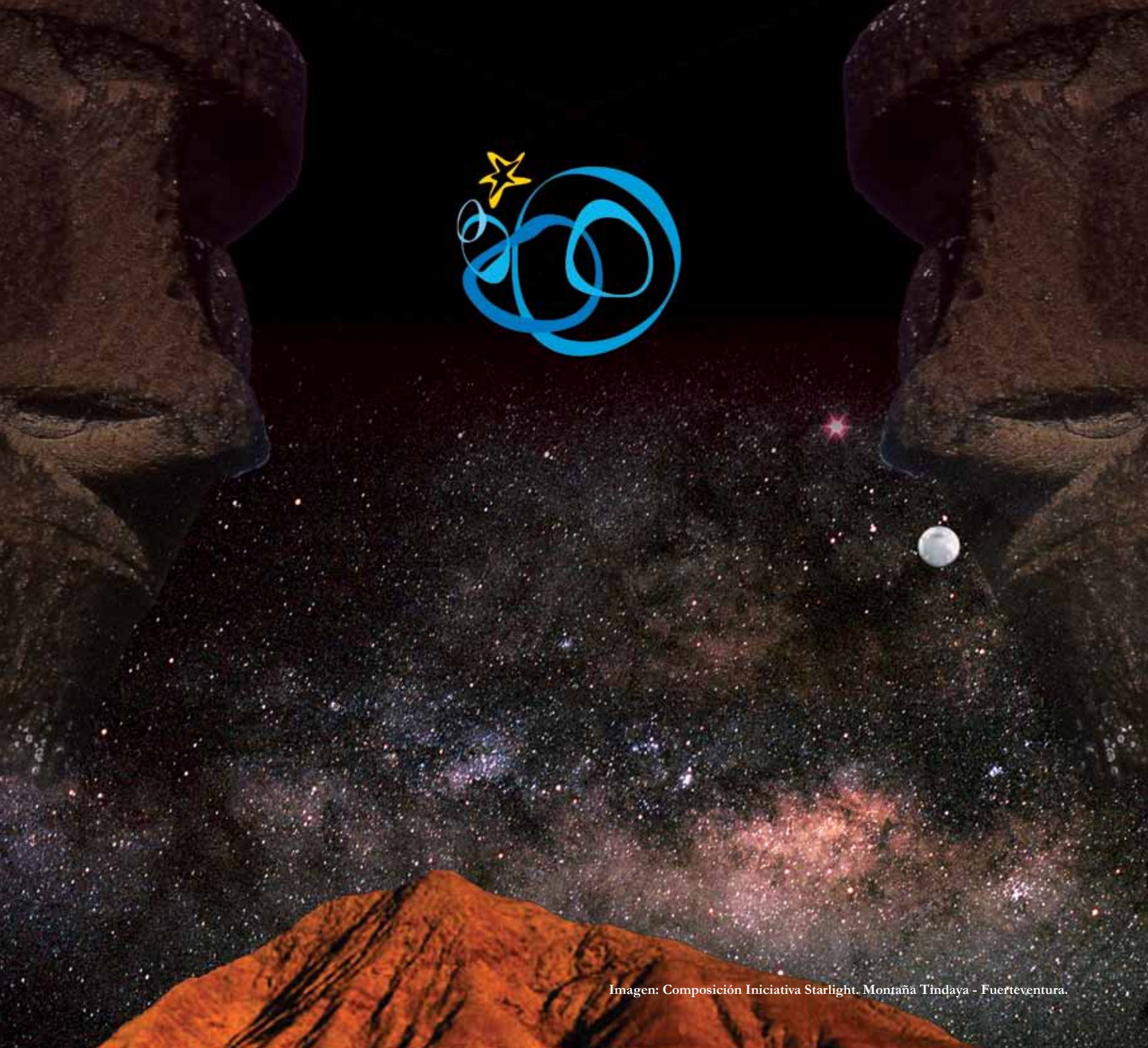
Imagen: Composición Iniciativa Starlight. Montaña Tindaya - Fuerteventura.