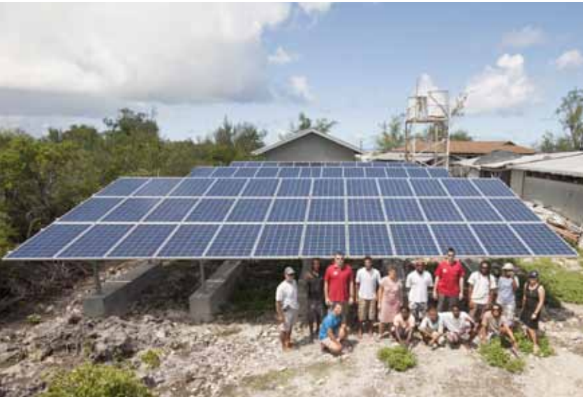
Renovables y conservación en los sitios de la UNESCO. Una central fotovoltaica alimenta la estación biológica en el Atolón de Aldabra.

que combinen la mitigación y adaptación al cambio climático, con el mantenimiento de la integridad de los ecosistemas y la biodiversidad, así como con el desarrollo social, incluidas las necesidades de las comunidades locales, especialmente en el contexto de la explotación de los recursos naturales y la generación de energía”. Se refuerza así la dimensión del uso sostenible de los recursos energéticos en el marco de las funciones asignadas a las reservas de la biosfera.