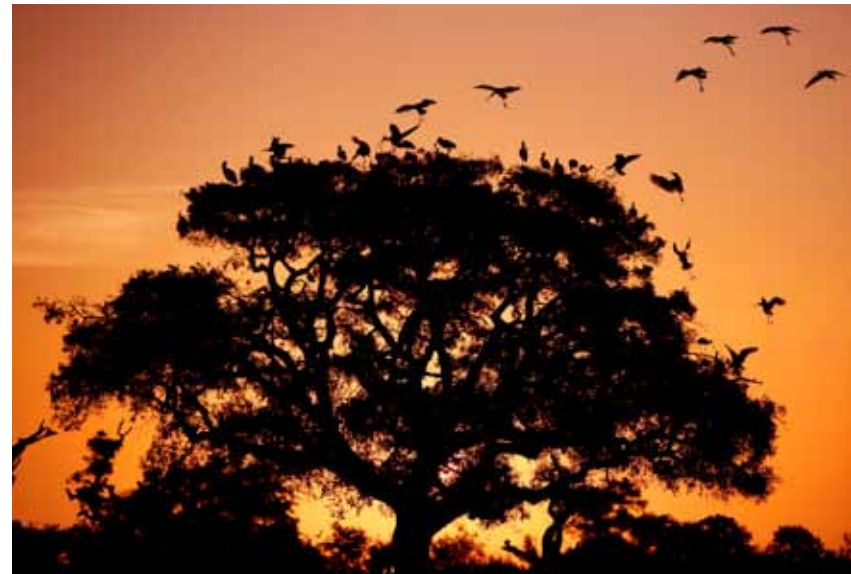
Imagen: Reserva de la Biosfera de Doñana.

vegetal extraordinaria, que le han hecho merecedora de reconocimientos internacionales, entre ellos: bien incluido en la Lista del Patrimonio Mundial, Humedal Ramsar de Importancia Internacional, Zona de Especial Conservación y Reserva de la Biosfera.