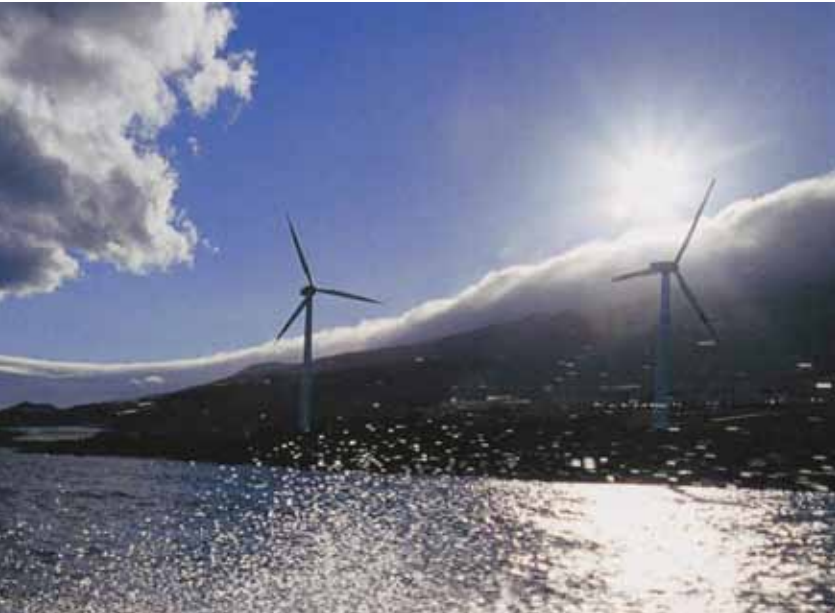
Parque eólico de Garafía.

Esto es especialmente importante para el sector turístico local. Máxime en La Palma que está certificada como el primer Destino Sostenible del mundo por el ITR.