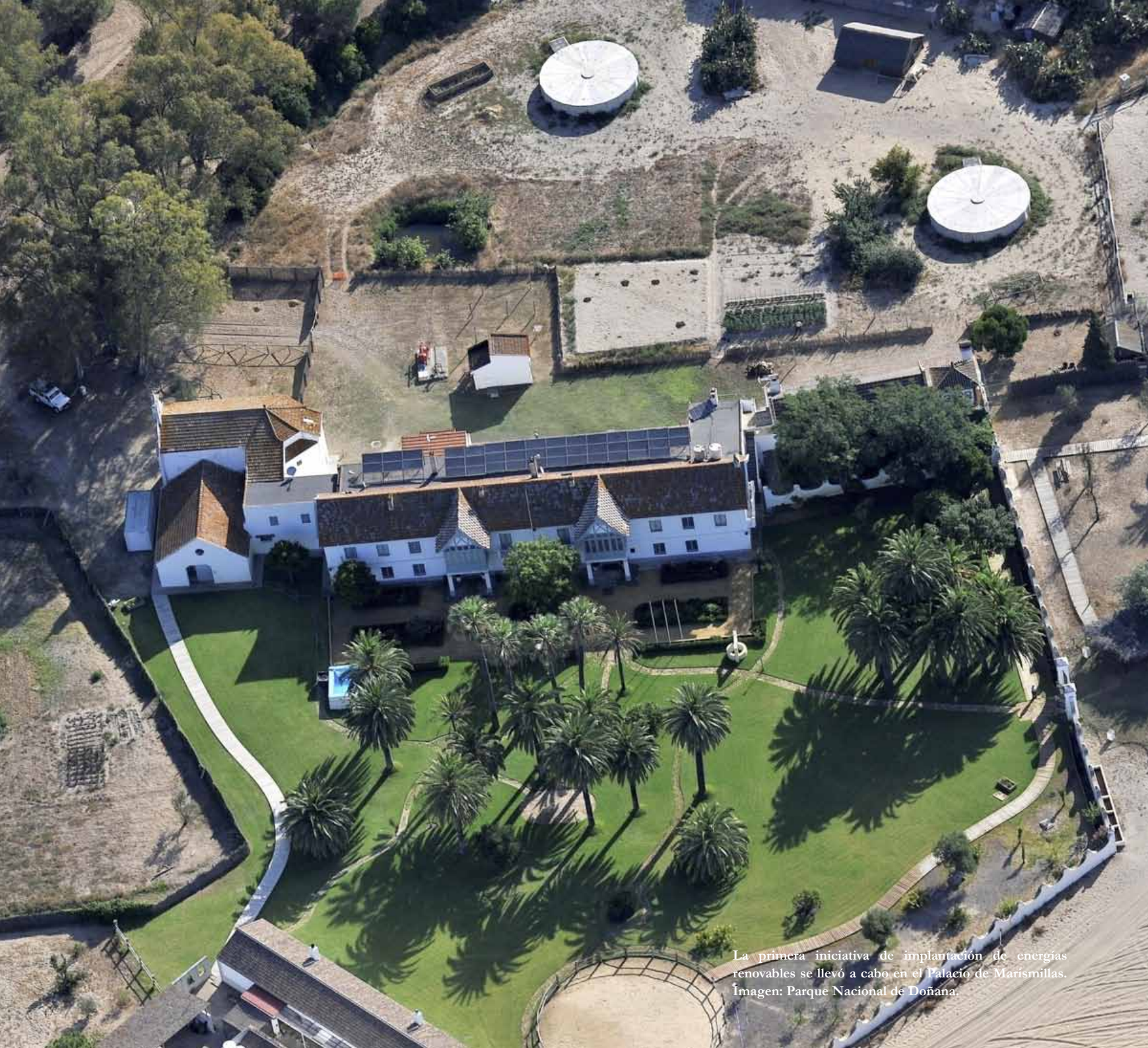
La primera iniciativa de implantación de energías renovables se llevó a cabo en el Palacio de Marismillas.