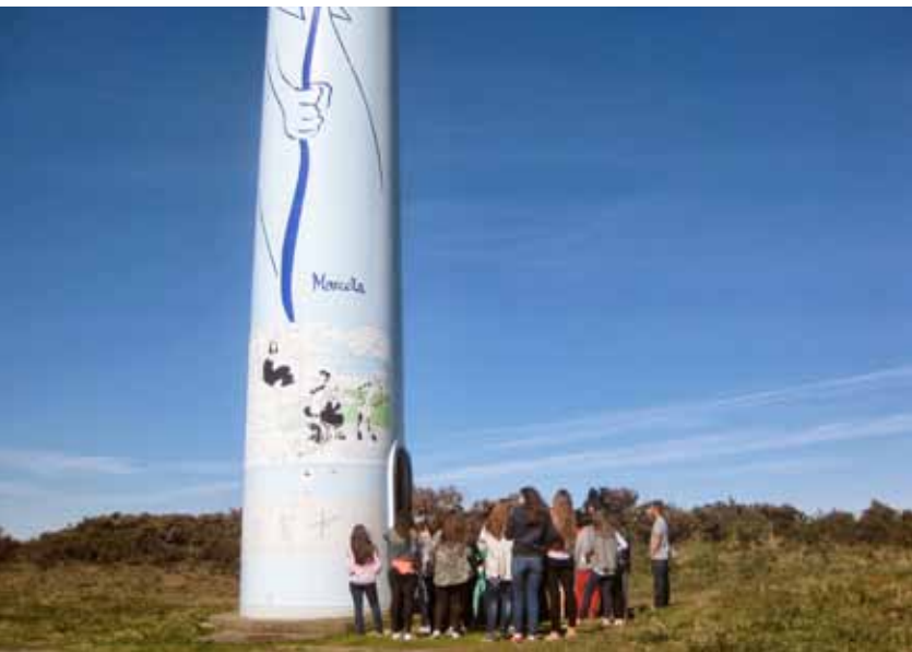
Imagen: Parque Eólico Experimental de Sotavento.

Vivienda bioclimática demostrativa en la que se ha implementado una amplia variedad de soluciones “activas” y “pasivas”. Entre las activas se encuentran las instalaciones solares térmicas asociadas. Esta iniciativa fue galardonada con el Premio Solar Europeo 2011 en la categoría de Educación y Formación.