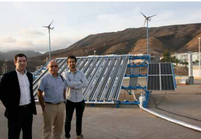
Proyecto Frío Solar en Morro Jable.

En estas condiciones, la generación de agua desalada a partir de las fuentes de energía renovable no solo es una opción, es la solución más viable en islas y zonas costeras áridas, especialmente cuando se dispone de recurso eólico o solar en abundancia. Para ello es igualmente importante que el sector turístico se comprometa a planificar su actividad a partir del “agua renovable”.