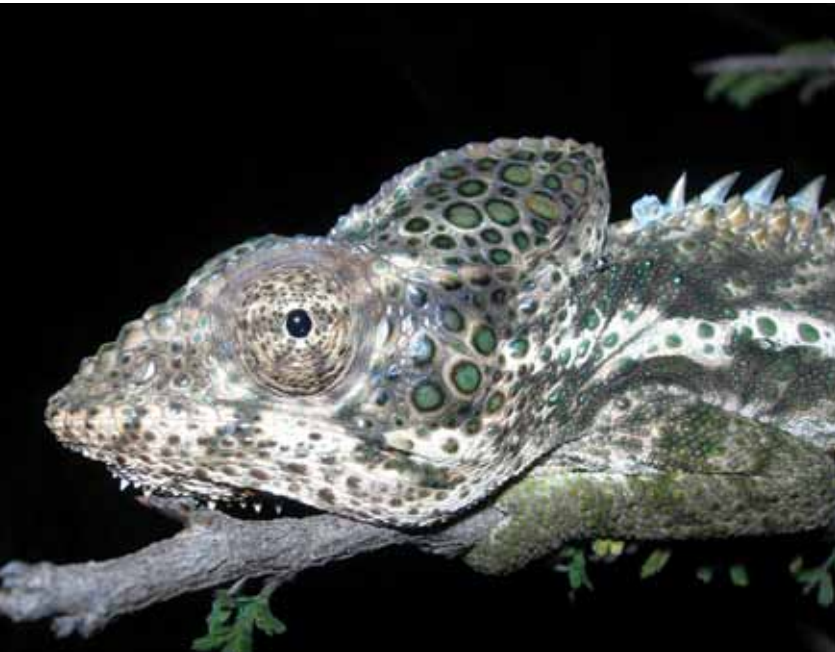
Biodiversidad en la noche.

con menos de 10.000 habitantes es de 106 kWh/hab/año, frente a los 62 kWh/hab/año de los que poseen más de 75.000 habitantes. Además, los municipios pequeños tienen una media de 172 puntos de luz por 1.000 habitantes frente a los 73 de los grandes.