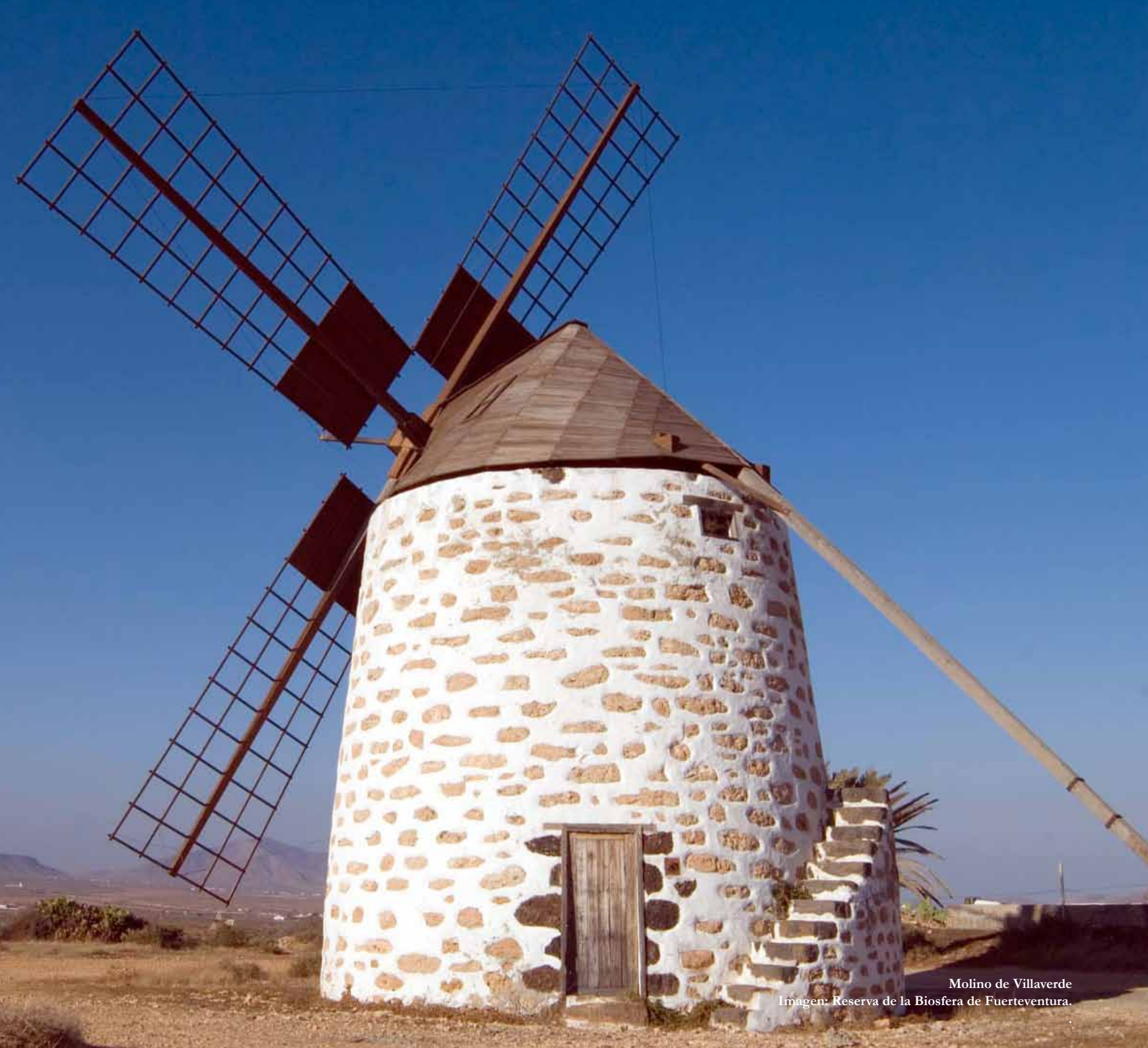
Molino de Villaverde