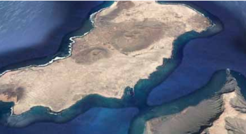
La Graciosa, al norte de Lanzarote.