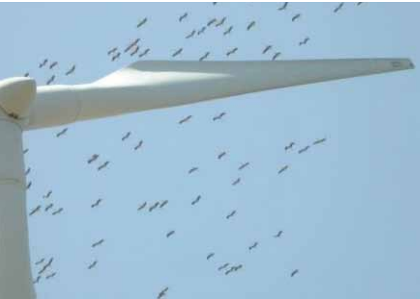
Paso de cigüeñas en la Janda (Tarifa).

torias peligrosas de las aves que podrían resultar en colisiones con las aspas. Una vez detectadas, se ordena la parada de los aerogeneradores implicados hasta que pasa el riesgo. El mayor esfuerzo de vigilancia se produce durante el paso postnupcial, que resulta el más numeroso en la zona en cuanto a ejemplares se refiere. En este período se incrementa el personal dedicado a la vigilancia y se programa la parada activa de aerogeneradores.