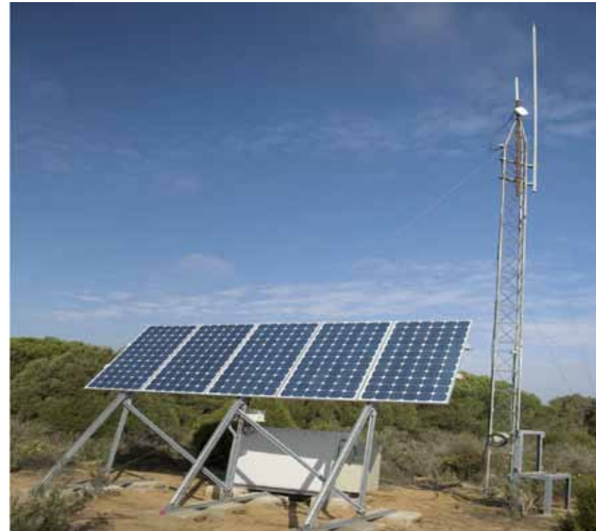
Imagen: Doñana Reserva de la Biosfera

Las reservas de la biosfera están llamadas a trabajar en red, y una de sus tareas consiste precisamente en difundir las buenas prácticas existentes con el objetivo de cooperar para su replicación, y no solo a nivel de cada estado. Este sería el caso de proyectos de éxito como de “Luz en Casa” desarrollado en Perú y México por Acciona Microenergía (socio de la iniciativa Energía Sostenible para Todos de la ONU). La presencia española en el IBEROMAB podría ayudar a reproducir esta y otras iniciativas de interés en diversos lugares de Latinoamérica pertenecientes a la red.