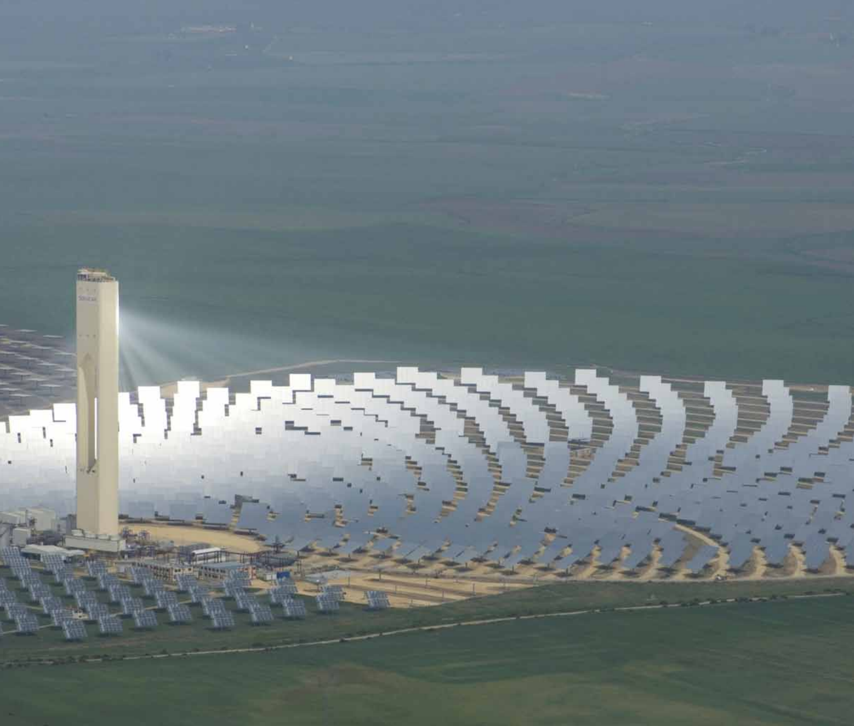
Central termosolar en la Reserva de Biosfera de Doñana.