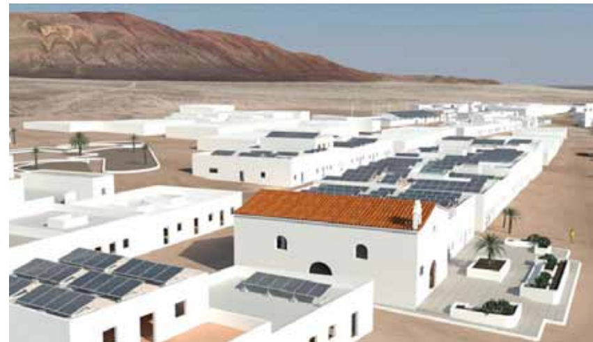
Aprovechamiento solar previsto en los tejados de La Graciosa.

El proyecto de la microrred de La Graciosa permitirá al ITC y a ENDESA continuar avanzando y consolidando el conocimiento en este área (microrredes y redes inteligentes con alta penetración de energías renovables), con un enorme potencial para Canarias en la búsqueda de soluciones más sostenibles de suministro energético limpio que contribuyan a la autosuficiencia energética de las islas.