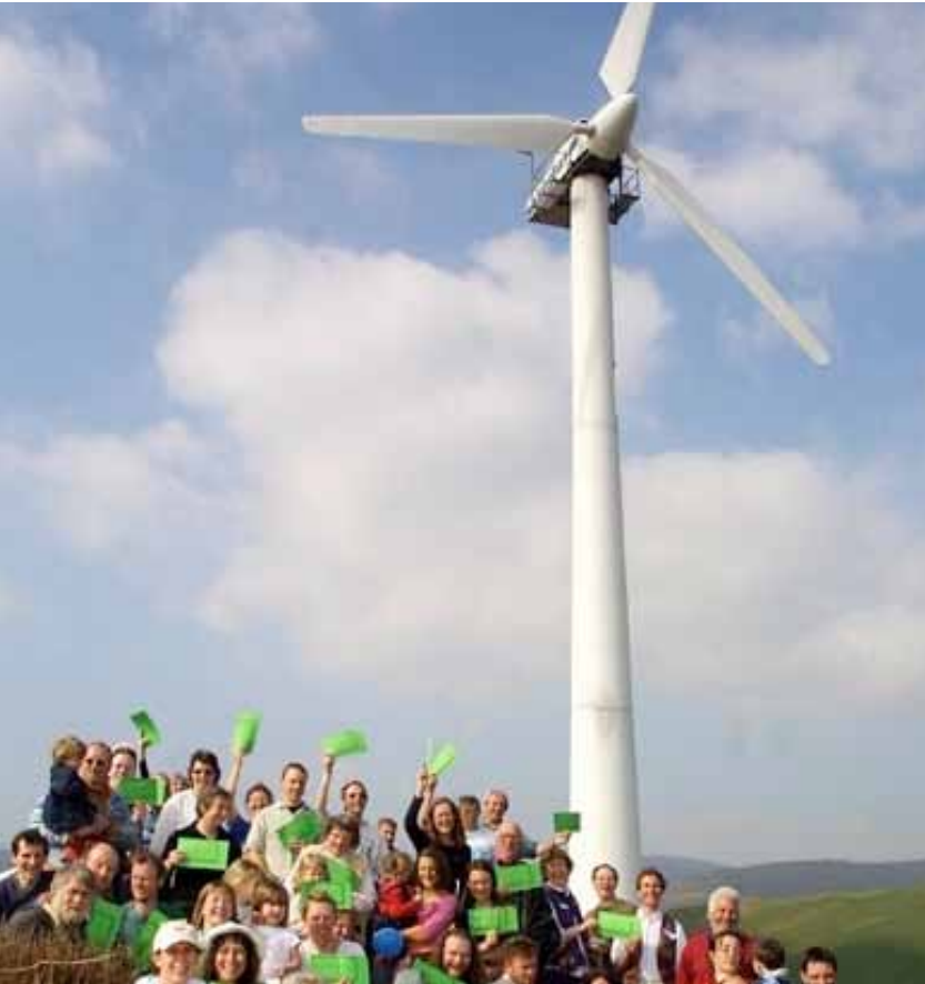
Imagen: BroDyfi, modelo de cooperativa de energías renovables en la RB de Dify (Gales).