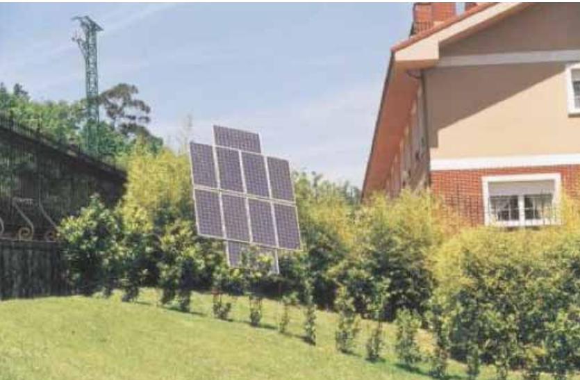
Instalación fotovoltaica en la sede del Patronato de la Reserva de la Biosfera de Urdaibai.

5/1989 en su artículo 15, y con su posterior aplicación. Dicho documento zonifica el suelo rústico de la Reserva de la Biosfera de Urdaibai y regula los usos y los actos de construcción autorizados en cada una de las zonificaciones.