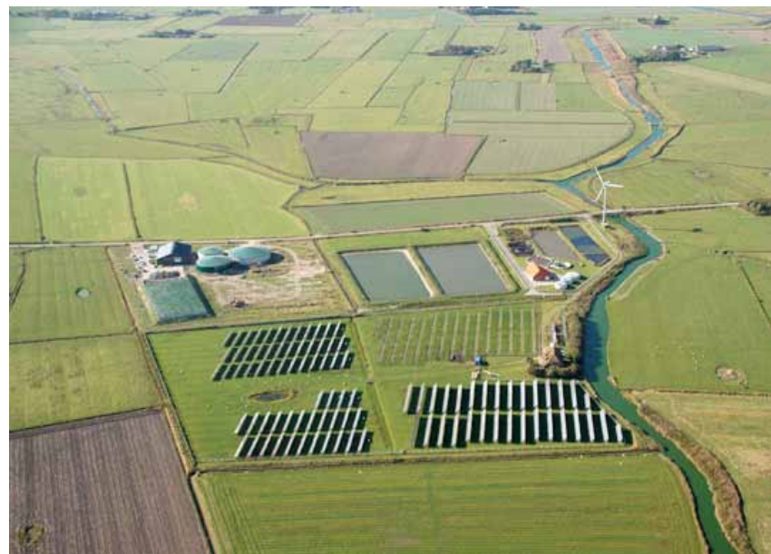
Imagen: Pelworm, una referencia real de red inteligente en una reserva de la biosfera de larga experiencia en generación distribuida con una alta participación de granjeros.

No se trata de ficción, como así nos demuestra en el apartado de acumulación el proyecto de la central hidroeléctrica de la Reserva de la Biosfera de El Hierro. En este caso se dispone de un parque eólico que utiliza los excedentes de su producción en bombear agua que, una vez almacenada en un depósito superior, se convierte en una fuente continua de