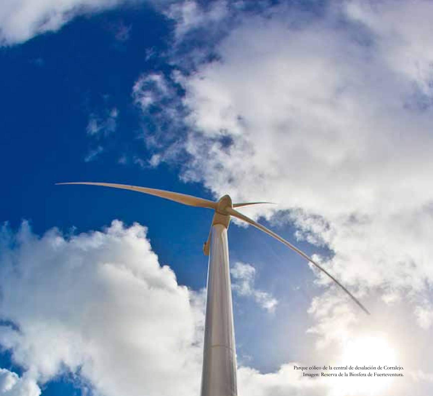
Parque eólico de la central de desalación de Corralejo.