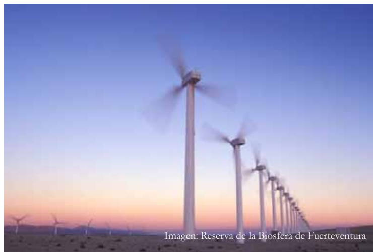
Imagen: Reserva de la Biosfera de Fuerteventura