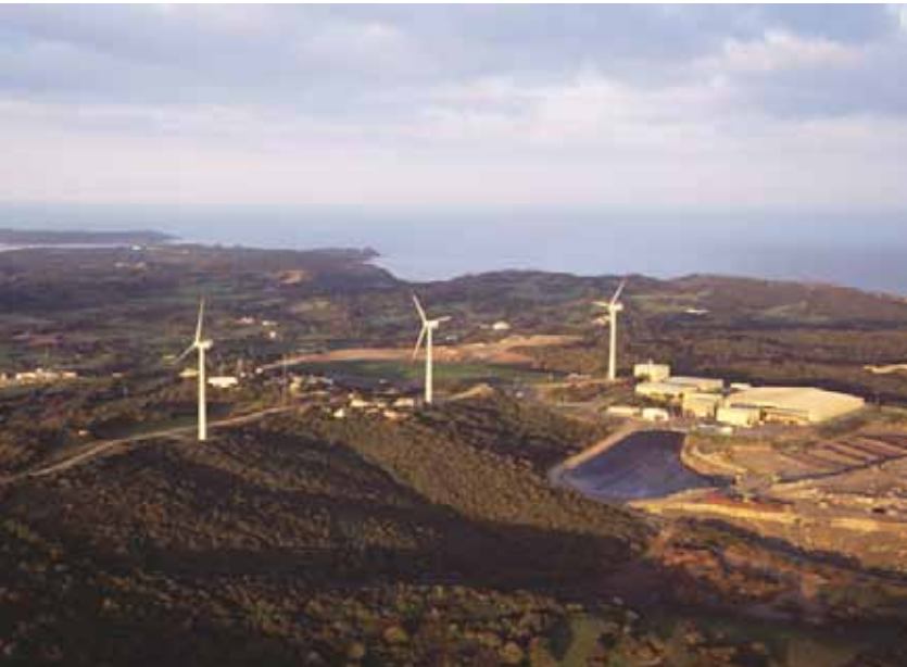
Parque eólico de Milá.

Estas actuaciones han sido seguidas de una gran diversidad de proyectos, entre los que destacan los generados desde el sector privado. Entre ellos cabe reseñar el proyecto de Son Salomó que, con 4 MW, constituye una de las mayores huertas solares instaladas en reservas de la biosfera. Su producción alcanza el 5% de toda la energía que se consume en Menorca y representa el equivalente del suministro anual de 1.800 familias.