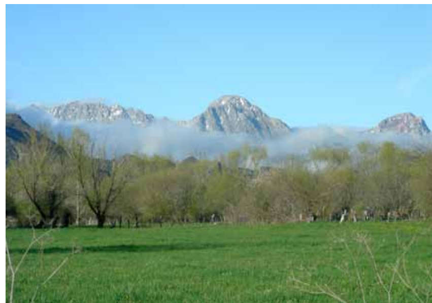
Imagen: RB de Babia. Peña Ubiña.

Antes del cambio a biomasa, realizado en 2010, estos edificios contaban con equipos de calefacción a base de combustibles fósiles: gas propano en Cabrillanes y gasóleo en Huergas de Babia.