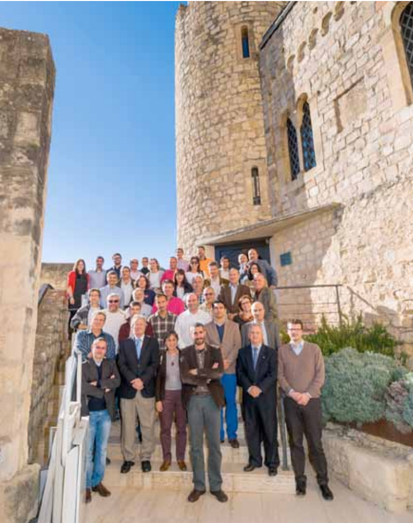
Participantes y ponentes del Seminario.

La movilidad constituye otro de los factores clave, llegando a representar en varias reservas de la biosfera más del 50% de las necesidades energéticas totales. Ello implica la necesidad de promover modos de transporte de bajo consumo y respetuosos con el medioambiente y apostar por sistemas de motorización de nula o baja emisión, como los vehículos eléctricos cuando estos están alimentados a partir de fuentes de energía renovables.