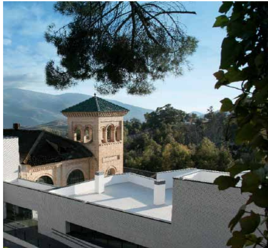
Imagen: Balneario de Lanjarón

Por último, en Julio de 2013 obtuvo para su restaurante la certificación de Restauración Ecológica reconocida por el CAAE (Comité Andaluz de Agricultura Ecológica).