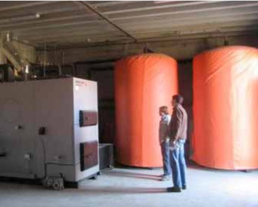
Red de calor en El Brull.

ciadas: la creación de un sistema de consumo directo de este biocombustible, la instalación de varias calderas de biomasa, la realización de planes estratégicos de aprovechamiento de biomasa para usos energéticos y la ejecución de pruebas piloto de producción de biomasa que permiten la valoración tanto técnica como económica del proceso productivo de la astilla.