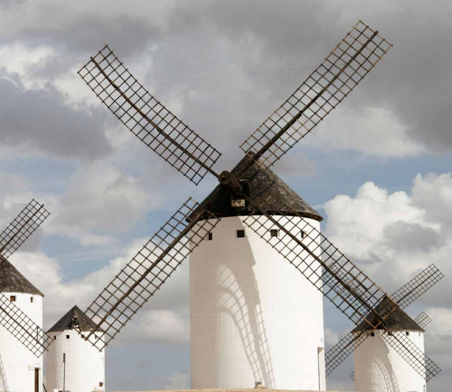
Campo de Criptana.