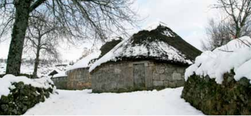
Os Ancares lucenses Reserva de la Biosfera.

alumbrado público. El objetivo principal de estas auditorías es la detección de posibles problemas de eficiencia energética y el planteamiento de nuevas fórmulas para ahorrar costes en los ayuntamientos.