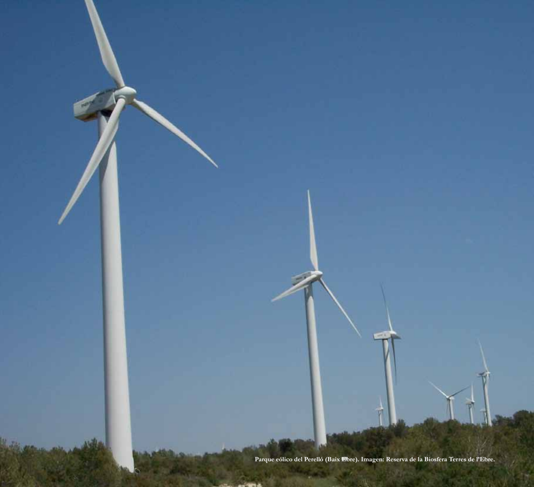
Parque eólico del Perelló (Baix Ebre).