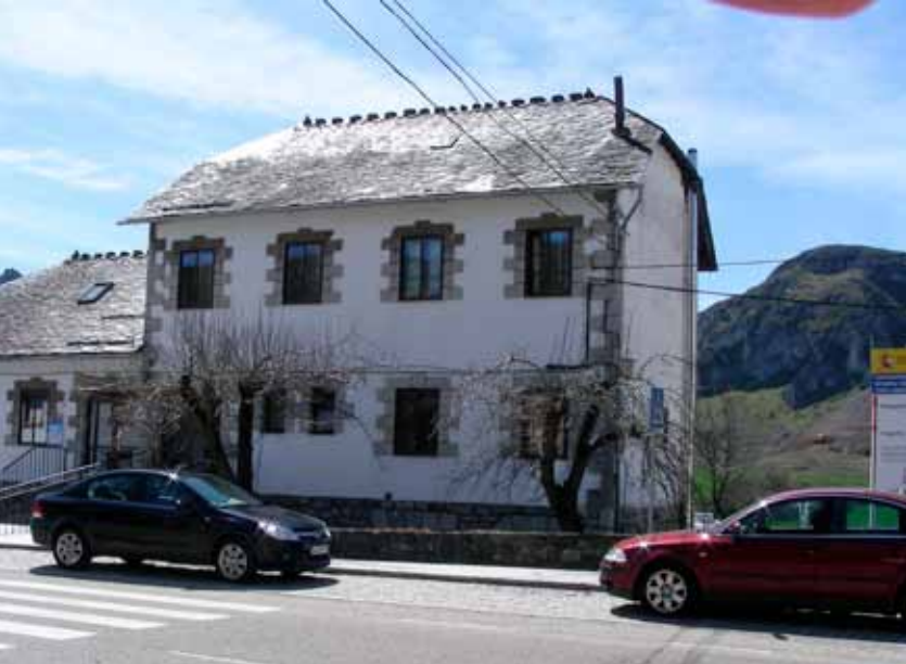
Consultorio y Casa Consistorial.

El análisis de costes realizado en el período 2009-2012 indica un ahorro de casi el 70% respecto al propano y de más del 53% en relación al gasóleo que se utilizaba.