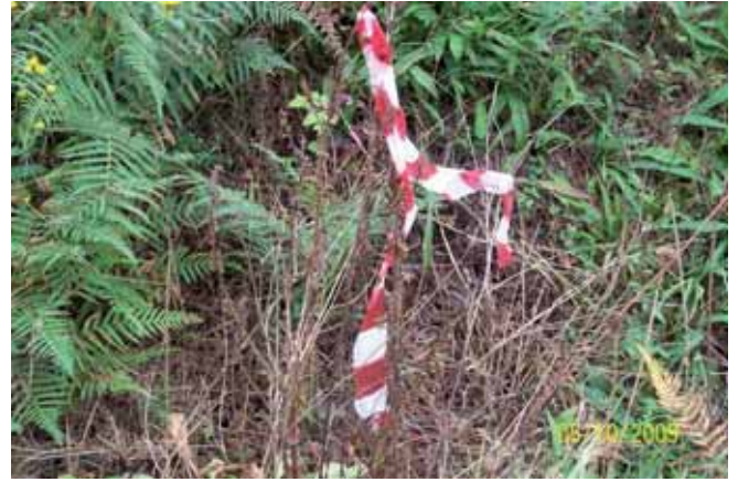
Foto 92: con único tratamiento fue suficiente para producir la muerte de las plantas.