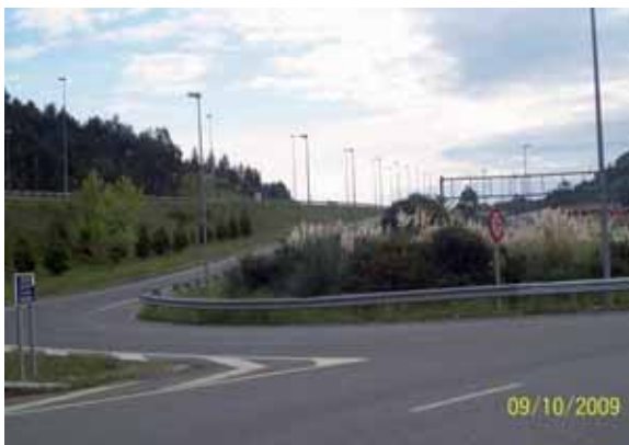
Foto 132: gran cantidad de individuos de Cortaderia seollana en flor localizados en uno de los accesos a la A-8 en Cantabria.

La solución del problema de las plantas alóctonas invasoras necesita una actuación coordinada de las distintas administraciones públicas, aumentando las inversiones destinadas a potenciar la prevención y el control de estas especies dañinas para nuestros ecosistemas. Un claro ejemplo se encuentra en la gran cantidad de individuos de Cortaderia