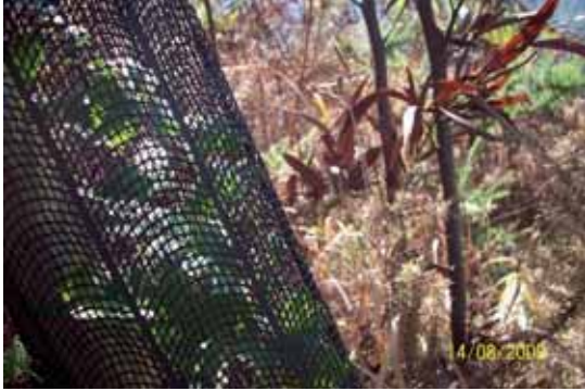
Foto 49: a la izquierda se observan las hojas verdes de un Serval, a la derecha las hojas marchitas de una Acacia negra tratada al 2% con Roundup.

Los árboles autóctonos de replantación, que fueron tapados con bolsas de plástico para protegerlos del tratamiento al 2 % de Roundup, parece que no se vieron afectados por la aplicación del herbicida sobre las Acacias negras situadas en sus proximidades.