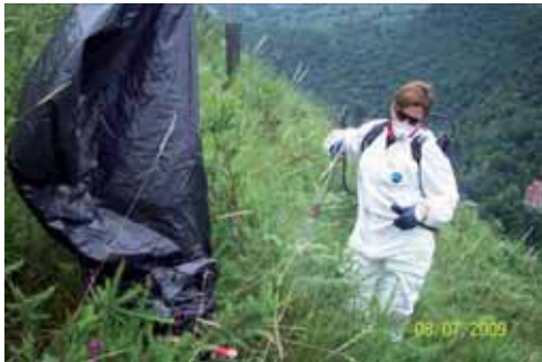
Foto 13: operario aplicando herbicida sobre plantas jóvenes de Acacia melanoxylon . Protección mediante una bolsa de plástico de una estaca de una plantación con un árbol autóctono.

manuales pulverizadoras a una concentración del 2-3%. El 3% se utilizó en zonas degradadas y bordes de carretera, mientras que la concentración al 2% se usó en zonas protegidas y sensibles como por ejemplo, en las proximidades de ríos. En el caso de encontrarse en las inmediaciones especies vegetales autóctonas de especial interés, estas se protegieron con bolsas de plástico durante la aplicación del tratamiento.