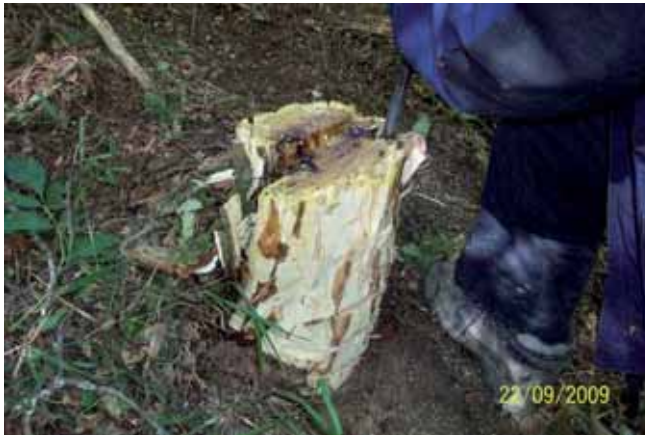
Foto 112: con un punzón y un martillo, se quita la corteza exterior de la Robinia y se profundiza en la heridas.