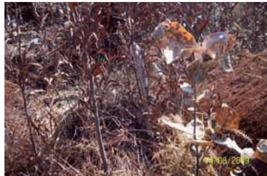
Foto 79: En primer término de la imagen se observa un Eucalipto tras un mes de aplicación con Roundup, al fondo las Acacias Negras también se encuentran totalmente muertas.