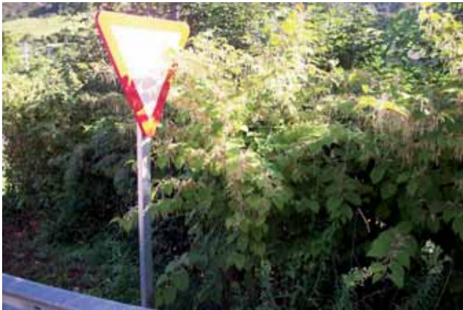
Foto 101: Reynoutria japonica creciendo al borde de la carretera. Soberón. T.M. Onís As-114 pk 14