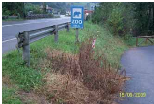
Foto 104: un mes después del tratamiento con Roundup al 3%, los individuos se encontraban totalmente muertos.