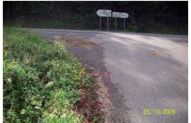
Foto 89: un mes y medio después del tratamiento el individuo estaba completamente muerto.