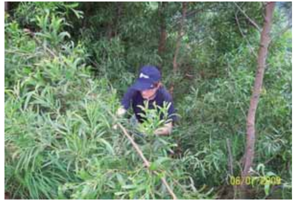
Foto 22: aquí se aprecia claramente el carácter invasor de esta especie.

Todos los individuos tratados en este proyecto, se encontraban localizados en Cuesta Ginés, Covadonga, en el Término Municipal de Cangas de Onís. Este árbol invadía una superficie aproximada de unos 3000 m 2 y se encontraba amenazando a una repoblación de árboles autóctonos (Roble, Serval, Acebo y Abedul) plantados en los inviernos 2005/2006 y 2006/2007.