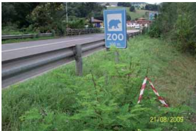
Foto 103: individuos de pequeño tamaño creciendo en la carretera As-114 pk 4, Cauvilla. T.M. Camgas de Onís.

Los resultados del tratamiento químico han sido excelentes, ya que todos los individuos fumigados perdieron todas sus hojas, que previamente habían quedado marchitas 15 días después una única aplicación.