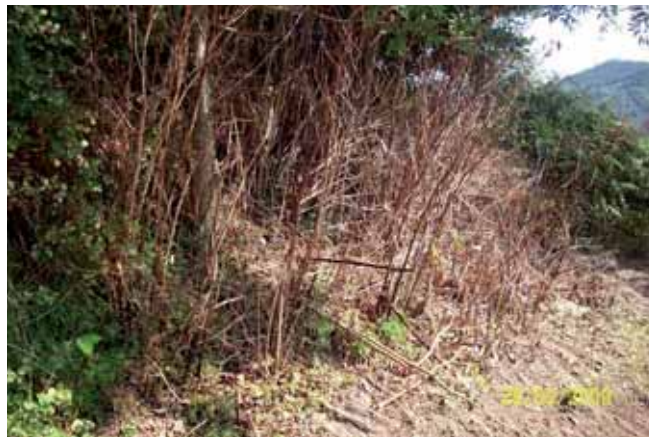
Foto 99: Reynoutria japonica tras la aplicación del segundo tratamiento. Llonín. T.M. de Peñamellera Alta.