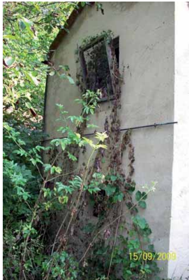
Foto 124: 21 días después la aplicación del herbicida, las hojas del Senecio mikanioides se encontraban marchitas.