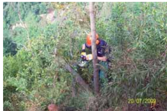
Foto 17: corte con motosierra de Acacia melanoxylon .

porte), en este último caso el operario encargado de utilizarla, usó el correspondiente equipo de protección individual (casco, orejeras, botas y guantes de seguridad y perneras de protección).