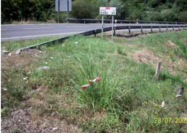
Foto 68: Cortaderia selloana creciendo al borde de la N-621 pk 178 T.M. Peñamellera Baja.