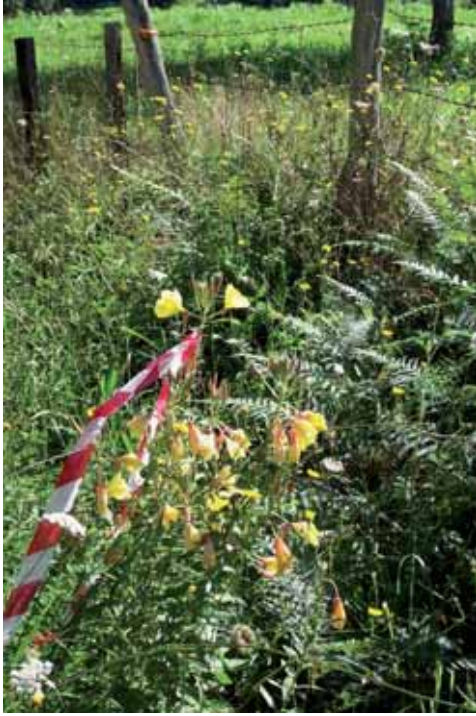
Foto 93: individuos de Oenothera glazoviana creciendo al borde de un pastizal. Ería de Rozada. T.M. Onís.