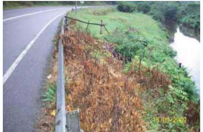
Foto 57: al estar próximos a una ribera fluvial, fueron fumigados al 2% con Roundup. As 114 pk 7.