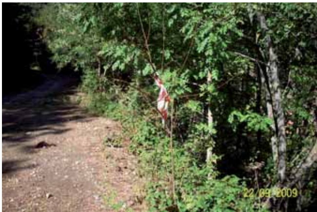
Foto 107: Robinia pseudoacacia fumigada en la pista forestal de Pido. T.M.Camalño.