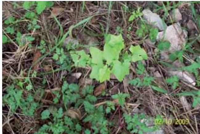
Foto 129: De todas formas, se realizo una segundo pase de fumigación porque se encontraron pequeñas matas que habían vuelto a nacer.