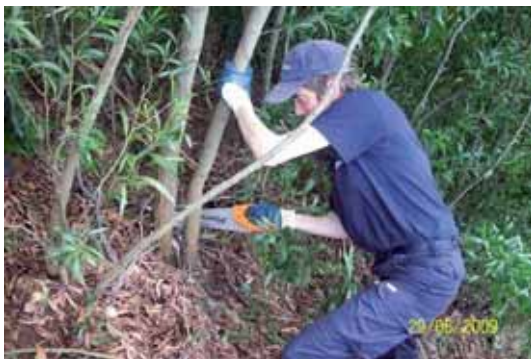
Foto 16: operario cortando con serrucho Acacia melanoxylon .