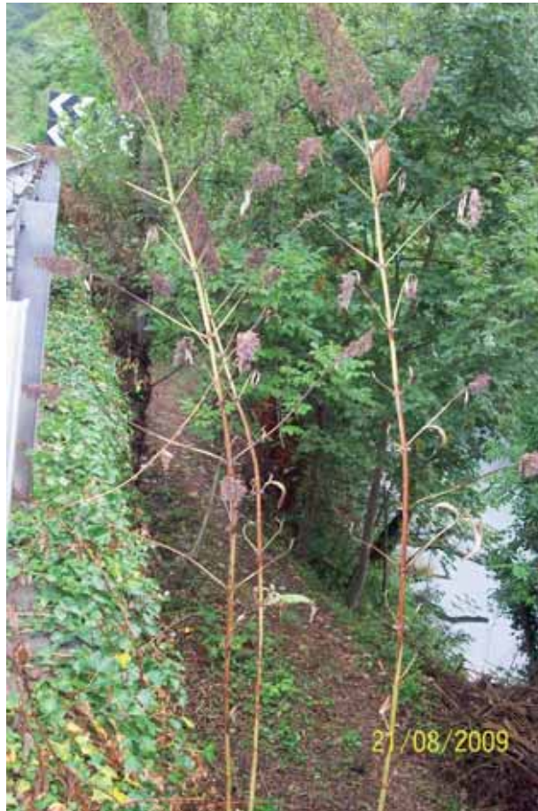
Foto 62 : detalle de dos Buddlejas un mes después de haber sido fumigadas, se observa cómo la planta ha perdido todas sus hojas. N-625 pk 151.

Sede Social: Maldonado, 58 28006 Madrid Tel.: 91 396 34 00 Fax.: 91 396 34 88