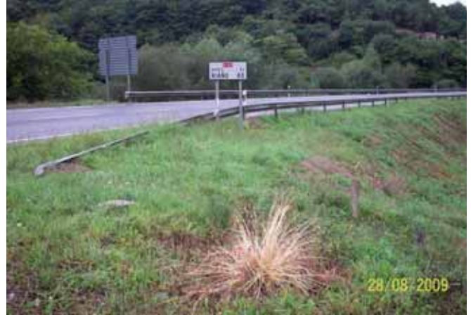
Foto 69: un mes después de el tratamiento el Plumero de la Pampa estaba totalmente muerto.