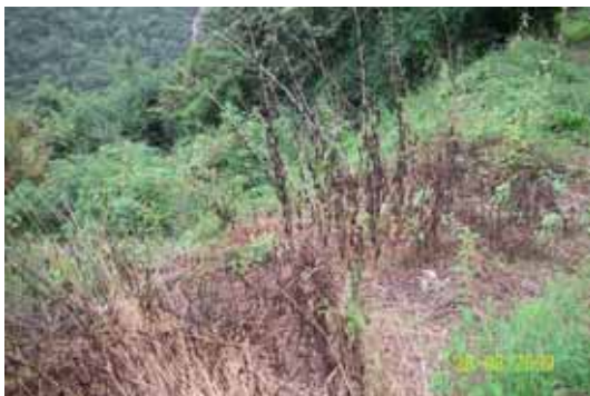
Foto 130: la mayoría de la mancha se encontraba muerta después del primer tratamiento.