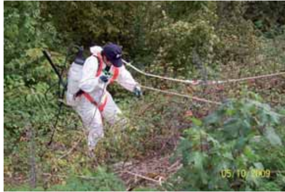
Foto 20: operario usando un arnés para llegar a una mancha de Reynoutria japonica .

En determinadas actuaciones puntuales fue necesaria la utilización de un arnés de seguridad para acceder a individuos que se encontraban en zonas de difícil acceso.