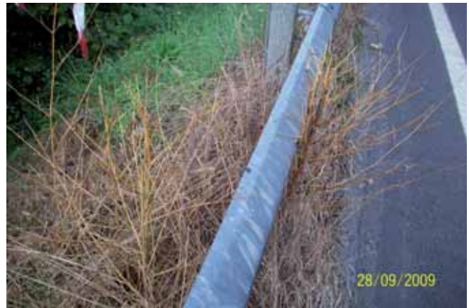
Foto 94: el 27 de agosto se dio una segunda aplicación, y pasado un mes, los individuos habían perdido todas sus hojas.