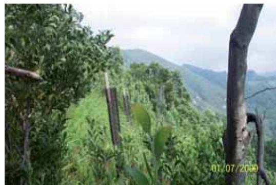
Foto 24: zona de las estacas de repoblación donde crecía también Acacia melanoxylon .