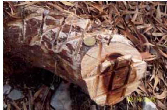
Foto 47: en la foto, se aprecian las heridas practicadas con la motosierra para facilitar la penetración en el tocón de la mezcla Roundup y Gasoil.