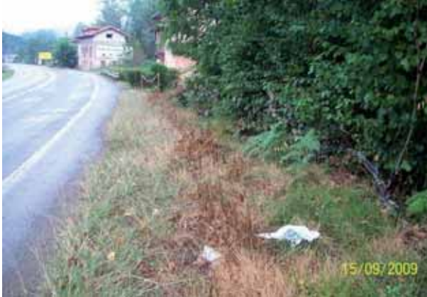
Foto 54: un mes después del tratamiento con Ruondup al 3%, todos los individuos tratados estaban muertos. As-114 pk 5.