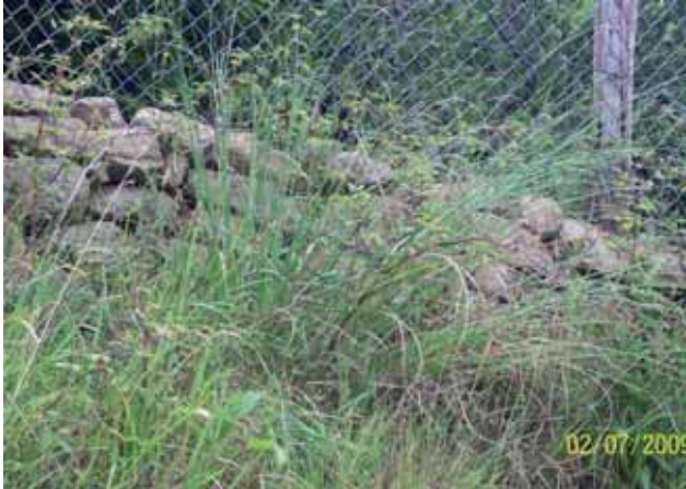
Foto 70: Cortaderia seollana creciendo en un muro N-621 pk 181 en Buelles T.M Peñamellera Baja.