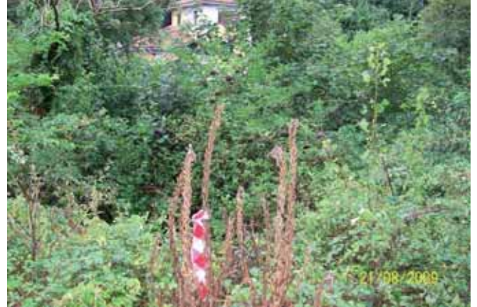
Foto 83: un mes después la planta se encontraba totalmente muerta.