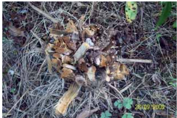
Foto 66: Buddleja davidii situada en N-625 pk 150. Se pinceló el 18 de Agosto, un mes después no presentaba ningún rebrote.