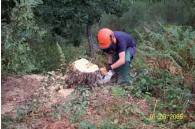
Foto 110: una vez cortada la Robinia, con la misma motosierra se le realizaban cortes para facilitar la penetración de la mezcla Roundup-Gasoil.