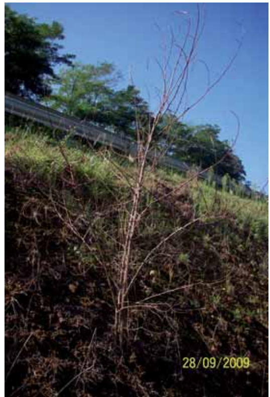
Foto 106: Robinia pseudoacacia fumigada en As-114 pk 14. Soberón. T.M.Onís.