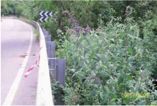
Foto 60 : Buddleja davidii creciendo al borde de la carretera N-625 pk 151.

Los resultados de la fumigación se consideran satisfactorios, ya que se ha logrado la muerte de los individuos tratados.