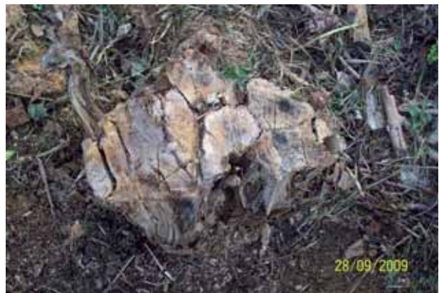
Foto 64: dos meses después el tucón no tenía ningún rebrote. N-625 pk 148.