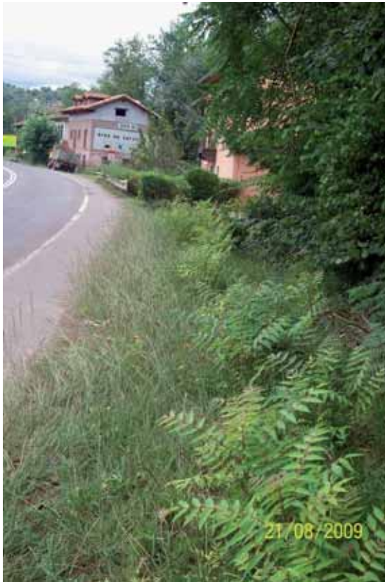
Foto 52: individuos jóvenes de Ailanthus altissima creciendo al borde de la carretera As-114 pk 5, en Cauvilla. T.M. Cangas de Onís.

Se trataron químicamente varios individuos que se encontraban en la carretera de la As-114. En las inmediaciones también se encontraban Ailantos de gran porte pero no fueron tratados (debido a su gran tamaño y a la proximidad de la carretera, se desestimó cortarlos con motosierra por los problemas que pudiese causar al tráfico rodado). El efecto del herbicida sobre los individuos tratados resultó efectivo ya que se consiguió la muerte de todos ellos con un única aplicación. Para la erradicación total de esta especie en las zonas tratadas, ha de eliminarse los árboles de gran porte (ya que producen muchas semillas), además hay que tener en cuenta el banco de semillas que se encuentra en el suelo que podría germinar. Si esto ocurriese, debería aplicarse de inmediato un tratamiento con glifosato, ya que se ha comprobado que es muy efectivo para controlar los plantones del Ailanto.