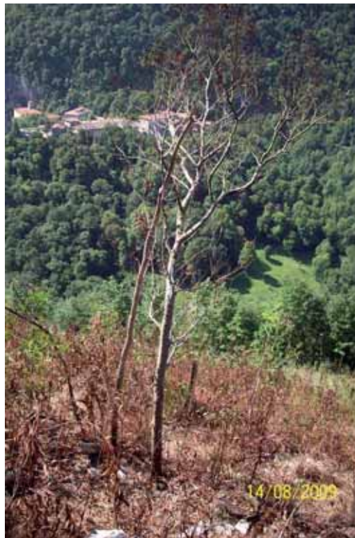
Foto 48: individuo de Acacia negra que no recibió ningún tipo de tratamiento. Su pérdida de hojas probablemente este relacionada con la translocación del Roundup desde los plantones tratados y conectados radicalmente con este pie.

Cabe mencionar que una vez aplicada la primera fumigación sobre los individuos pequeños, se observó a las pocas semanas, que árboles de gran envergadura próximos que no habían sido tratados, comenzaban a marchitarse y a perder sus hojas. Este efecto se explica por la translocación por el floema del glifosato desde los individuos pequeños fumigados que eran hijuelos o brotes radicales de individuos más grandes. Al observarse este efecto, se decidió dejar intactos algunos pies no tratados directamente pero si afectados por translocación para favorecer la movilización del herbicida por toda la zona.