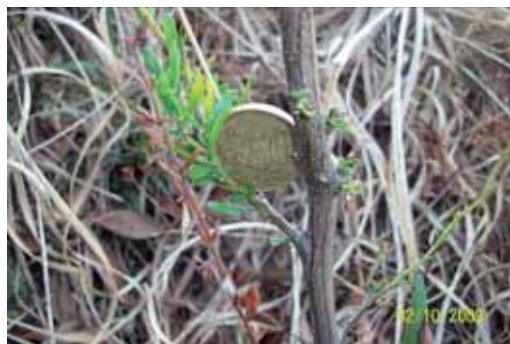
Foto 36: detalle de individuo que después del primer tratamiento, presentaba brotes de hojas nuevas.