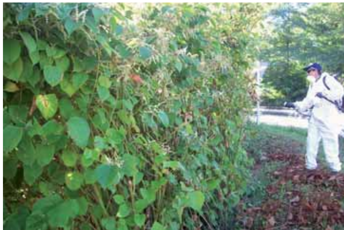
Foto 95: operario fumigando la Reynoutria japonica. As-114 pK 14. Soberón. T.M. Onís.

Para esta especie se utilizó un tratamiento de fumigación con herbicida. La concentración empleada fue del 3% de Roundup, ya que en todos los casos, la planta se encontraba en zonas degradadas o con un alto grado de antropización.