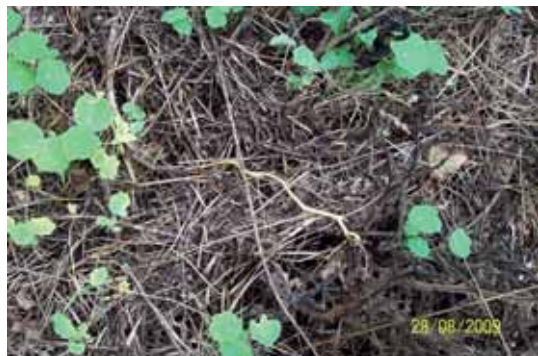
Foto 131: en algunas zonas tratadas, se comprobó que las hojas volvían a salir por lo que fue necesario un segundo pase.