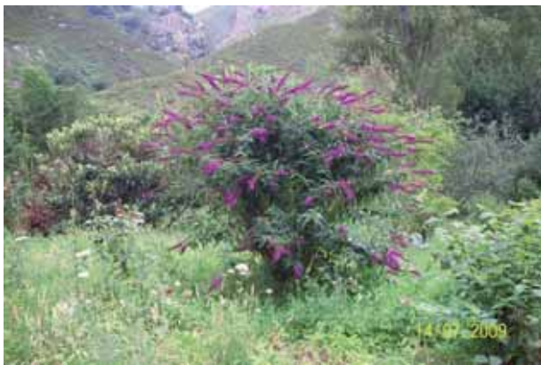
Foto 63: Buddleja davidii antes de ser cortada y pincelada. N-625 pk 148. Miyares. T M Amieva.

En cuanto al tratamiento físico, no se ha producido ningún rebrote de los tocones pincelados. De todas formas, se debería hacer un seguimiento de las zonas tratadas durante los próximos meses para poder sacar una conclusión sobre la verdadera efectividad de las actuaciones llevadas a cabo. En el caso de que los tocones rebrotasen, se deberían fumigar de inmediato para evitar su crecimiento y lograr su muerte definitiva.