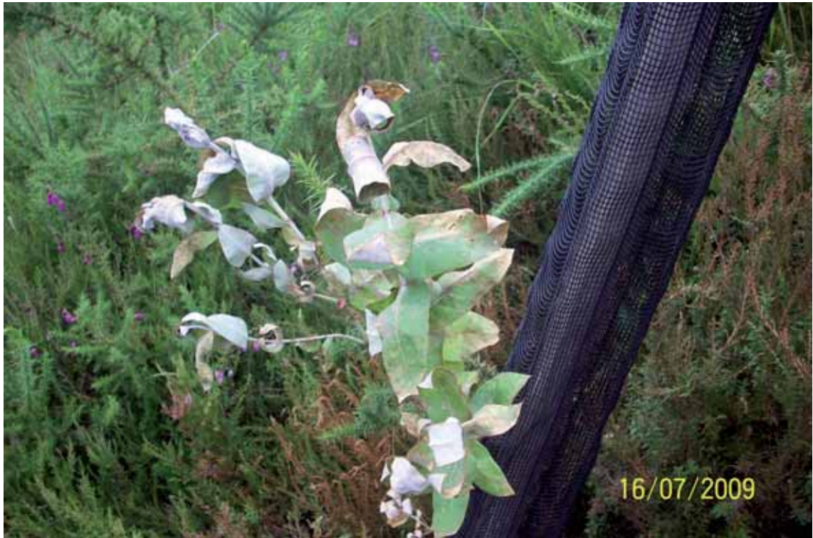
Foto 5: Eucalyptus globulus en Cuesta Ginés, Covadonga. T.M. de Cangas de Onís