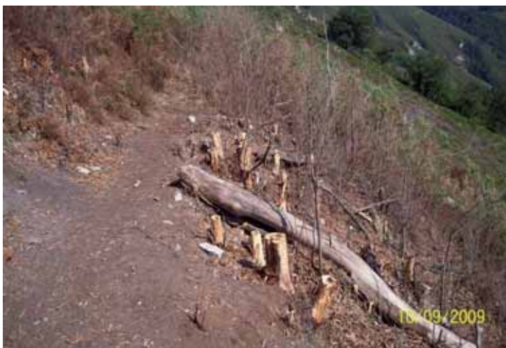
Foto 31: misma zona dos meses después del tratamiento (químico + físico y pincelado)