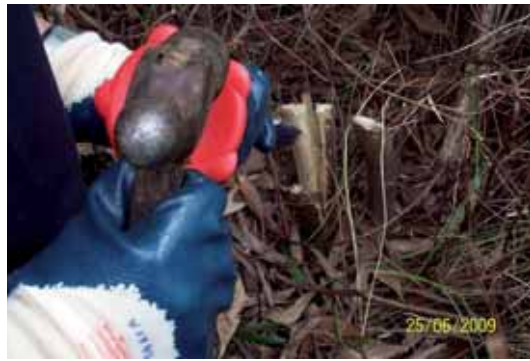
Foto 19: operario utilizando un cincel sobre un tocón de Acacia melanoxylon .

El personal contratado para la ejecución de los trabajos está en posesión del carné de manipulador de productos fitosanitarios expedido por la Consejería de Medio Rural y Pesca, en virtud de la legislación aplicable: