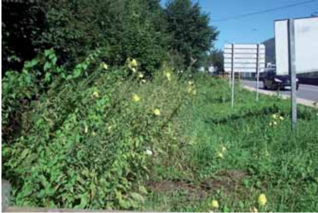
Foto 86: grupo de Oenothera glazoviana creciendo al borde de la carretera. As-114 pk 15. Benia de Onís. T.M. de Onís. Se fumigó el 26 de agosto 2009.