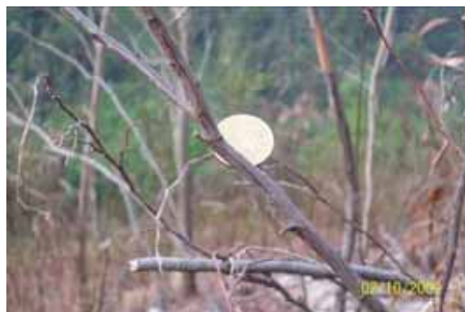
Foto 37: otros individuos, estaban completamente muertos tras la aplicación del primer tratamiento.