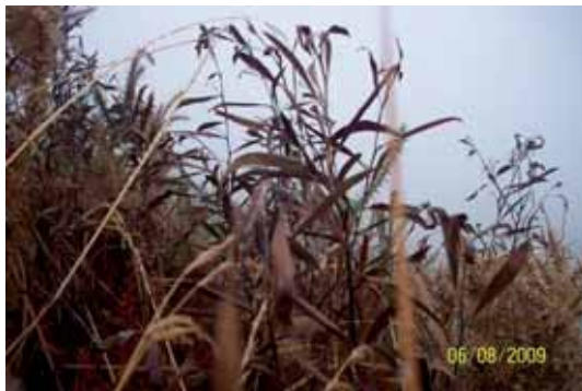
Foto 34: al mes de la fumigación la mayoría de los individuos presentaban sus hojas totalmente marchitas.