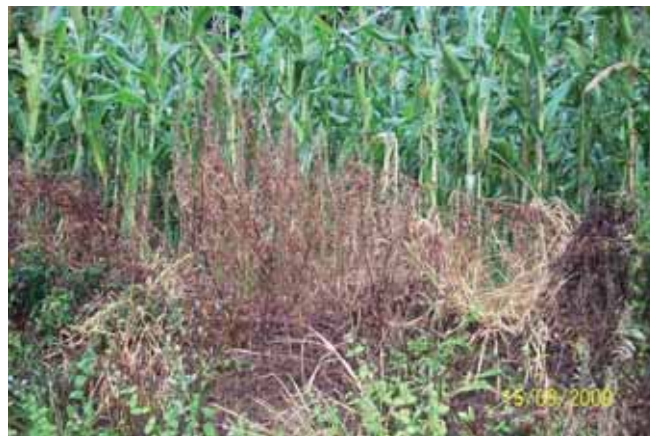
Foto 94: Oenothera glazoviana fumigada al 2% en las proximidades de un maizal. Se observa la muerte de la especie alóctona invasora, sin que el maizal sufriese daño alguno. Corao T.M. Cangas de Onís AS-114 pk 6.