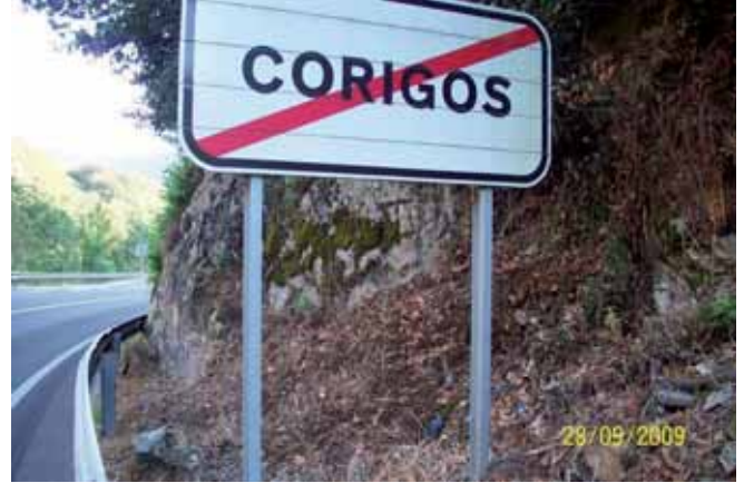
Foto 120: dos meses después del tratamiento, la mayor parte de la zona tratada se hallaba marchita.