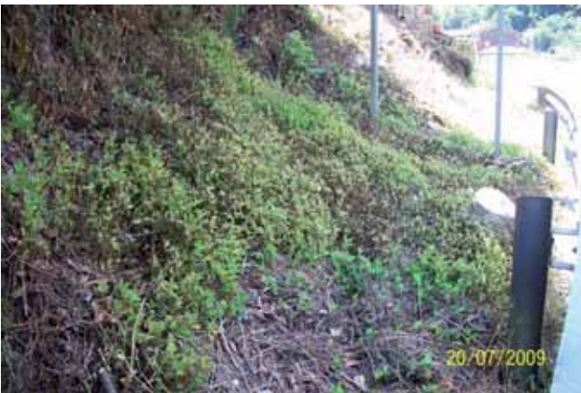
Foto 121: detalle de la Tradescantia fluminensis antes de su fumigación N-625 pk 147.