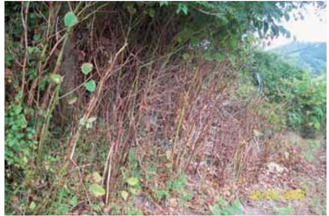
Foto 97: un mes después de la aplicación del herbicida, la mayoría de las hojas se habían marchitado y caído, aunque persistían algunas verdes por lo que fue necesario un segundo tratamiento.