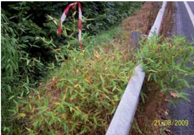
Foto 93: Phyllostachys aurea fumigado el 28 de julio 2009. Un mes después sólo algunas de sus hojas presentaban amarilleamiento. N-625 pk 150.

En algunos individuos se observó que, un mes después del primer tratamiento, sus hojas habían sólo amarilleado ligeramente pero sin llegar a caerse. Por lo que se decidió aplicar un segundo tratamiento. Para otros, con una sola aplicación fue suficiente para que perdieran todas sus hojas.