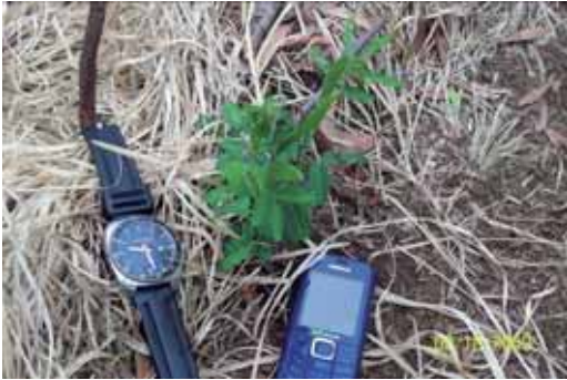
Foto 40: individuo de pequeño tamaño encontrado tras el primer tratamiento químico.