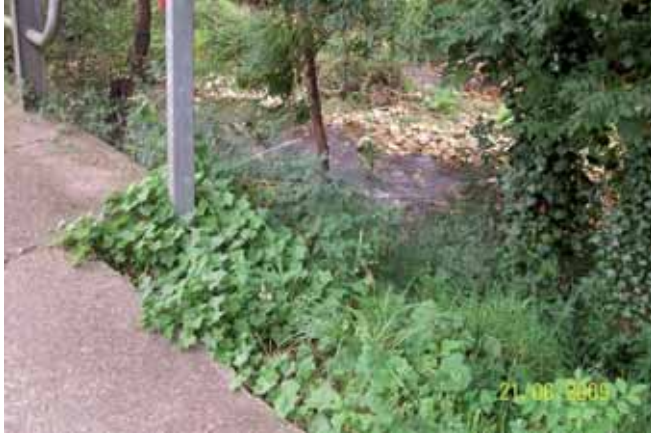
Foto 127: Senecio mikanioides creciendo en la ribera fluvial. As 262 pk 0. Soto de Cangas. T.M. Cangas de Onís.