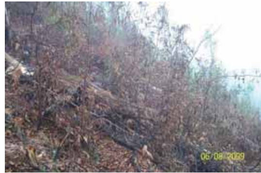
Foto 33: efecto de la zona fumigada un mes después de su tratamiento.