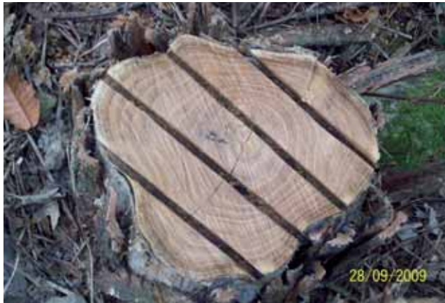
Foto 116: tocón de Robinia pincelado el 20-08-09. Un mes después del tratamiento, no se apreciaba rebrote alguno. Pozo el Bollu T.M. Cangas de Onís N-625 pk 151.