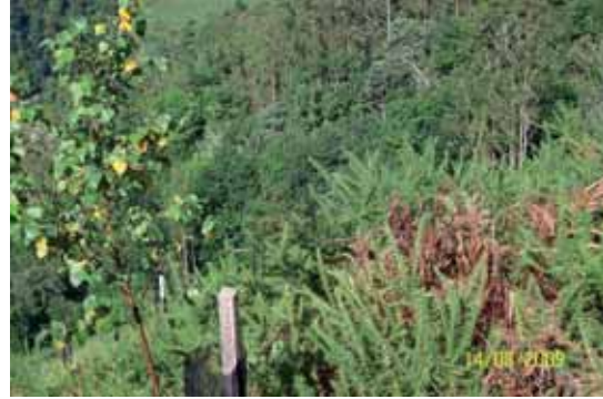
Foto 50: a la izquierda se observa un Abedul replantado, a la derecha una mata marchita de Acacia negra..

Ha de tenerse en cuenta que el glifosato no afecta a las semillas de Acacia melanoxylon y estas seguirán germinando, por lo que se hace imprescindible realizar un seguimiento y control de la zona tratada, y cuando se observe la aparición de nuevos plantones, éstos deberían ser fumigarlos de inmediato para evitar una nueva recolonización de la zona por esta especie. Las semillas de Acacia negra tienen una viabilidad que puede alcanzar los 50 años, además si ocurriese un incendio, éste puede estimular su germinación; estas características han de tenerse presente si se quiere lograr la erradicación completa de la Acacia melanoxylon .