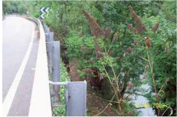
Foto 61 : un mes después del tratamiento, el individuo había perdido todas sus hojas.