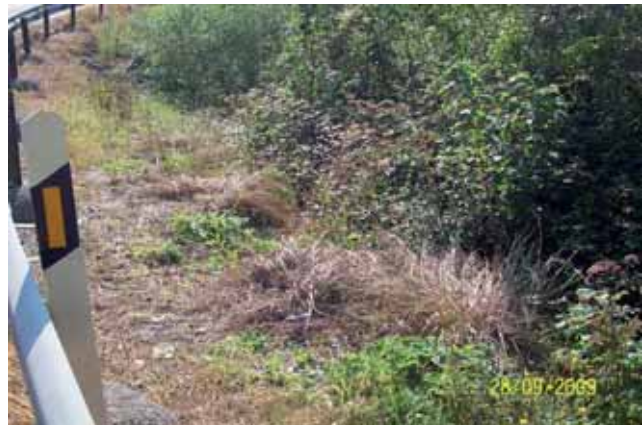
Foto 75: Cortaderia seollana fumigada al borde de la carretera. Buelles. T.M. Peñamellera Baja. N-621 pK 181.

Debido a que esta especie produce gran cantidad de semillas, es necesario hacer un seguimiento de las zonas tratadas (donde con toda probabilidad existirá un remanente de éstas en el suelo), y si germinasen, se debería fumigar de inmediato, para impedir así que estos individuos lleguen a la edad adulta, y de este modo, evitar la floración.