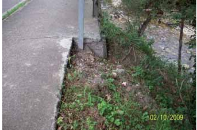
Foto 128: dos meses después del primer tratamiento, la mayor parte de el Senecio había desaparecido.