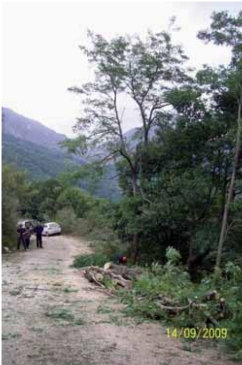
Foto 108: a los bordes de la pista forestal de Pido. T. M Camaleño, se encontraron varios núcleos de Robinia pseudoacacia . Las de mayor envergadura tenían una altura aproximada de 14 metros.

Los resultados del tratamiento físico también han sido muy favorables, ya que en la fecha de finalización de este proyecto no se había detectado rebrote alguno. De todas formas, resulta prematuro hacer una valoración definitiva de estas actuaciones, ya que se necesita un seguimiento de las zonas tratadas, durante un tiempo, para llegar a una conclusión definitiva sobre la eficacia del pincelado de los tocones. En el caso de que se detecten tocones rebrotados, se debería fumigar de inmediato para lograr que estos no prosperen.