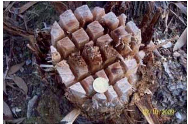
Foto 45: detalle de tocón un mes después de ser talado y pincelado.