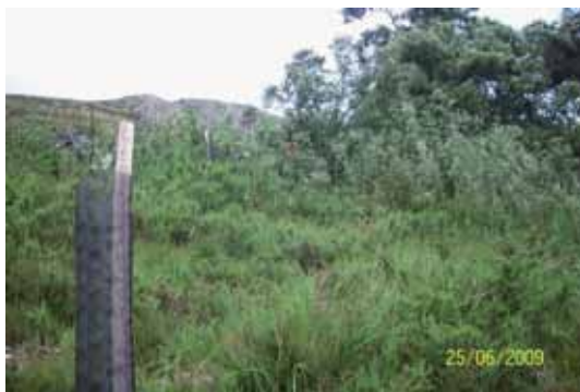
Foto 23: en primer término se observa una estaca de repoblación de especies autóctonas y al fondo a la derecha se ve la masa boscosa de Acacia melanoxylon .

Todos los individuos tratados en este proyecto, se encontraban localizados en Cuesta Ginés, Covadonga, en el Término Municipal de Cangas de Onís. Este árbol invadía una superficie aproximada de unos 3000 m 2 y se encontraba amenazando a una repoblación de árboles autóctonos (Roble, Serval, Acebo y Abedul) plantados en los inviernos 2005/2006 y 2006/2007.