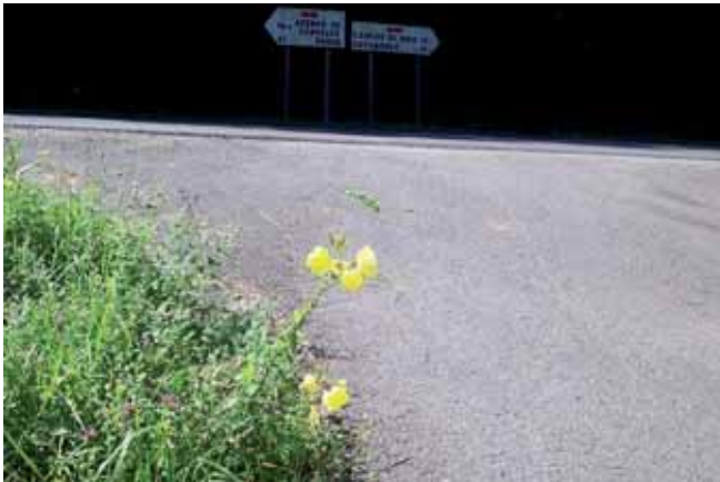
Foto 88: Oenothera glazoviana crece en el borde de la carretera. As 114, pk 13. Ería de Rozada. T. M. Onís