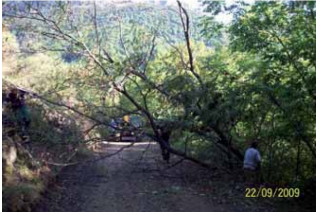
Foto 114: derribo de una Robinia de gran porte. Pido. T.M. Camaleño.