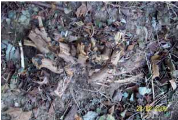
Foto 65: tucón de Buddleja situado en la carretera N-625 pk 151. Se pinceló el 28 de Julio, dos meses después no presentaba ningún rebrote.