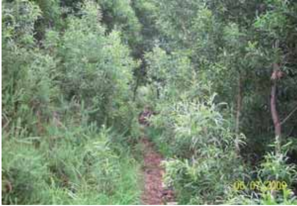
Foto 21: la Acacia melanoxylon formaba un bosque monoespecífico con una extensión de 3000 m 2 en Cuesta Ginés Covadonga.