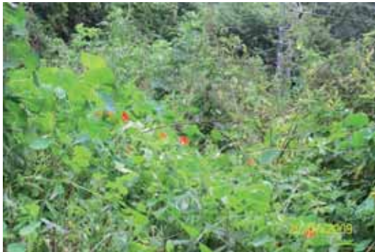
Foto 128: Tropaolum majus antes de ser fumigado. Cáraves. T.M Peñamellera Baja.

Se trataron dos rodales, uno en Cáraves, Término Municipal de Peñamellera Baja y el otro en El Pozu el Bollu (N-624 pk 151), Término Municipal de Cangas de Onís. Como la planta crecía en una zona donde había escombros y residuos vegetales se aplicó un tratamiento al 3% de Roundup. Un mes después del tratamiento, la mayor parte de la extensión de la planta se encontraba muerta; aunque se observó que, en determinadas zonas, los tallos brotaron de nuevo. Una dificultad para la erradicación de esta especie estriba en que al crecer en forma de enredadera, si durante la aplicación del herbicida, algunas de sus hojas y tallos podrían quedar ocultos por la vegetación acompañante, y posteriormente podrían recolonizar el espacio que previamente ocupaban, por lo que para la erradicación de los rodales de esta especie, se debe controlar si existe un crecimiento posterior en las zonas fumigadas, y si éste ocurriese se debe aplicar algún tratamiento más.