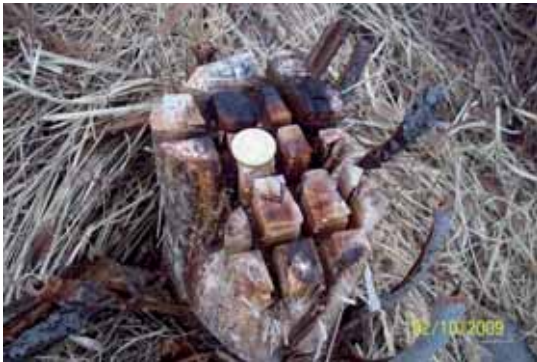
Foto 46: hasta la finalización del presente proyecto, no se había detectado ningún rebrote en los individuos cortados y pincelados.