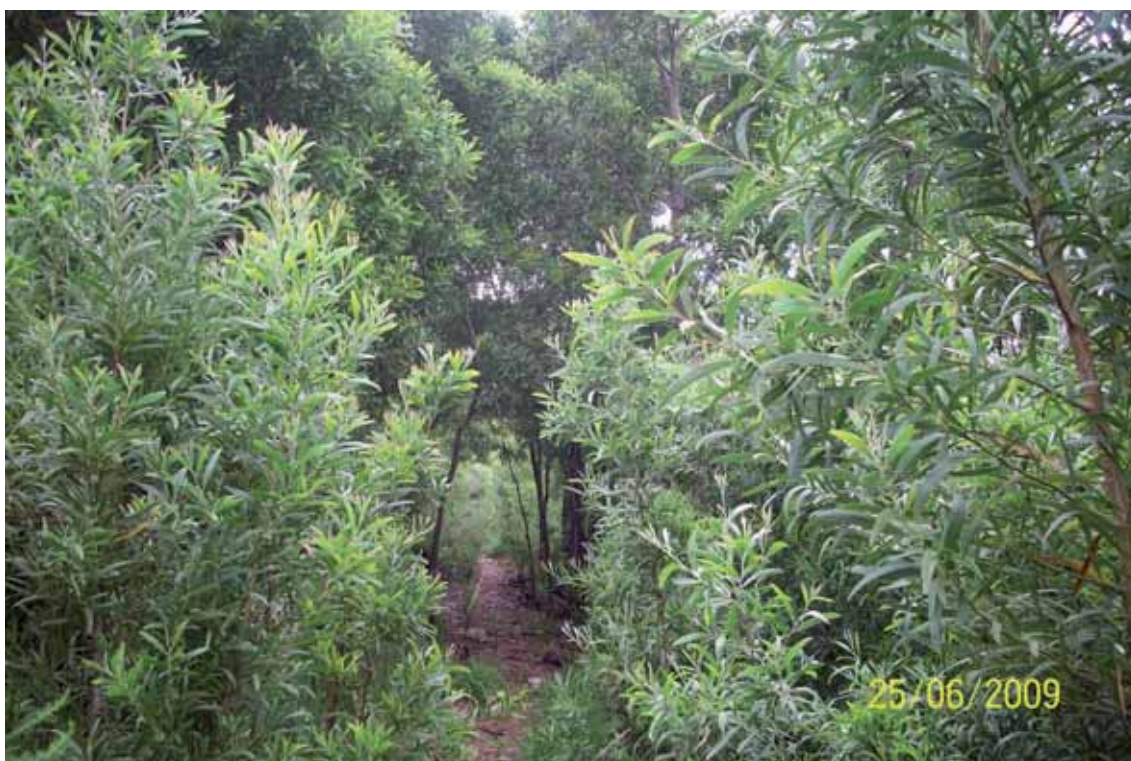
Foto 1: Acacia melanoxylon en cuesta Ginés: Covadonga. T.M. Cangas de Onís.

Su nombre común es Acacia Negra, es originaria de Oceanía. Árbol introducido en España con fines ornamentales y forestales. Biotipo: Mesofanerófito perennifolio. Sus hojas son perennes, alcanza una altura de hasta 40 cm. La corteza es pardo oscura y agrietada, sus ramillas son, a veces, muy pilosas. Las hojas, de 4 a 13 cm de largo y 0,7 a 2,5 cm de ancho, son elípticas o lanceoladas, más o menos curvas y falciformes, y con 3 a 5 nervios longitudinales. Florece a finales de invierno y primavera. Las flores se encuentran en inflorescencias globosas de color crema o blanquecino y de cerca de 1 cm de diámetro, y nacen solitarias o en racimos en las axilas de las hojas. Los frutos son legumbres muy aplastadas y retorcidas, de hasta 12 cm de largo por 1 de ancho, y de tonalidad pardo-