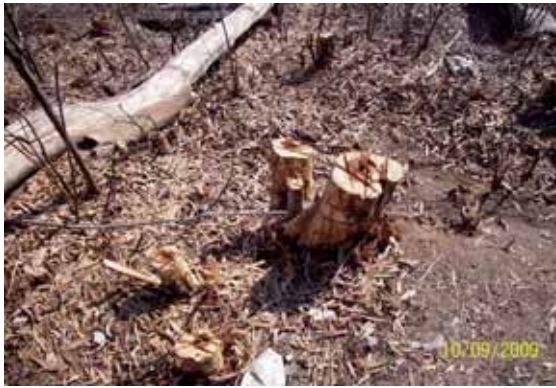
Foto 44: tocones pincelados dos meses después de su tratamiento no mostraban rebrote alguno.

El tratamiento físico y posterior pincelado, igualmente se considera satisfactorio, ya que no se ha producido ningún rebrote. De todas formas, para comprobar si este tratamiento ha sido eficaz, habría que hacer un seguimiento de los tocones, y si se detectase algún rebrote proceder de inmediato a su fumigación.