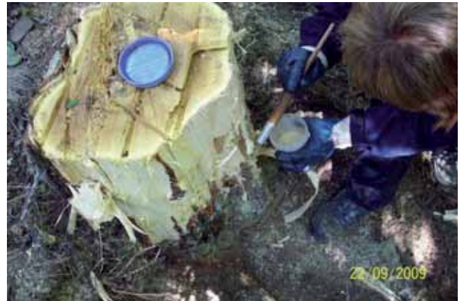
Foto 113: por último, se aplica sobre el tocón una mezcla al 50% de Roundup y gasoil.