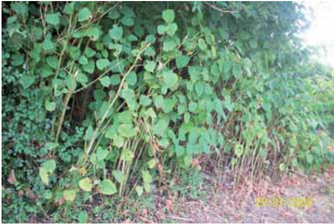
Foto 96: Reynoutria japonica antes de la aplicación del primer tratamiento. Llonín. T.M. de Peñamellera Alta.