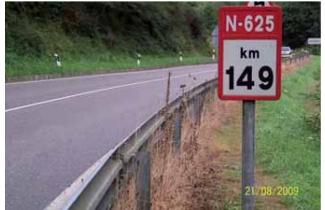
Foto 85: un mes después, la planta se encontraba totalmente muerta.