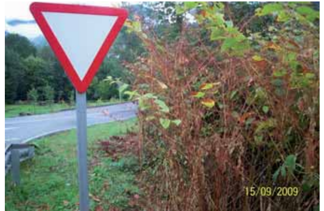
Foto 102: un mes después del primer tratamiento, la mayor parte de las hojas se habían marchitado y caído, no obstante algunas de ellas estaban verdes.