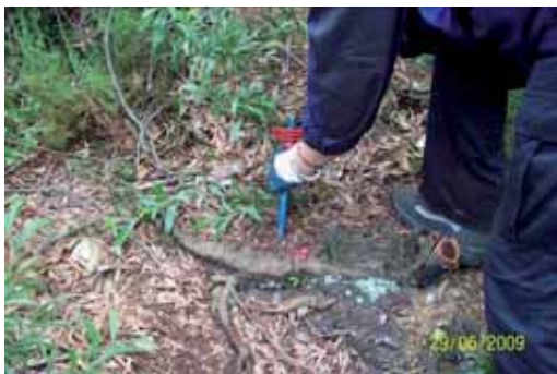
Foto 27: tratamiento físico: utilización de un punzón para hacer heridas en el tocón