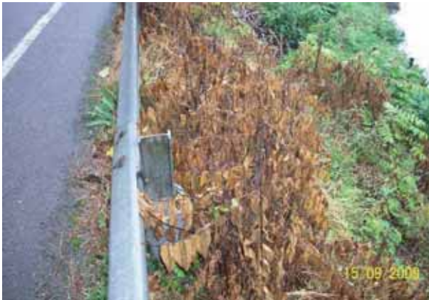
Foto 56: Ailantos fumigados en Corao. T.M. Cangas de Onís. As 114 pk 7.