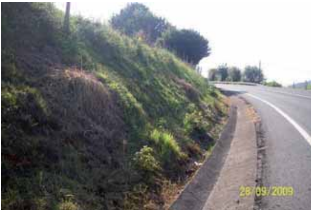
Foto 74: Cortaderia seollana fumigada al borde de la carretera. Buelles. T.M. Peñamellera Baja. N-621 pK 181.