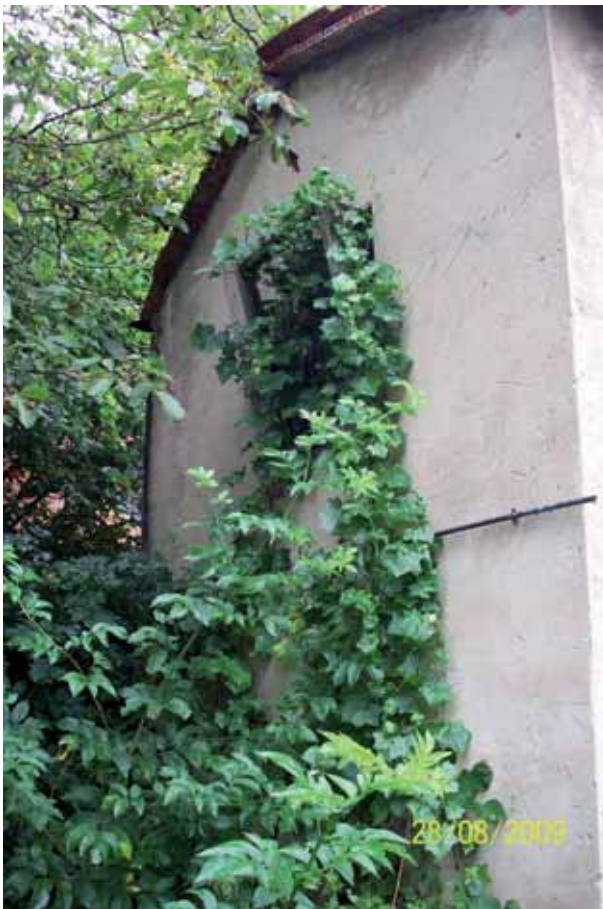
Foto 123: Senecio mikanioides creciendo a modo de enredadera. Canales T.M. Cabrales.

Un mes después de su fumigación, se pudo observar que las hojas y tallos en contacto con el herbicida se marchitaron y murieron. Esta especie es crece densamente, en forma de enredadera, y algunas de sus hojas pueden quedar ocultas a la hora de la aplicación del herbicida, por lo que se hace necesario la realización de varios tratamientos para lograr su completa erradicación.