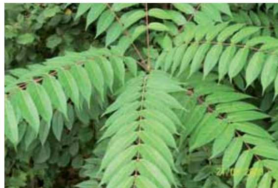
Foto 53: detalle de uno de los Ailantos antes del tratamiento químico.