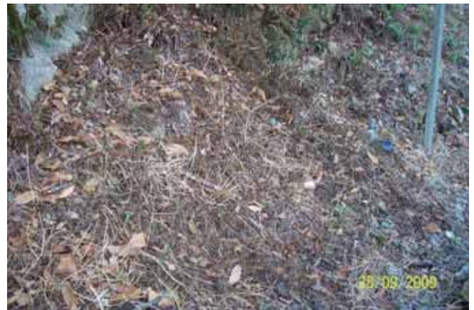
Foto 122: con una sola aplicación, el resultado después de dos meses fue bastante satisfactorio. N-625 pk 147.