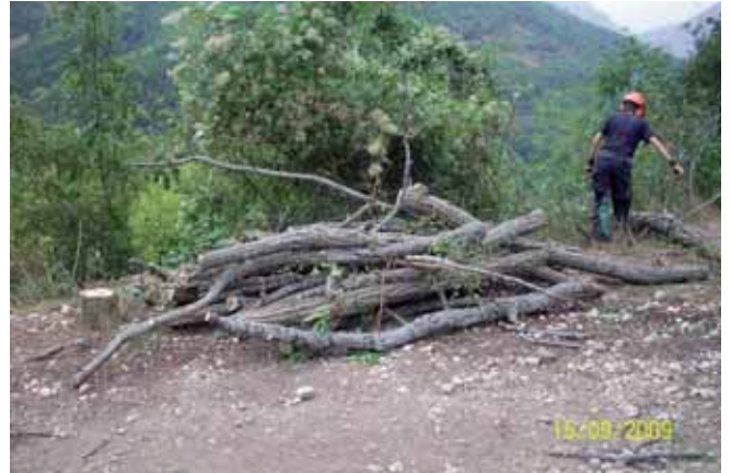
Foto 115: los troncos resultantes fueron aprovechados por los vecinos del pueblo de Pido para su uso personal.