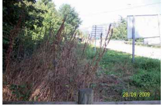
Foto 87: un mes después de la aplicación del herbicida, todos los individuos se encontraban muertos.