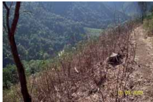
Foto 35: zona de fumigación dos meses después del primer tratamiento, la mayoría de los individuos tratados habían perdido todas sus hojas.

Dos meses después de la primera aplicación del herbicida, aproximadamente un 10% de los árboles tratados presentaban todavía alguna hoja verde, y en alguno de estos individuos, se pudo observar un crecimiento de hojas nuevas brotando de la parte basal de su tronco. A sí mismo, también fueron localizadas plántulas germinadas a partir de semillas, así como individuos que no fueron vistos durante la aplicación del herbicida en el primer pase; por lo tanto, fue necesario realizar un segundo tratamiento con herbicida.