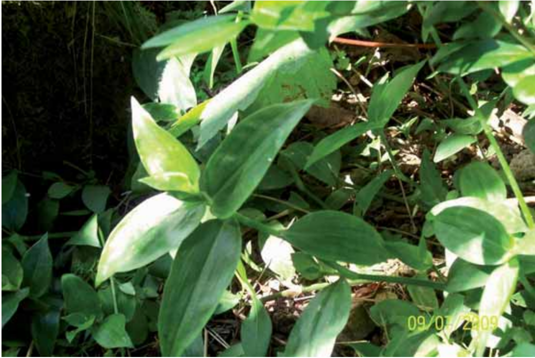
Foto 11: Tradescantia fluminensis . La Llongar. T.M. Cangas de Onís.

Especie, originaria de las pluvisilvas de América del Sur, conocida como Amor de Hombre o Oreja de Gato. Su biotipo es neófito rizomatoso. Es una planta herbácea perenne, reptante, rizomatosa que llega a alcanzar los 50 cm de altura, con tallos ramificados y enraizantes en nudos. Las hojas, de hasta 4 cm de largo por 1 de ancho, son enteras, de borde ciliado, alternas, ovado-lanceoladas, carnosas y lustrosas. Tanto la vaina como la base de las hojas son pilosas. Normalmente poseen color verde oscuro, pudiendo presentar tonos púrpúreos en el envés. La floración tiene lugar de marzo a septiembre. Las flores, que aparecen dispuestas en inflorescencias cimosas terminales, presentan tres pétalos de coloración blanquecina y numerosas pilosidades blancas acompañando a los estambres. Su fruto está constituido por una cápsula trilobulada que contiene semillas de color negro. Se propaga por semillas y de forma vegetativa por medio del enraizamiento de los nudos cualinares.