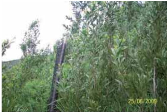
Foto 32: zona de crecimiento de Acacias de pequeño tamaño antes del tratamiento químico con Roundup.

El tratamiento químico de los árboles de pequeño tamaño ha dado muy buen resultado, consiguiéndose la muerte de una gran parte de los individuos fumigados.