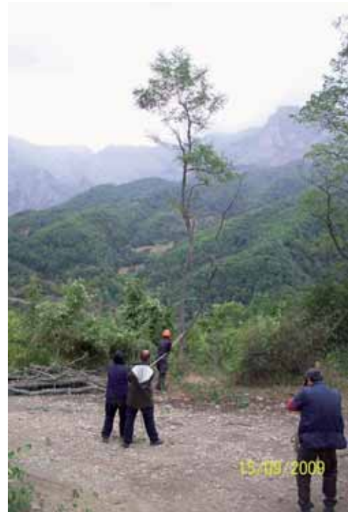
Foto 109: para talar las de mayor envergadura se realizo con al ayuda de un trácter y cuerdas. Pido. T.M Camaleño..