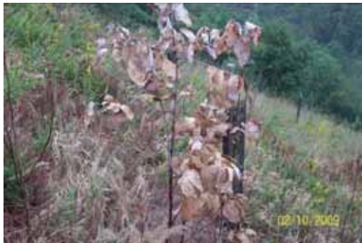
Foto 78: con una única fumigación se logro la muerte de todos los Eucaliptos.