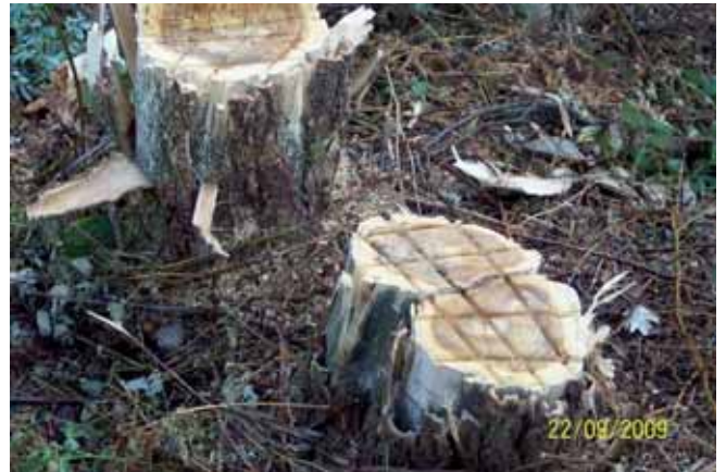
Foto 117: tocones de Robina pincelados el 01-09-09. Pido. T.M. de Camaleño