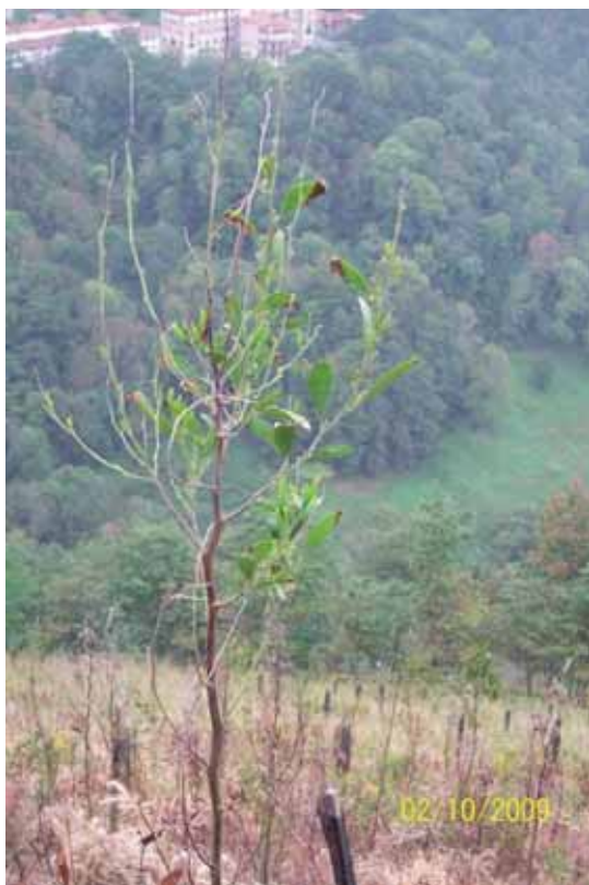
Foto 38: individuo de Acacia negra que presentaba algunas hojas verdes, después del primer tratamiento químico.

La primera aplicación de fitocida sobre la Acacia malanoxylon tuvo lugar los días: 09-07-09, 09-07-09, 10-07-09, 24-07-09, 29-08-09. Posteriormente, el 2-08-09 se realizó un segundo tratamiento de repaso.