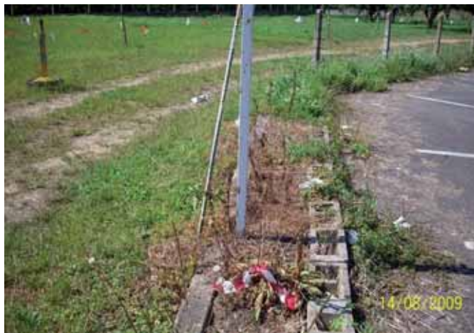
Foto 81: un mes después la planta se encontraba totalmente muerta.