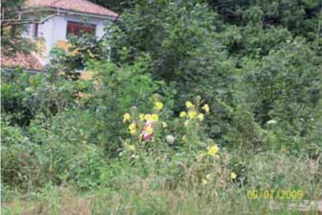
Foto 82: Oneothena antes de ser fumigada. El Barréu. T.M. Cangas de Onís.