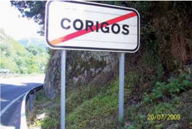
Foto 119: Tradescantia fluminensis creciendo debajo de la señalización N-625 pk 147.