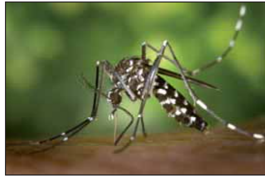
Figura 7: Mosquito tigre ( Aedes albopictus ).

Las invasiones biológicas conjuntamente con el cambio climático pueden implicar la inmigración de especies no deseadas como son los patógenos o las enfermedades. Las enfermedades infecciosas de transmisión vectorial son altamente susceptibles a una combinación de factores climáticos y ecológicos por la cantidad de componentes que existen en el ciclo de transmisión, así como su interacción con el ambiente externo. Si el cambio climático afecta a uno o más componentes en el ciclo de transmisión, podría suceder que estas enfermedades viesen incrementada su área de distribución.