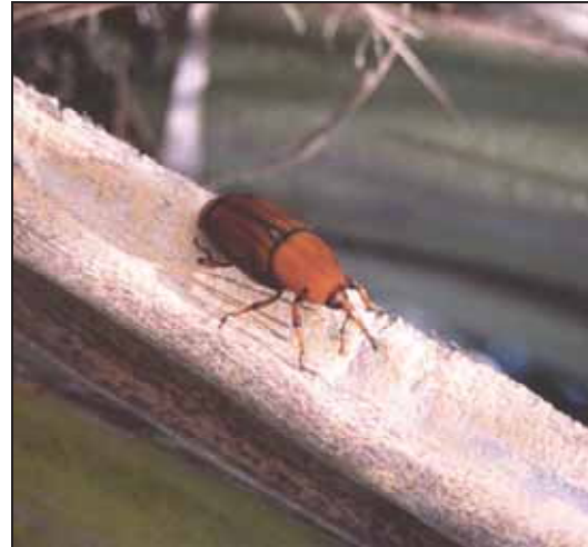
Figura 3. Picudo rojo de las palmeras ( Rhynchophorus ferrugineus ).

Los insectos están fuertemente influenciados por el clima, por lo tanto, se espera que los cambios climáticos predichos tomen parte en la expansión/contracción de sus áreas de distribución. Las respuestas de los insectos al cambio climático serán complejas y diversas, dependiendo de su ciclo vital y de la estrategia de crecimiento planta-huésped. No obstante, hay indicios consistentes de que especies con alimentación generalista, cosmopolitas, multivoltinas, con elevada plasticidad fenotípica, podrían verse favorecidas por el cambio climático, pudiendo representar un riesgo en el futuro.