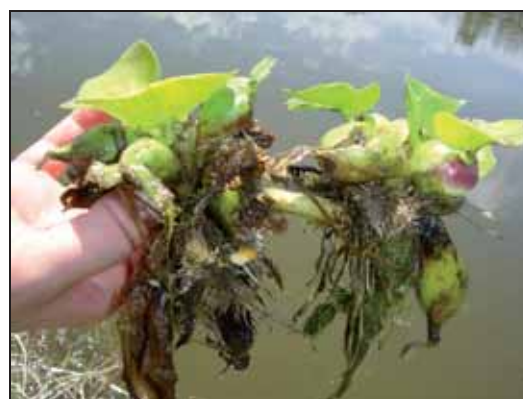
Figura 8. Jacinto de agua ( Eichhornia crassipes ).

Prevenir la introducción de aquellas especies que puedan beneficiarse del cambio climático y predecir su distribución gestionando cuidadosamente la conectividad del medio para minimizar su dispersión hacia nuevas áreas, es posiblemente la mejor opción de gestión.