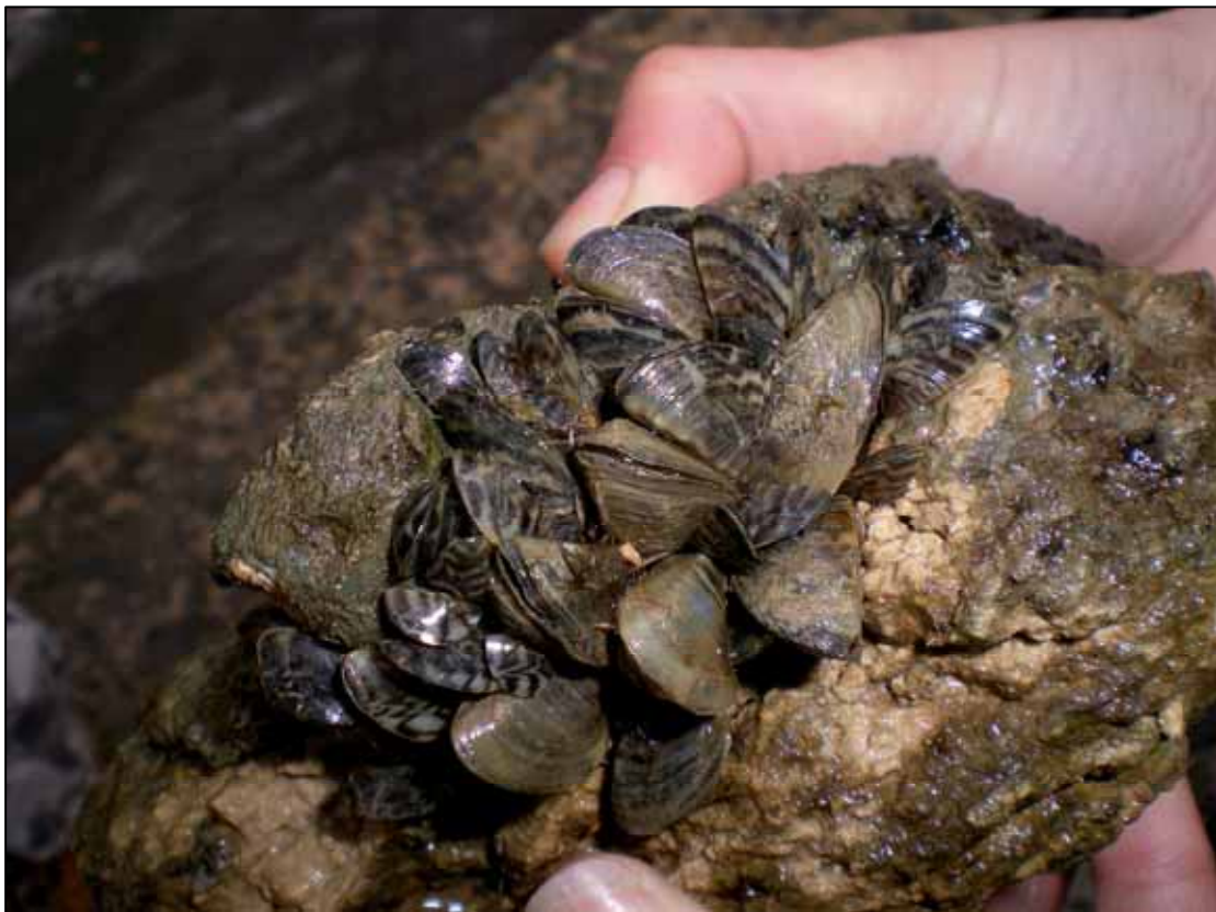
Figura 10. Mejillón cebra ( Dreissena polymorpha ).

Tanto los criterios propuestos como el propio listado, susceptible de modificaciones y/o actualizaciones por su carácter no definitivo, deberán ser revisados por un equipo formado por expertos en cambio climático e invasiones biológicas a fin de garantizar una correcta interpretación de los parámetros climáticos cambiantes y de los requerimientos ecológicos de las especies. Asimismo, de cara a la gestión de las EEI, se considera imprescindible incorporar en los sistemas de análisis datos relativos a factores antrópicos y a la estructura del espacio que puedan influir en el proceso de invasión.