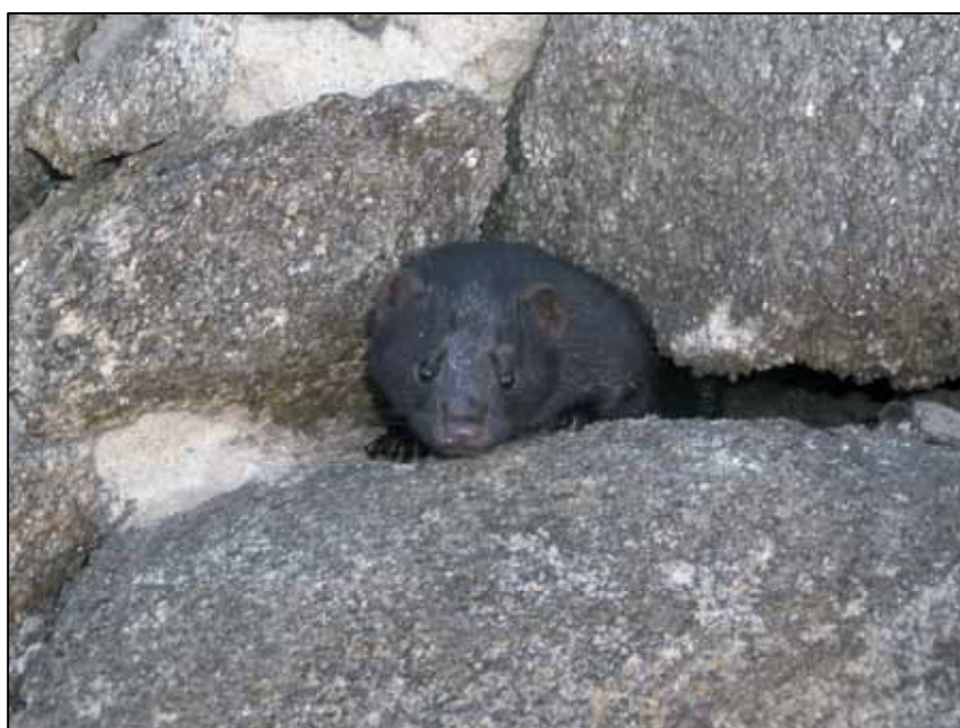
Figura 9. Visón americano ( Neovison vison ).

Es preciso construir un sistema de información que deberá, además, complementarse con la información procedente de los sistemas de información geográfica (SIGs) para integrar aquellos factores de origen antrópico que también influyen en los procesos de invasión. La combinación e integración espacial de todos estos elementos podría aportar información útil tanto para la investigación como de cara a la gestión de EEI, permitiendo determinar las áreas con alto riesgo de invasión, y coadyuvar en la adopción de planes de gestión.