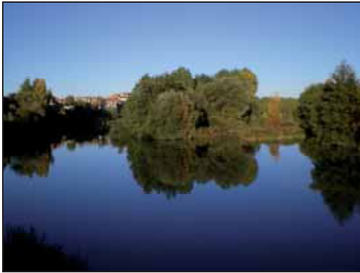
Figura 5. Río Duero.

Los ecosistemas acuáticos continentales resultarán profundamente afectados por el cambio en el clima. Es previsible que la subida de las temperaturas per se y sus efectos indirectos, los cambios en los regímenes de precipitaciones y consecuentemente en los caudales, en las corrientes y la salinidad y/o el aumento en la frecuencia de eventos extremos, provoquen cambios sustanciales en la fenología y distribución de las especies así como en la productividad de los ecosistemas, abriendo el paso a las invasiones biológicas.