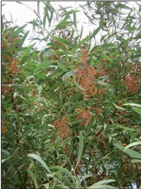
Figura 2. Acacia negra ( Acacia melanoxylon ).

El cambio climático podría afectar a la dinámica de las invasiones de plantas de dos maneras diferentes: