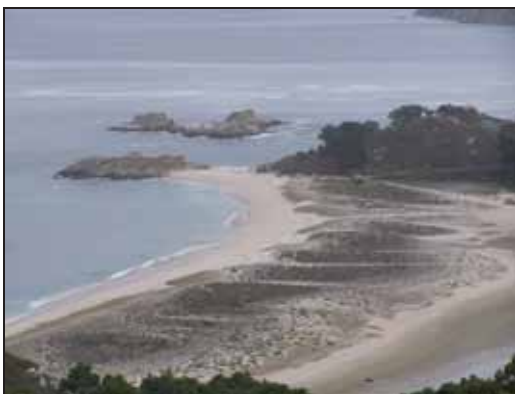
Figura 6. Playa de Rodas (Islas Cíes).

Las emisiones de gases de efecto invernadero (principalmente el CO 2 ), junto con el aumento de la temperatura media global, y la disminución de la salinidad, darán lugar a una cascada de cambios en los ecosistemas marinos afectando a muchas