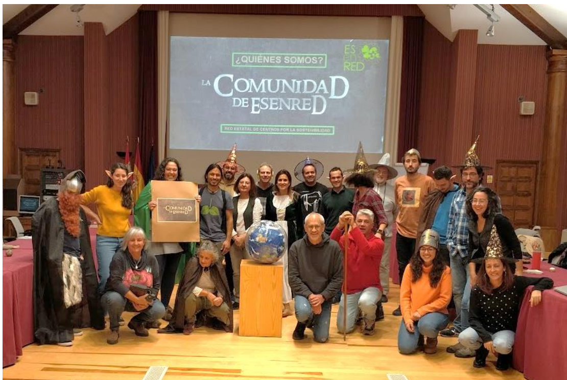
Nos vemos en el Seminario de ESenRED 2023.

A partir de aquí, cada quien sacará sus propias conclusiones.