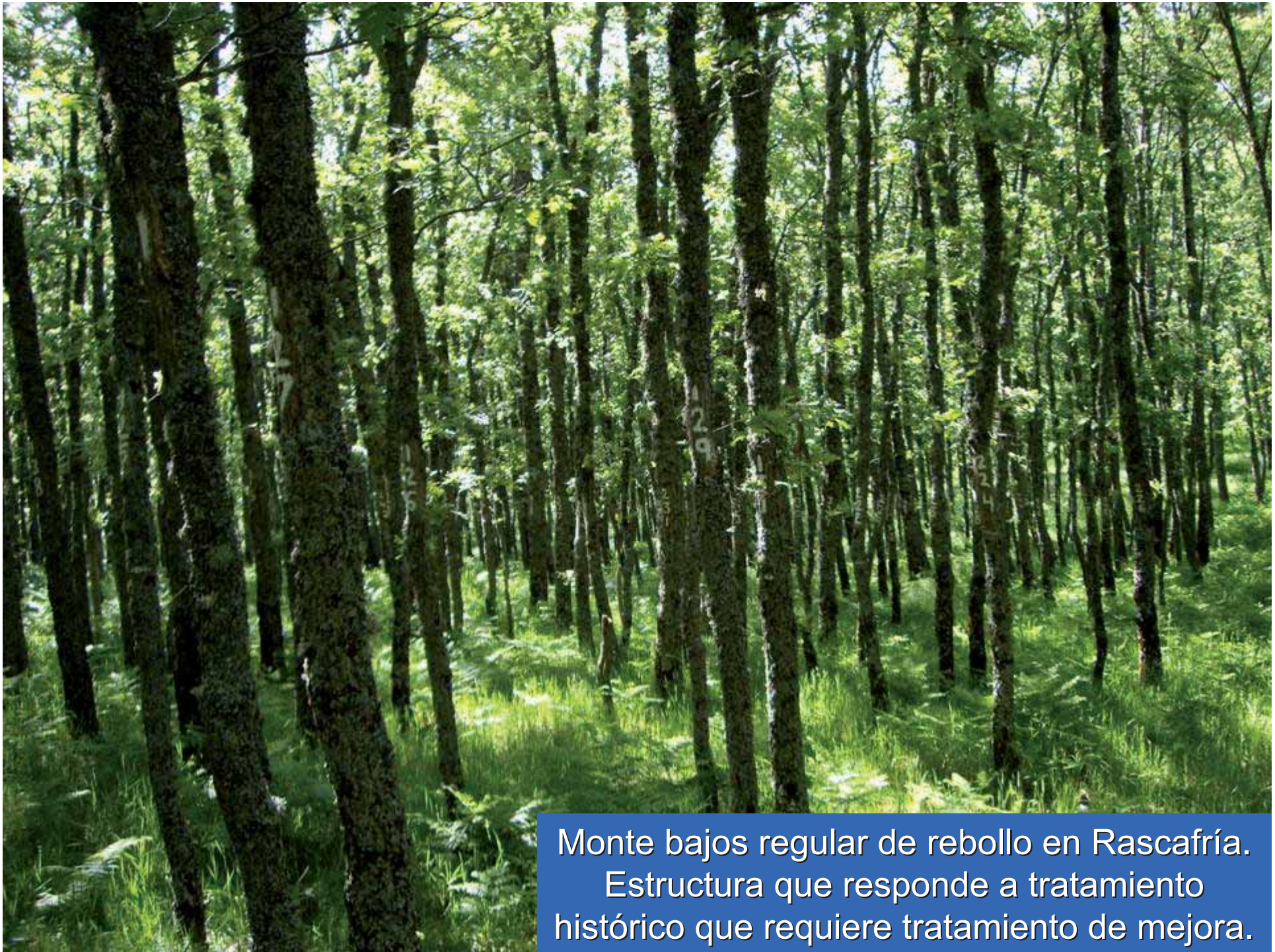
Monte bajos regular de rebollo en Rascafría. Estructura que responde a tratamiento histórico que requiere tratamiento de mejora.