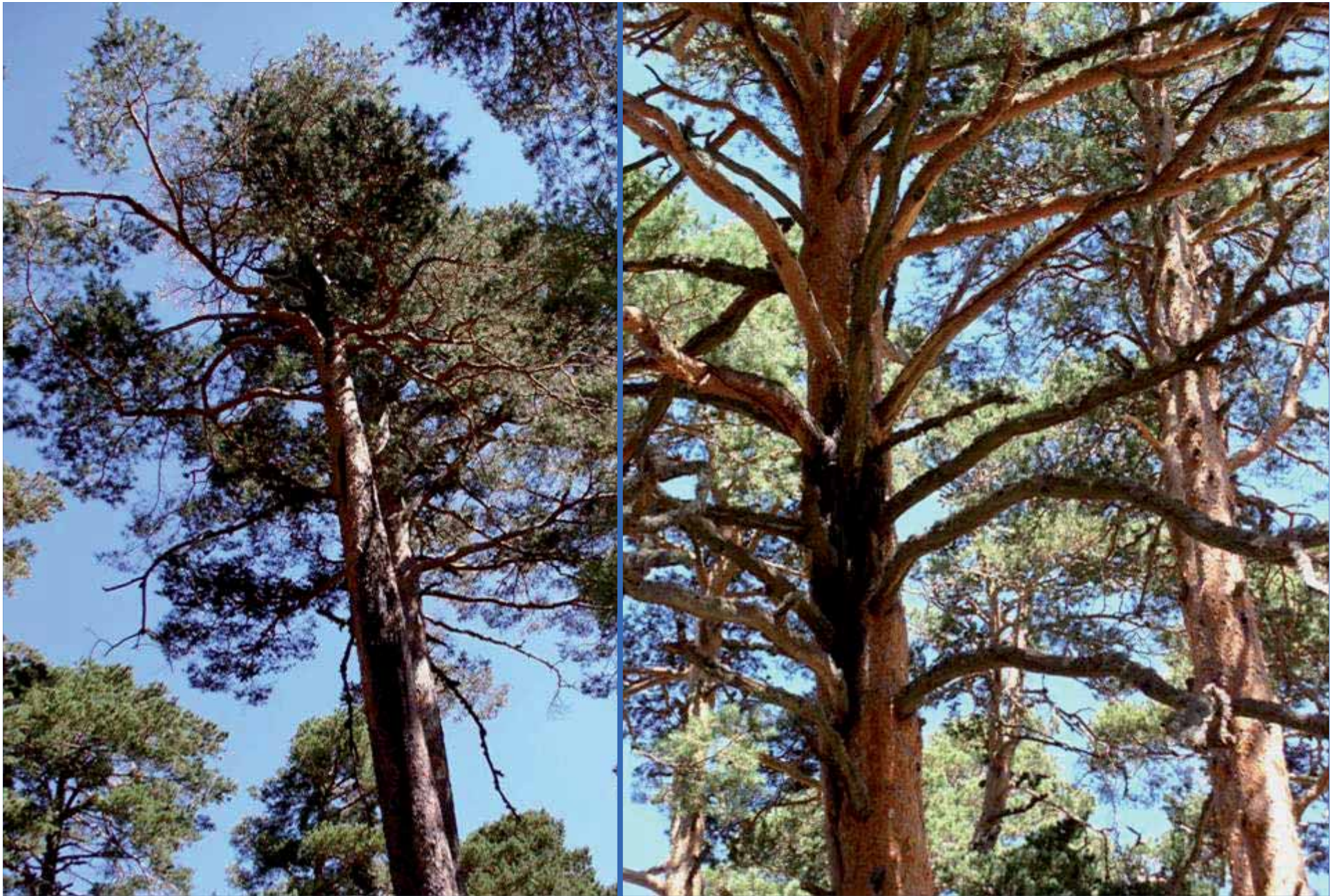
Parasitismo de hongos: Cronartium flacidum var. corticola , chancro en pino silvestre. Extracción sistemática de pies afectados.