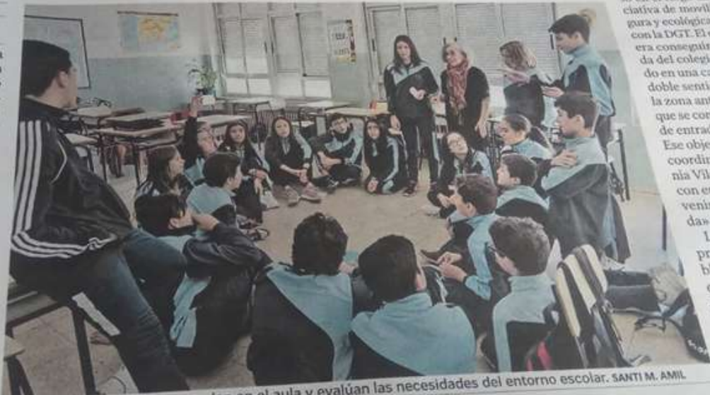
Alumnos de 2º de ESO aprenden en el aula y evalúan las necesidades del entorno escolar.