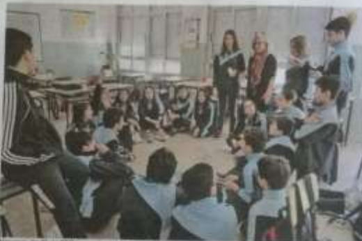
A finales de 2º de ESO aprenden en el aula y practican los fundamentos del tráfico rodado, según sus datos.