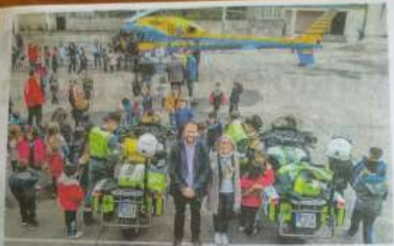
Los alumnos pudieron presenciar el aterrizaje del helicóptero. Lucía