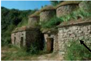
Tinas/ lagares. Patrimonio preindustrial