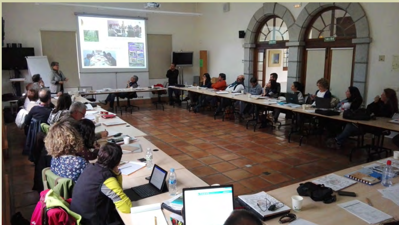
Participantes del seminario

D el 4 al 6 de mayo, en Valsain (Segovia), tuvo lugar el V Seminario Permanente de la CETS, con 39 participantes, la mayor parte de ellos representantes de espacios naturales protegidos adheridos a la Carta.