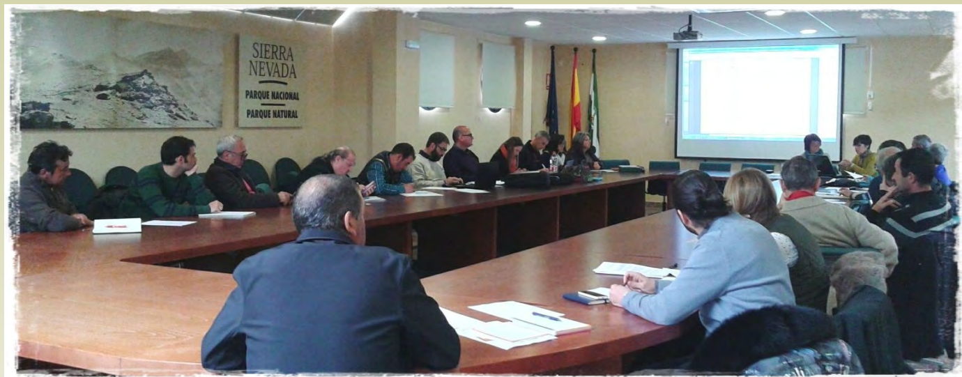
Participantes del Foro CETS Sierra Nevada

E l 16 de marzo, en el Centro Administrativo del Espacio Natural de Sierra Nevada, fue convocado el Foro CETS Sierra Nevada, con una asistencia de 28 entidades, entre públicas y privadas.