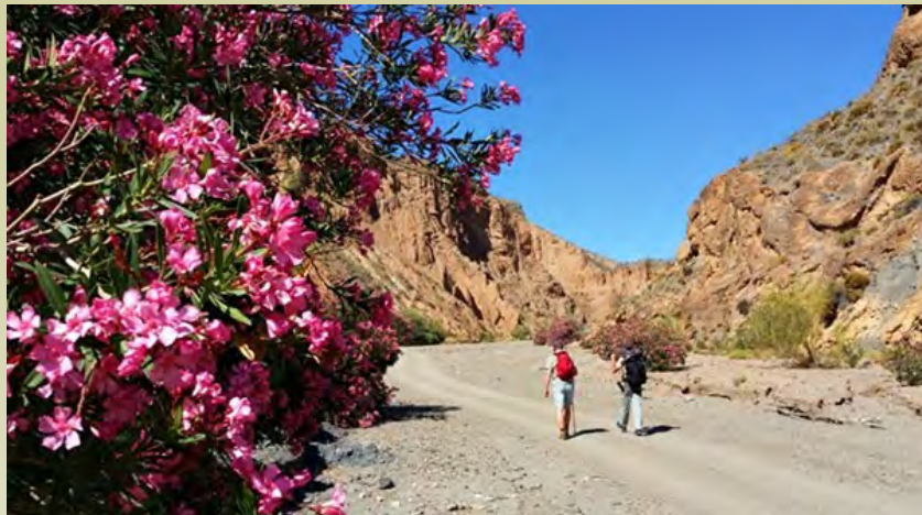
Rambla de los Yesos, en Alboloduy

El tercer día del presstrip fue una jornada intensa y llena de contrastes.. Empezaron en Alboloduy con un paseo por su Rambla de los Yesos, guiados por Al-Mihras Turismo Activo, con una breve pausa para un desayuno sano y típico con frutos secos de Las Torcas Alimentos ecológicos.