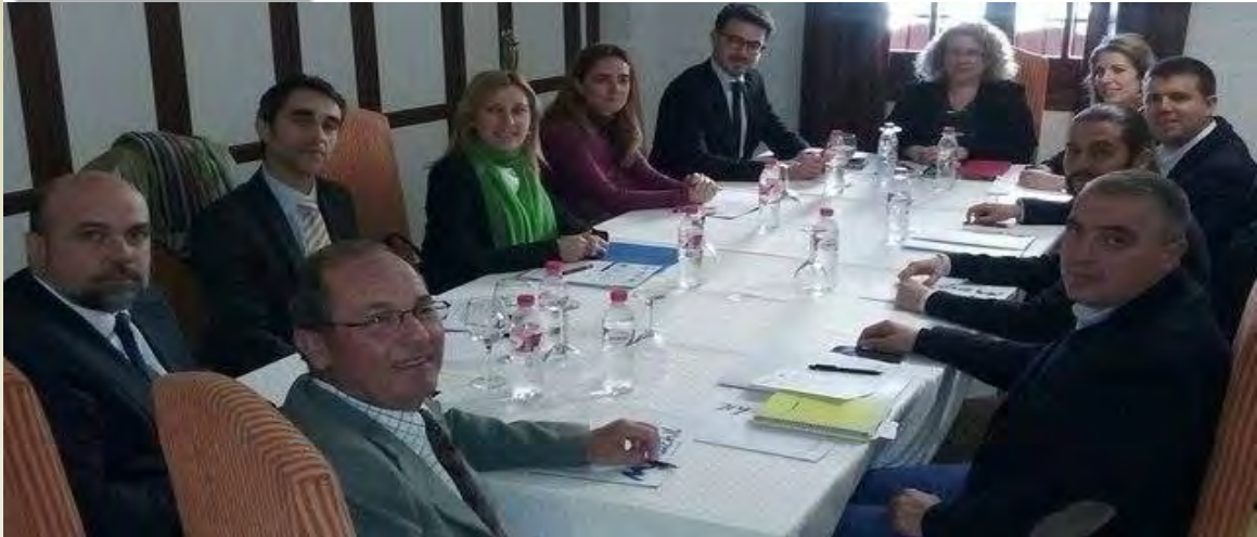
Representantes del sector turístico durante la constitución de la Mesa de Calidad Turística

E l Ayuntamiento de Monachil, en colaboración con la Consejería de Turismo y Deporte, ha puesto en marcha la estructura de gestión del Sistema Integral de Calidad Turística en Destino (SICTED). De este modo Monachil se compromete a velar por el desarrollo de la calidad y la competitividad de las empresas y servicios turísticos del destino MONACHIL-SIERRA NEVADA, ofreciendo un nivel de calidad homogéneo que permita incrementar la satisfacción de los turistas y fomentar la fidelización de los mismos.