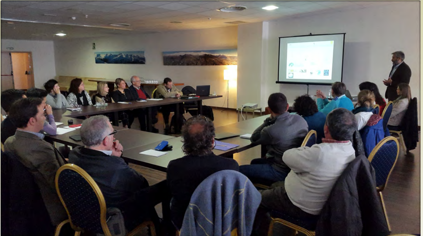
Participantes del curso

Los días 11 y 12 de abril, tuvo lugar en el Balneario de Lanjarón, las Jornadas “Destino Sierra Nevada” con Alfonso Polvorinos, fotógrafo de naturaleza y pionero en España sobre turismo activo, rural y de naturaleza y autor de numerosas guías de ecoturismo.