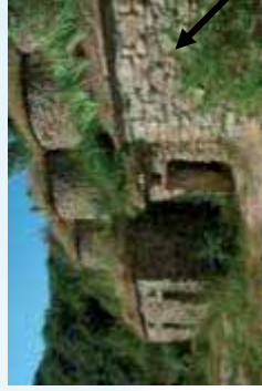
Tinas/ lagares. Patrimonio preindustrial