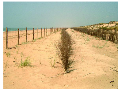
Foto 8.3.7. Incipiente captación de arena en primera fila.