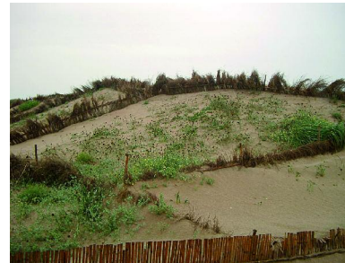
Foto 8.2.4. Detalle de la vegetación plantada entre los captadores.