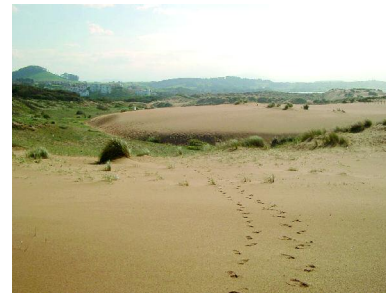
Foto 8.1.3. Transporte masivo de arena hacia el interior.