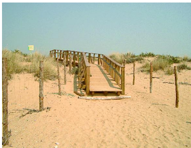
Foto 8.3.9. Detalle de pasarela sobre el cordón dunar.

En los tramos de costa sometidos a erosión marina, normalmente el efecto de los captadores es más lento que el propio avance del mar, por lo cual, es frecuente que los sistemas de captadores no sean lo suficientemente eficaces como para producir una elevación del terreno suficiente. Además, el establecimiento de la vegetación es mucho más lento y dificultoso, debido al ataque del oleaje.