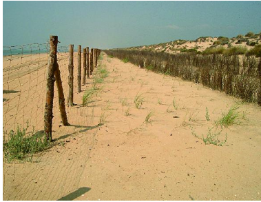
Foto 8.3.8. Detalle del establecimiento de la vegetación.