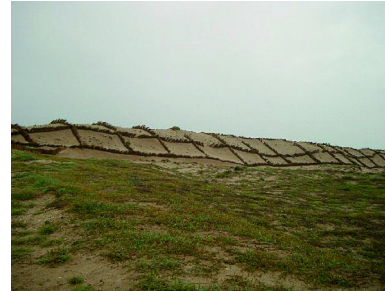
Foto 8.2.3. Aspecto del cordón dunar restaurado.

Durante varias etapas, se han ido restaurando las diferentes zonas, demoliendo el paseo marítimo y la mayor parte de los viales, pozos y