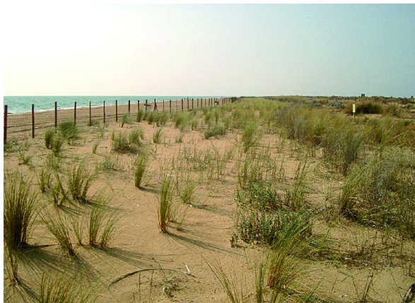
Foto 8.4.8. Aspecto del nuevo frente dunar con la vegetación establecida.

tener demasiados cambios el relieve y las pasarelas son utilizadas por la mayoría de los usuarios.