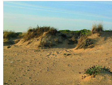
Foto 8.3.6. Detalle del frente erosionado.