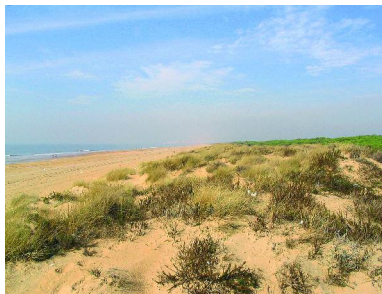
Foto 8.3.2. Aspecto general del cordón dunar de Los Enebrales.