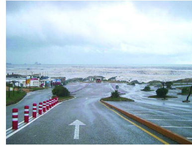
Foto 8.1.2. Temporal en Liencres.

No obstante, igual que en otros sistemas dunares en proceso de restauración, el crecimiento de la duna ha provocado el enterramiento de los cerramientos que se instalaron y con ello su pérdida de efectividad.