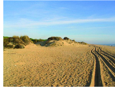
Foto 8.3.5. Detalle de la erosión del frente dunar.

La restauración del frente dunar de un tramo en acreción tiene un comportamiento muy diferente al de un tramo en erosión. En el primer caso, cuando los elementos de regeneración (captadores fundamentalmente) comienzan a producir sus efectos, se aprecia una elevación del terreno en las zonas donde se deposita la arena, con lo cual el riesgo de inundación del pie de la duna por ataque de temporales disminuye. Por otro lado, este efecto se incrementa cuando la vegetación comienza a arraigar y a ejercer su efecto de construcción de dunas.