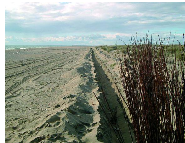
Foto 8.4.4. Apertura de la zanja para la instalación de los captadores.

Un poco más hacia el interior, donde la influencia marina es algo menor, se forma otra banda paralela, la duna embrionaria, de muy escasa altura y anchura, compuesta por la grama marina ( Elymus farctus ) y Sporobolus pungens . Tras ella, aparece un arenal con apenas relieve dominado por el barrón ( Ammophila arenaria ), la algodonosa ( Otanthus maritimus ), el cardo marino ( Eryngium maritimum ) etc.