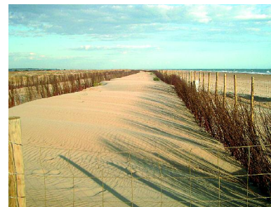
Foto 8.4.7. Otro detalle de la captación.