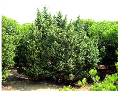
Foto 8.3.3. Enebro costero ( Juniperus oxycedrus subsp macrocarpa ).