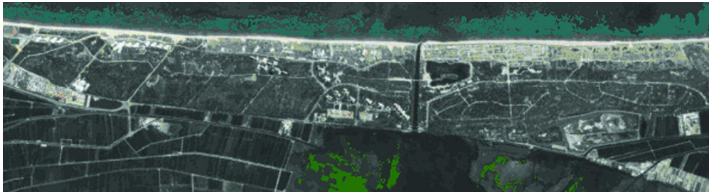
Foto 8.2.1. Sector costero restaurado.

El proyecto de restauración se desarrolla a lo largo del tramo central de la barra que cierra la albufera de Valencia, en la denominada Devesa de El Saler, y en todo el tramo situado hacia el sur, incluyendo las playas de El Saler, Els Ferros-Garrofera, la Brava, la Malladeta y El Canyar, de norte a sur, hasta el campo de golf de El Saler, en una longitud total de unos 7 km.