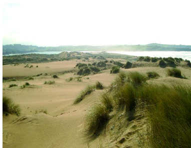
Foto 8.1.5. Aspecto general del arenal.