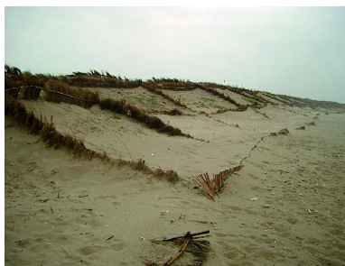
Foto 8.2.6. Captación en la duna embrionaria.

La restauración de las dunas de El Saler constituye uno de los primeros y mejor desarrollados ejemplos de este tipo de actividades en España. Además de por los aspectos urbanísticos, de desmontar una urbanización que estaba destruyendo todo un importante sistema dunar, humedal trasdunar y bosque mediterráneo, por los aspectos técnicos propios de la restauración, tales como las reconstrucciones topográficas, las labores de reintroducción de la vegetación y las de comunicación ciudadana.