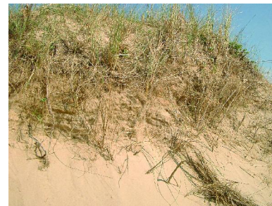
Foto 8.1.4. Detalle de fenómenos erosivos en el frente dunar.