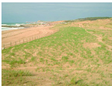
Foto 8.1.7. Resultado de la revegetación del frente dunar.