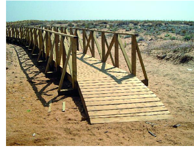
Foto 8.4.5. Pasarelas de acceso a la playa.

La vegetación plantada está bien establecida y la colonización natural recubre y enriquece de especies las parcelas protegidas con cerramientos. Éstos permanecen estables, no sufren enterramientos ni descalzamientos, al no