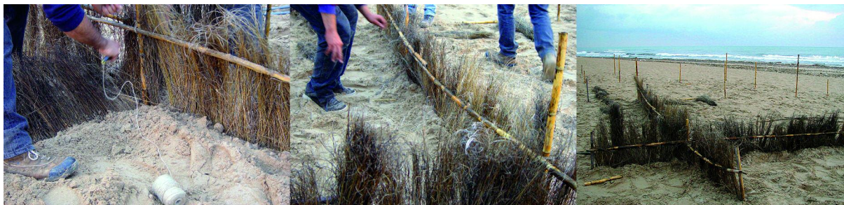
Foto 8.2.2. Proceso de montaje de los captadores de Spartina .

Además, se ensayaron distintos métodos de reintroducción de la vegetación dunar y de tratamientos para mejorar la fertilidad y estabilidad, como colchones bituminosos, con turba, con estiércol, con restos de posidonia, etc., llegando a la conclusión de que era mejor no utilizar nada, pues, si bien la colonización natural era más lenta, se obtuvo una mayor biodiversidad.