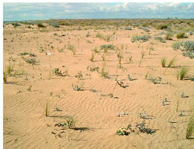
Foto 8.4.3. Detalle de la vegetación del frente dunar.