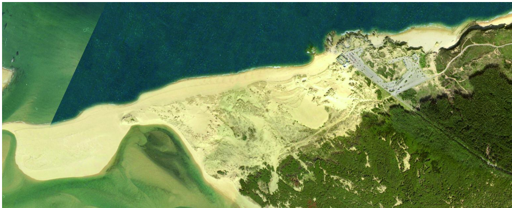
Foto 8.1.1. Vista aérea de la zona de estudio.

El material sedimentario proviene del aporte del río Pas y que las corrientes y el oleaje devuelven a su desembocadura formando una flecha que progresa cerrando el estuario con dirección oeste. Su composición es básicamente calcárea. El extremo occidental está sujeto a una gran dinámica y cuando concurren avenidas fluviales y temporales marinos se producen situaciones muy destructivas, llegando a la desaparición total de la punta. Cuando las condiciones se estabilizan comienza otra vez el proceso constructivo de aporte de arena por el oleaje y la colonización de la vegetación.