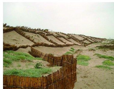
Foto 8.2.8. Cierres realizados con cañizos.

Por otro lado, es un ejemplo en la coordinación entre las distintas administraciones que tienen competencias en este territorio, sin la cual, cualquier proyecto de esta envergadura no habría sido posible.