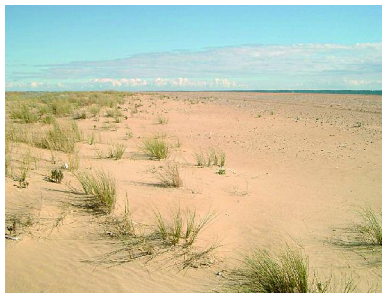
Foto 8.4.2. Aspecto del perfil dunar antes de las obras.

mando las características bandas de vegetación de este tipo de ecosistemas. La vegetación de playa alta, donde la incidencia de la influencia marina es mayor y donde se acumulan restos orgánicos que el mar expulsa, está compuesta mayoritariamente por especies anuales de verano como la oruga de mar ( Cakile maritima ), barrilla pinchosa ( Salsola kali ), polígono marino ( Polygonum maritimum ), etc.