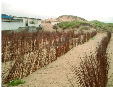
Foto 8.1.6. Filas de captadores para regenerar la duna.