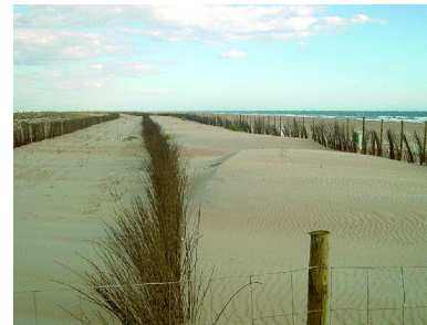
Foto 8.4.6. Detalle de la captación de arena en las primeras fases.