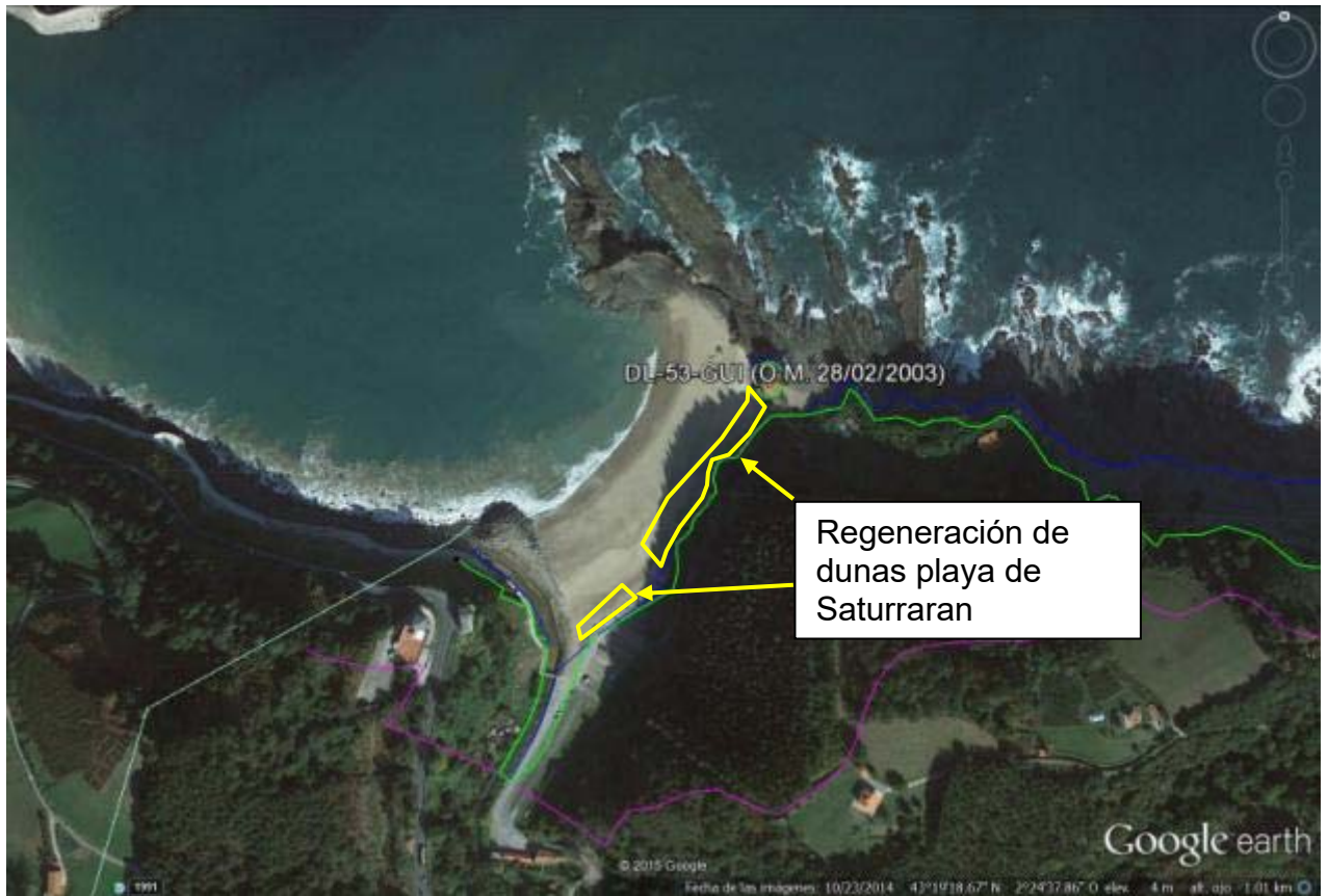
Foto aérea de la playa de Saturrarán y zona de actuación