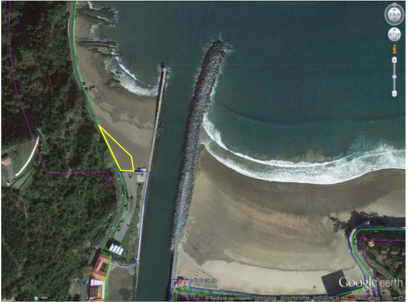
Playa de Ondarbeltz