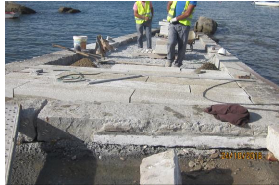
Durante la obra