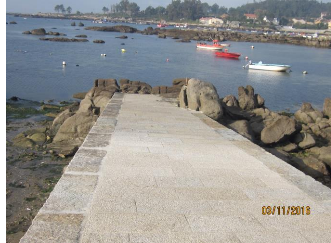
Después de la obra