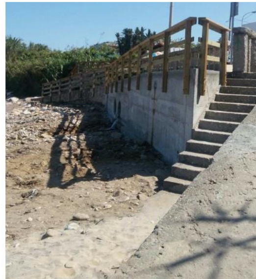
Después de la obra