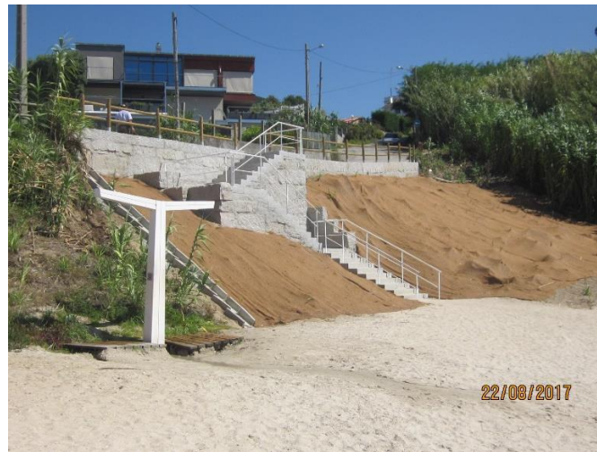
Después de la obra