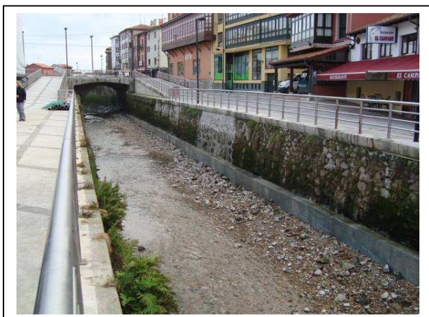
Después de la actuación