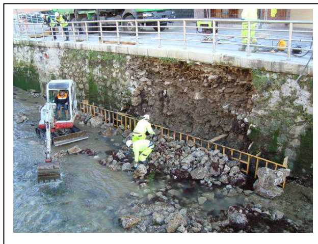
Durante la actuación