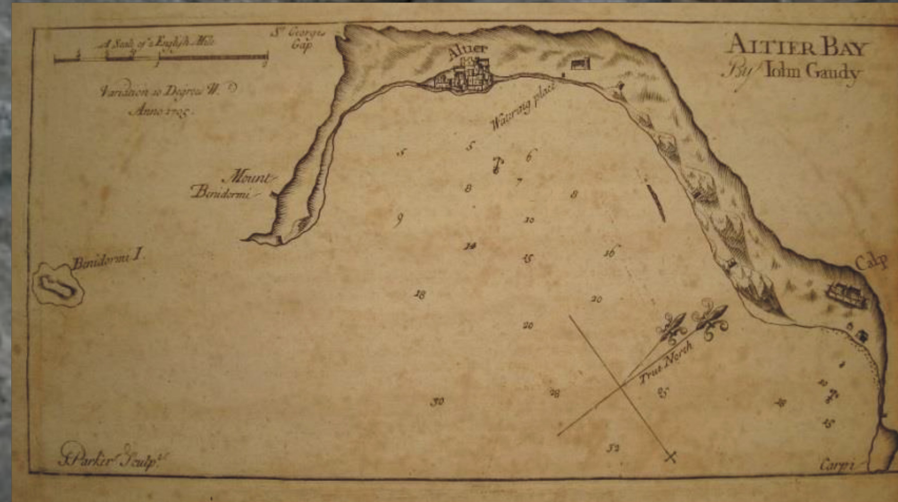
Bahía de Altea 1705

The structure belongs to the coastal defensive system created in the first half of the 16th century by the Spanish Crown for the defense of the coastal front against corsair ships from Algiers, Tunisia or Genoa. This system, of medieval origin, was managed and maintained by the Coast Guard, an institution that organized the territory into areas called 'requerimientos'. The tower of Caletes was part of the requerimiento of La Vila Joiosa.