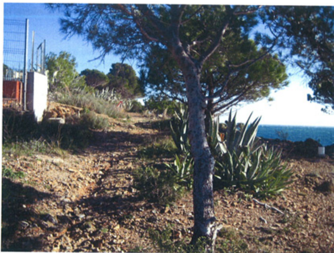
F2-LADO MUROS EXISTENTES