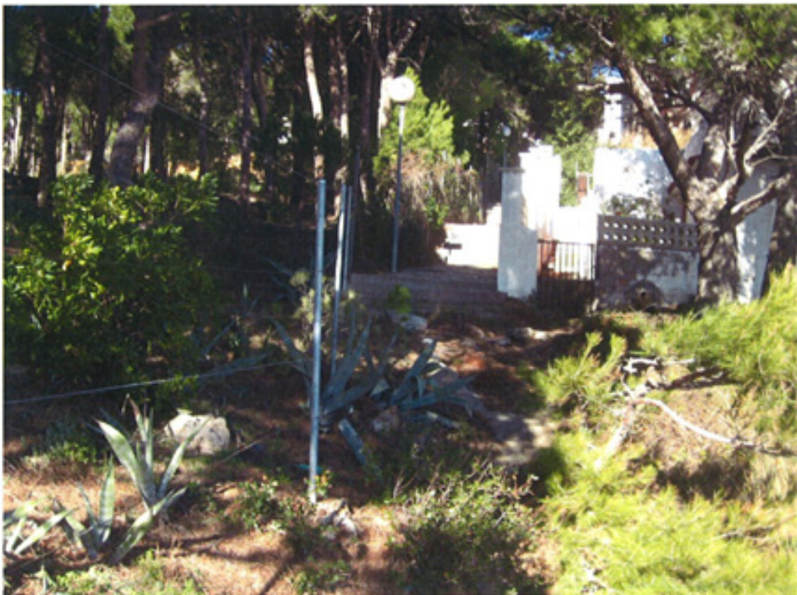
F5-CONEXIÓN CON ESCALERA ACCESO CTRA.