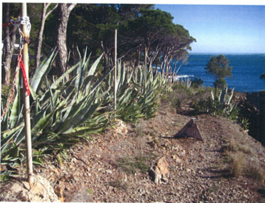
F3- ZONA PELIGROSA DE DESPRENDIMIENTOS