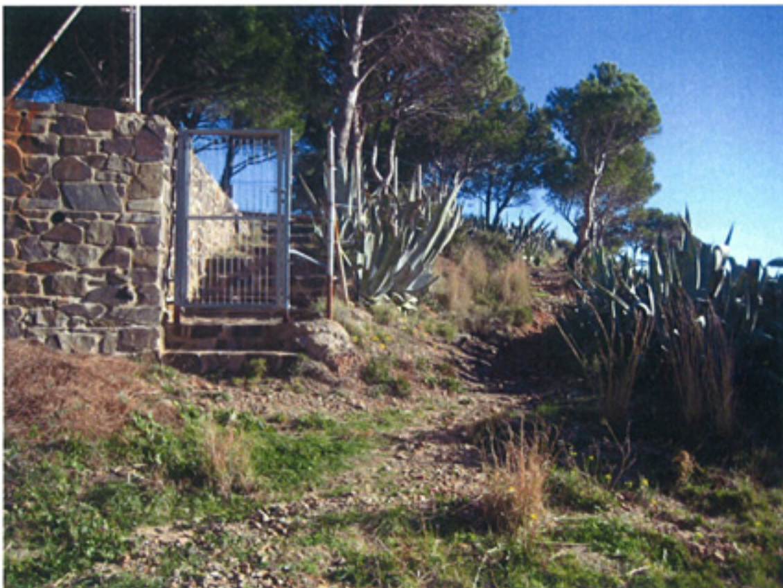
F1-INICIO CAMINO RONDA

Desbroce y retirada de vegetación alóctona, formación de pavimento a base de materiales granulares compactados, construcción de cerramiento del camino a base de murete y enrejado metálico, instalación de barandilla de madera, señalización y mobiliario urbano.