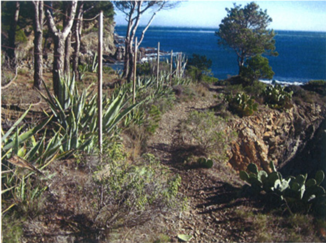
F4- ZONA ENLACE MIRADOR