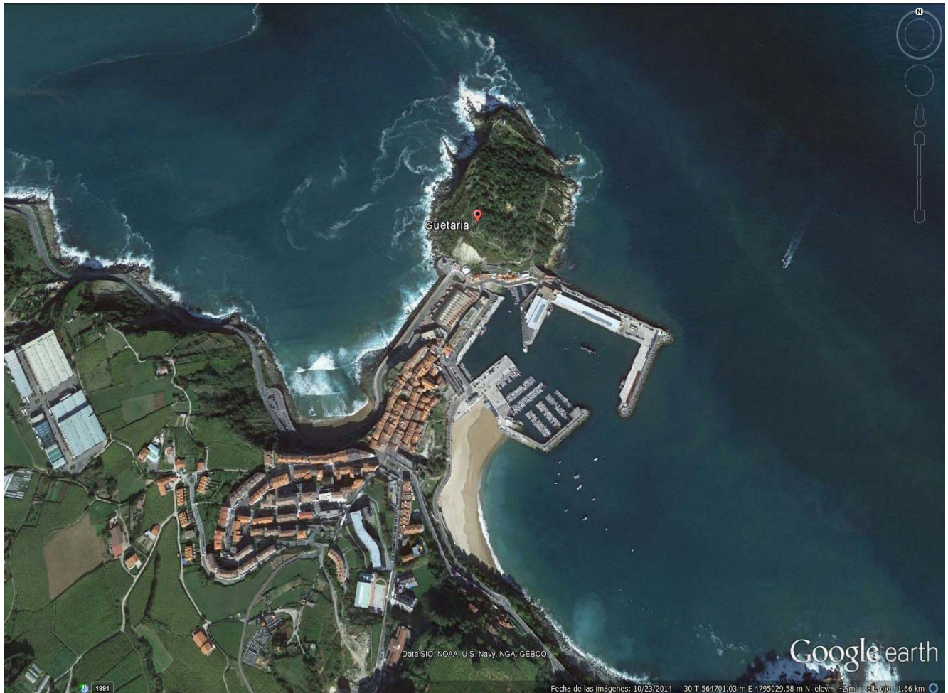
Foto aérea de la playa de Malkorbe y zona de actuación