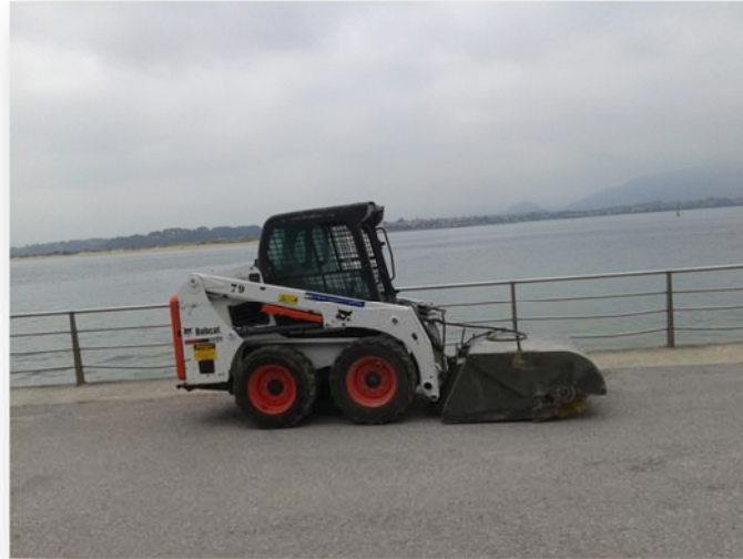
Fotografía nº7. Máquina barredora para trabajos de acondicionamiento