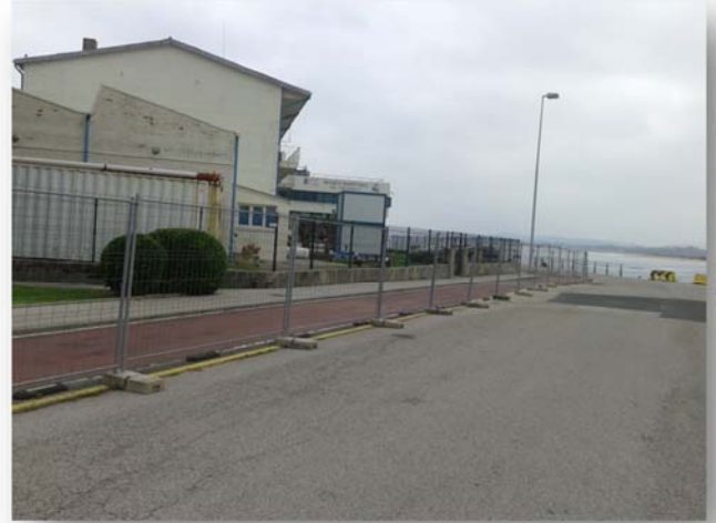
Fotografías n°3 y n°4. Vallado perimetral de la obra se mantiene