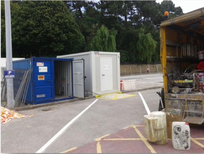
Fotografía nº1 Elementos auxiliares de obra aun en su lugar. Se están vaciando para su retirada en los próximos días.