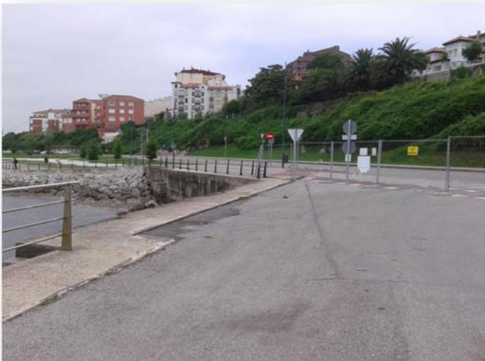
Fotografía nº2 se ha retirado la garita de entrada pero el vallado permanece