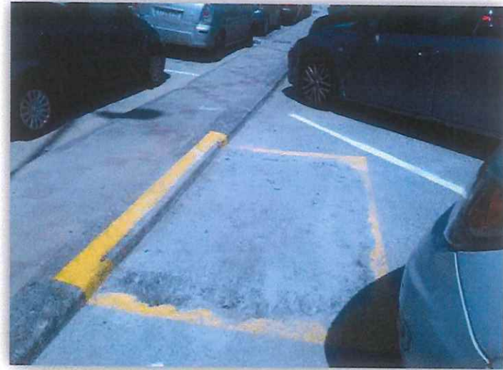
Fotografía n°6. Rampa de acceso a la caseta de obra retirada

Por todo lo expuesto se concluye que la zona del aparcamiento del Promontorio ha quedado según lo previsto sin ninguna incidencia reseñable. Se retomarán las tareas de seguimiento del Plan de Vigilancia Ambiental en el mes de octubre si no hay otras órdenes por parte de la Dirección de Obra.