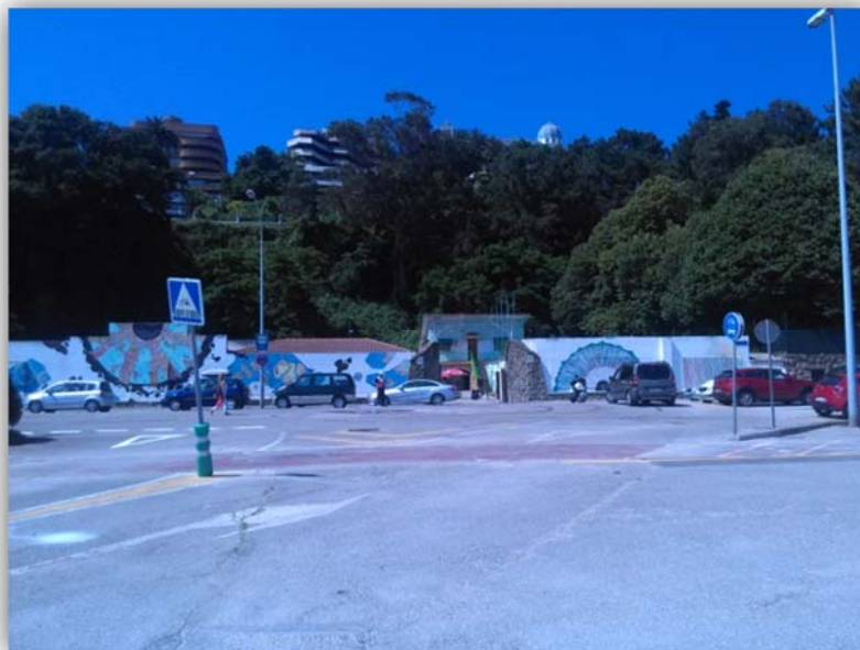
Fotografía n°4 Vellido retirado y tráfico restablecido

En relación a este punto se han retirado todas las vallas que cerraban el límite de obra y el tráfico se ha restablecido en toda la zona como se muestra en la fotografía n°4