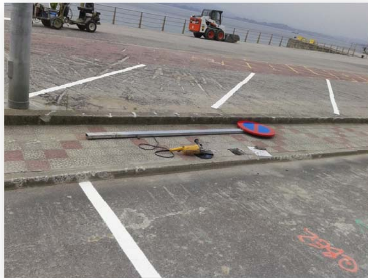
Fotografía nº8. Parte de la señalización horizontal realizada