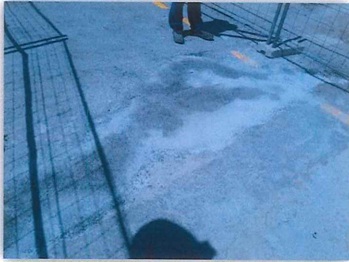
Fotografía n°5. Parche en el pavimento, zona carril bici