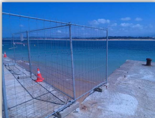
Fotografía nº2 Vallado de acopios en pavimento, zona tránsito de vehículos