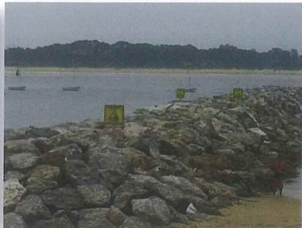
Fotografías nº9 y nº10. Señalización instalada en el espigón y zona aledaña

A fecha 22/06/2018 (16:00) se gira visita a obra y se comprueban los puntos abiertos, resultado de esta visita es el checklist que se adjunta como anexo 3 al presente informe.