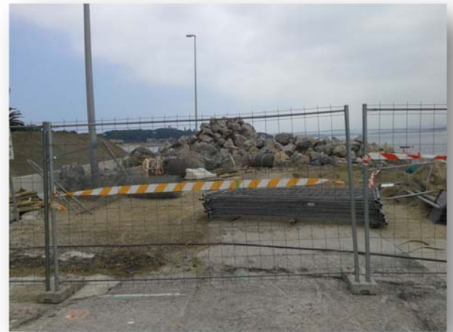
Fotografías n°5 y n°6. Se empieza a vallar el acopio en la zona aglomerada