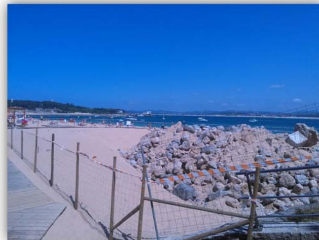
Fotografía nº3. Vallado de acopios en playa

Con la fotografía nº3 se ilustra también es grado de consecución de la pregunta nº24: medios de contención.