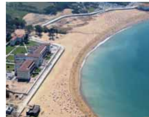
Después / Ondoren

INBERTSIOA: 10.073.532,03 euro (2010 urtea).