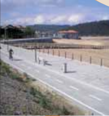
Paseo marítimo y acceso a la playa Itsasoko pasealekua eta hondartzarako sarbidea