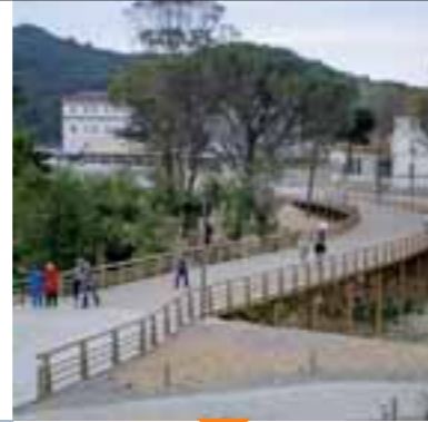
Pasarela de madera Egurrezko pasabidea