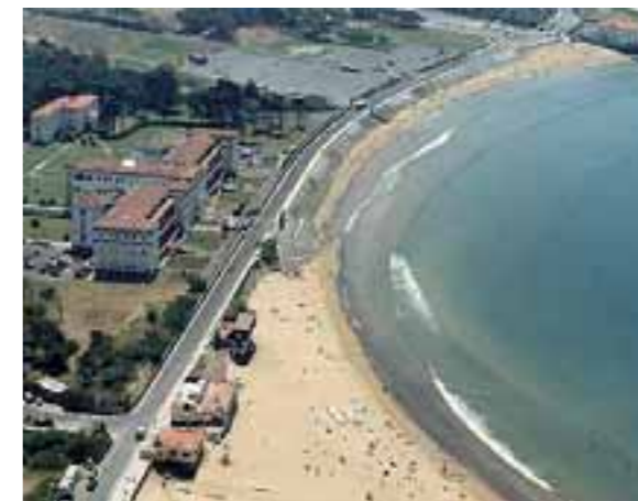
Antes / Lehen

INVERSIÓN: 10.073.532,03 euros (año 2010).