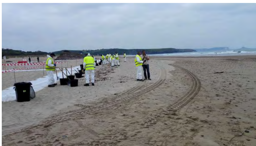
Figura 3: Instalación de pasillos en la playa

En este grupo se expuso el procedimiento para la limpieza de una zona contaminada con hidrocarburos mediante el empleo de herramientas manuales (palas, rastrillos, espátulas...) tratando de recoger la menor cantidad de arena posible. Además, se expuso a los intervinientes la metodología adecuada para delimitar la zona de intervención (área a limpiar) así como el establecimiento de zonas de paso mediante corredores sucios, de descontaminación y limpios empleando para ello láminas de polietileno, jalones de señalización y cinta de balizamiento.