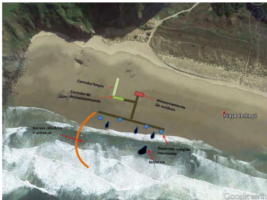
Figura 5: Esquema de la zona de actuación

Se han creado pasillos y zonas de intervención limitados con jalones y cordón de balizamiento necesarios para organizar el tránsito de los intervinientes por la playa. Para minimizar la contaminación secundaria, estos pasillos se han cubierto con lámina de polipropileno permitiendo así que los participantes en un vertido real puedan circular por la playa sin transferir la contaminación. Se ha dispuesto también una zona de descontaminación, instalándose además contenedores para desechar los EPI's contaminados.