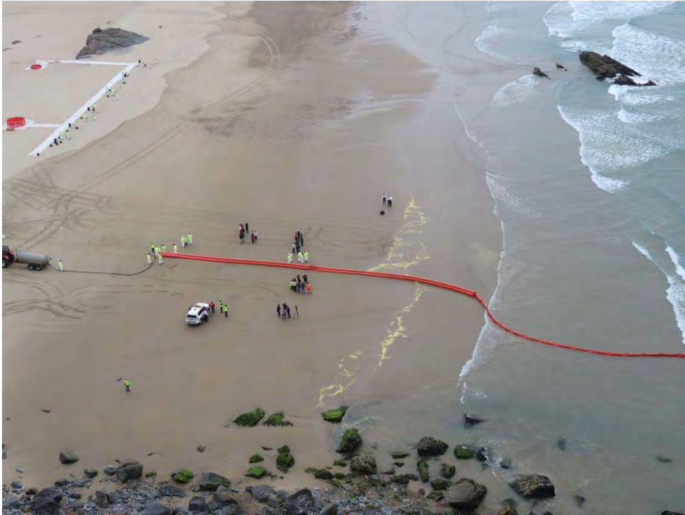
Figura 7: Despliegue barrera cilíndrica en el mar