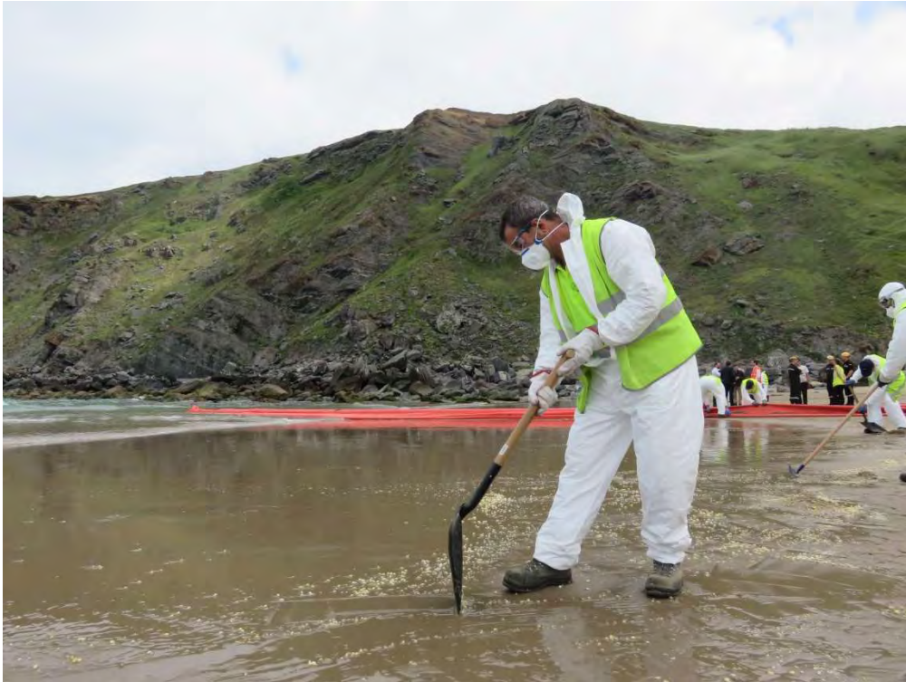
Figura 9: Recogida manual del vertido simulado

Una vez recogido el vertido simulado, se ha recogido todo el material desplegado en la zona, transportándolo a la base de Pontevedra donde se ha llevado a cabo su limpieza y almacenamiento.