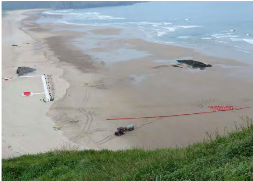
Figura 6: Despliegue barrera cilíndrica en la playa