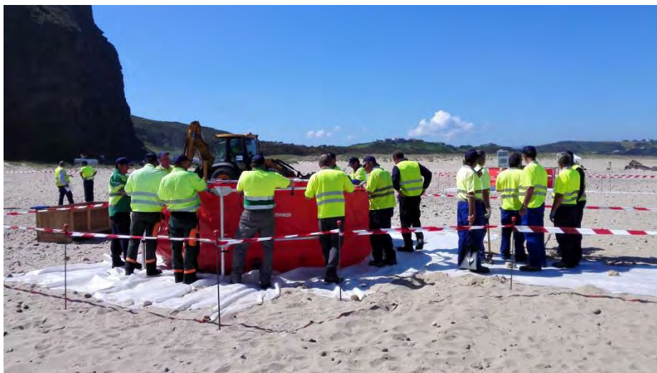
Figura 2: Depósito 10.000 l con estructura metálica

En este grupo el personal interviniente ha procedido a desplegar y replegar los depósitos de 10.000 litros con estructura metálica y a establecer una zona de protección con geotextil bajo dichos depósitos a fin de evitar pinchazos y roturas en los mismos. Estos depósitos se emplean como almacén de residuos previo a su transporte por gestor autorizado.