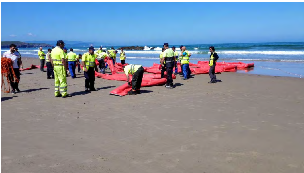
Figura 4: Tendido de barrera cilíndrica

Una vez la embarcación recogió el cabo, se procedió al despliegue de la barrera, no sin dificultades debido al fuerte oleaje que reinaba en la playa. Cuando la maniobra estaba prácticamente completada, el cabo de la barrera no resistió la tensión a la que estaba sometido por el fuerte oleaje y se desgajó, dejando la barrera a la deriva. Los equipos de TRAGSA presentes en la playa actuaron rápidamente y pudieron recuperar la barrera desde tierra sin que sufriera daños.