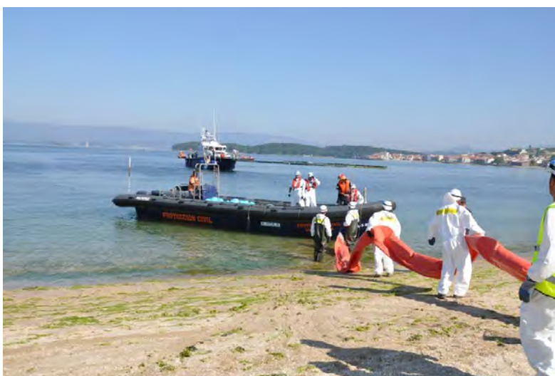
Figura 7: Despliegue barrera cilíndrica en la playa