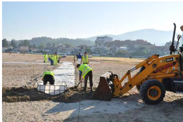
Figura 3: Instalación de pasillos en la playa

En este grupo se expuso el procedimiento para la limpieza de una zona contaminada con hidrocarburos mediante el empleo de herramientas manuales (palas, rastrillos, espátulas...) tratando de recoger la menor cantidad de arena posible. Además, se expuso a los intervinientes la metodología adecuada para delimitar la zona de intervención (área a limpiar) así como el establecimiento de zonas de paso mediante corredores sucios, de descontaminación y limpios empleando para ello láminas de polietileno, jalones de señalización y cinta de balizamiento.