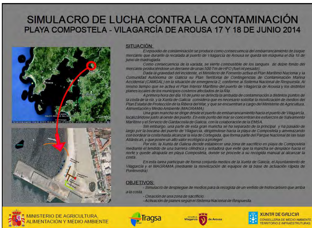
Figura 6: Cartelería del Ejercicio