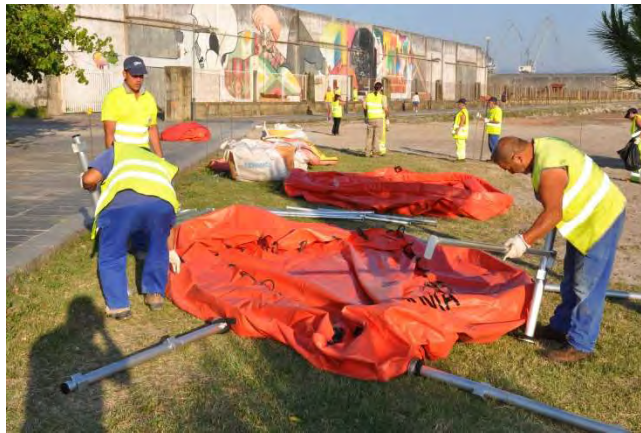
Figura 2: Depósito 10.000 L con estructura metálica