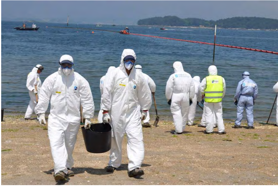
Figura 12: Recogida manual

Una vez recogido el vertido simulado, se ha recogido todo el material desplegado en la zona, transportándolo a la base de Pontevedra donde se ha llevado a cabo su limpieza y almacenamiento.