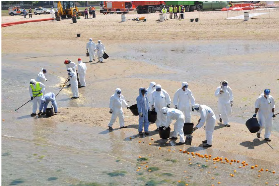
Figura 11: Recogida manual

Para simular la limpieza de un vertido en la costa se han dispuesto 4 cuadrillas de operarios con los EPI's correspondientes y las herramientas necesarias simulando el vertido con mandarinas. Los intervinientes, por equipos de dos, han recogido y transportado el vertido hasta los puntos intermedios de almacenamiento a través de los corredores sucios establecidos a tal efecto. El contaminante almacenado en estos puntos intermedios se ha trasladado a su vez hasta la zona de almacenamiento de residuos desde donde, en un vertido real, un gestor de residuos se encargaría de su retirada y tratamiento.