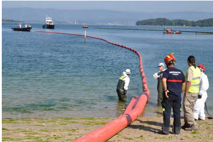
Figura 8: Despliegue barrera cilíndrica en el mar