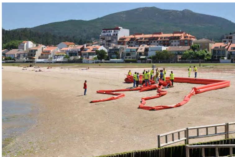
Figura 4: Tendido de barrera cilíndrica y selladora

ha procedido al despliegue de las barreras selladoras, 2 tramos de 25 m., y a su inflado con la ayuda de una herramienta sopladora. Una vez desplegados ambos tipos de barreras, se ha procedido a empatarlas para comprobar el correcto funcionamiento de las conexiones, obteniendo un total de 125 m. de barrera para el despliegue en el mar, que se realizó al día siguiente.