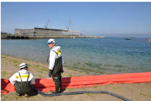
Figura 9: Llenado de barrera selladora