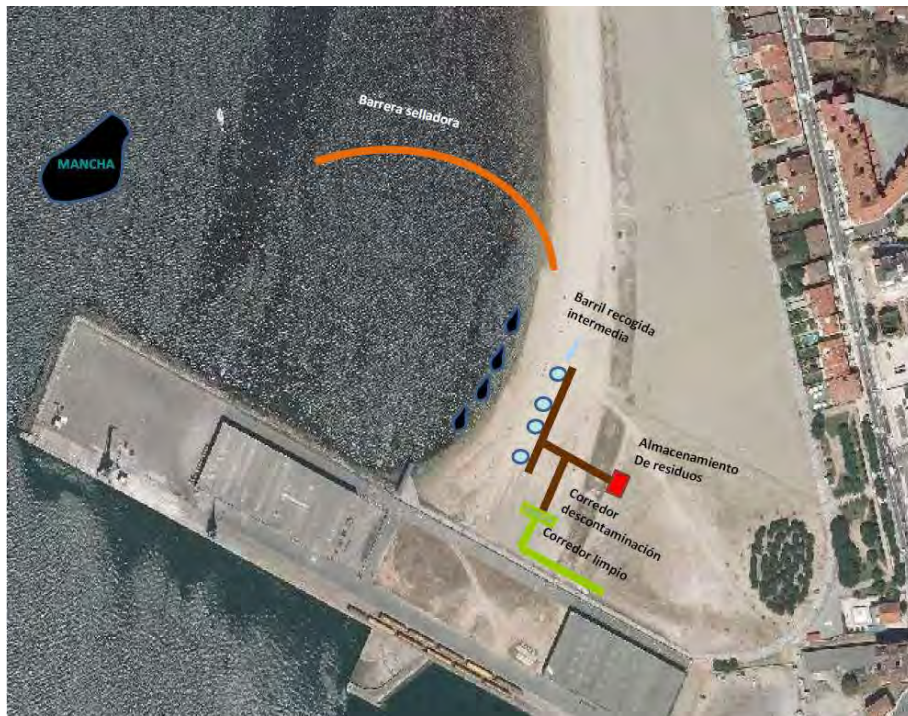
Figura 5: Esquema de la zona de actuación