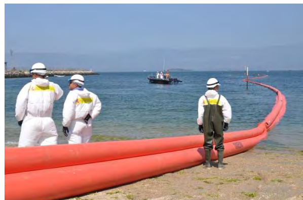
Figura 10: Barrera selladora desplegada